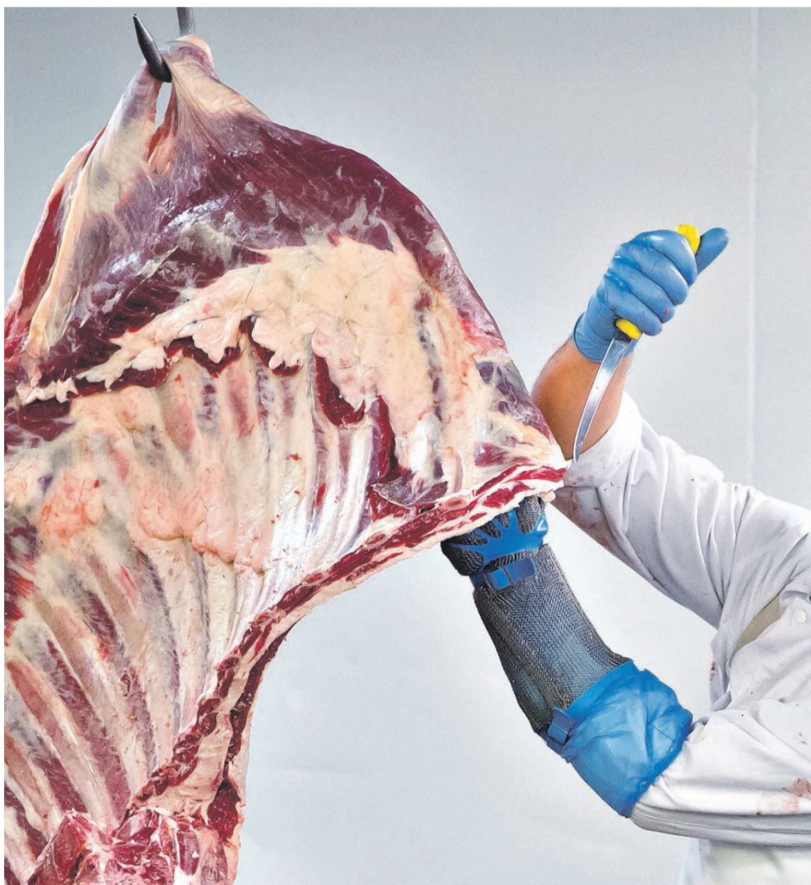
Поставлять туши для «Ашана» будут крестьянско-фермерские хозяйства, которым ретейлер, в частности, будет оплачивать последние 100 дней откорма животных

«Подобных мощностей в мясопереработке нет ни у одного российского ретейлера, — отмечает Хотько. —