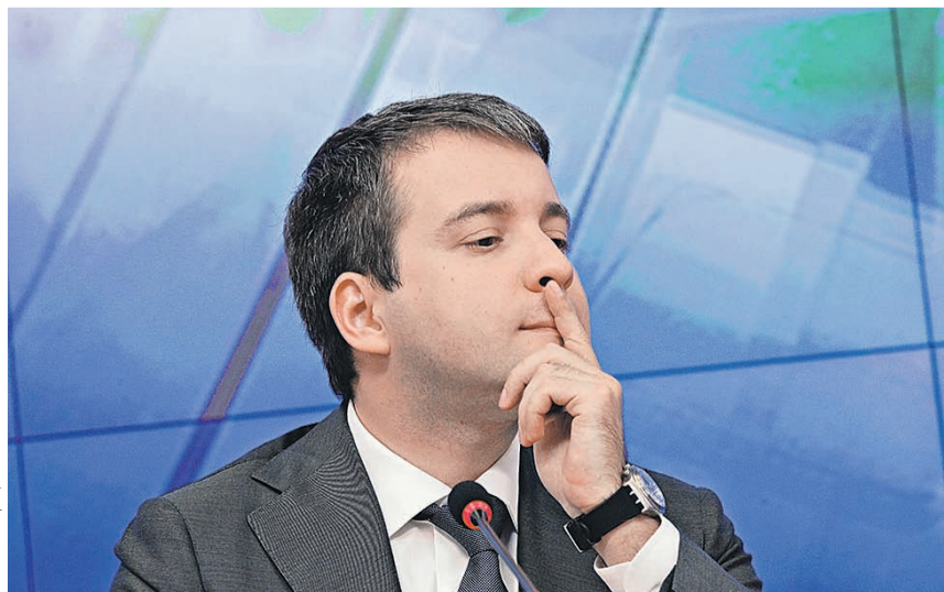
Ведомство Николая Никифорова (на фото) считает, что сейчас сообщества по управлению авторскими правами работают недостаточно прозрачно

На фоне проверки ЦБ агентство «Рурсрейтинг» понизило рейтинги банков и компаний, входящих в группу «Лайф». Рейтинги были понижены крупнейшему банку группы Пробизнесбанку (с ВВ+ до ССС по международной шкале). Агентство объяснило свои действия ростом репутационных и регуляторных рисков с введением в банке временной администрации и отключением его от системы банковских электронных платежей. Также понижены рейтинги Газэнергобанка, Вуз-банка, КБ «Пойдем!», банка «Экспресс-Волга», факторинговой компании «Лайф». В сообщении агентства указывается, что некоторые банки группы концентрировались на привлечении ресурсов за счет частных вкладчиков, «наиболее подверженных паническому настроению в условиях ухудшения ситуации в банковском секторе». ■