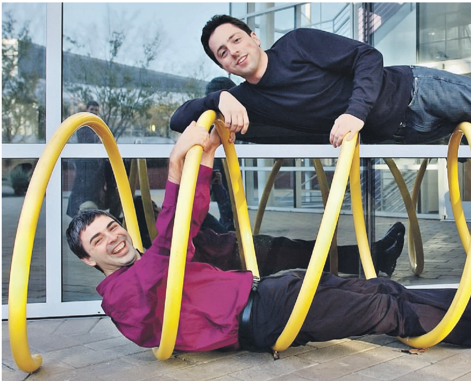
Основатели интернет-гиганта Сергей Брин (сверху) и Ларри Пейдж (снизу) всегда говорили, что Google никогда не был и не намеревался становиться обычной компанией

Пейдж вместе с Брином встанет у руля новой холдинговой компании в качестве генерального директора, Брин будет президентом Alphabet. Пост финансового директора уйдет Рут Порат, которую Google ранее переманил из Morgan Stanley. Гендиректором Google (основного бизнеса Alphabet) вместо Ларри Пейджа назначен Сундар Пичаи — до этого старший вице-президент по продуктам Google (браузер Chrome, мобильная операционная система Android, приложения).