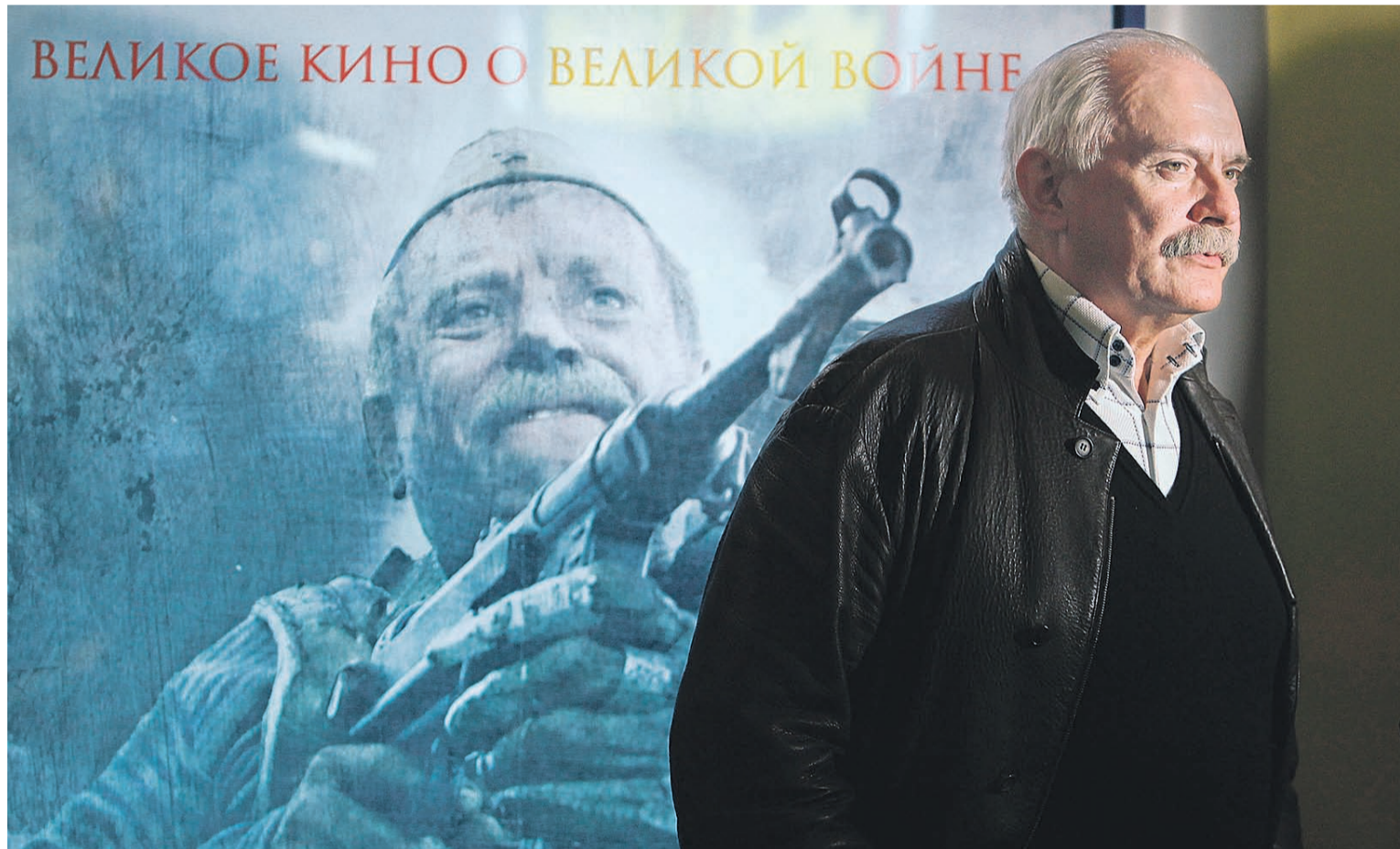
Минкомсвязи неожиданно бросило вызов главному покровителю обществ по управлению авторскими правами Никите Михалкову