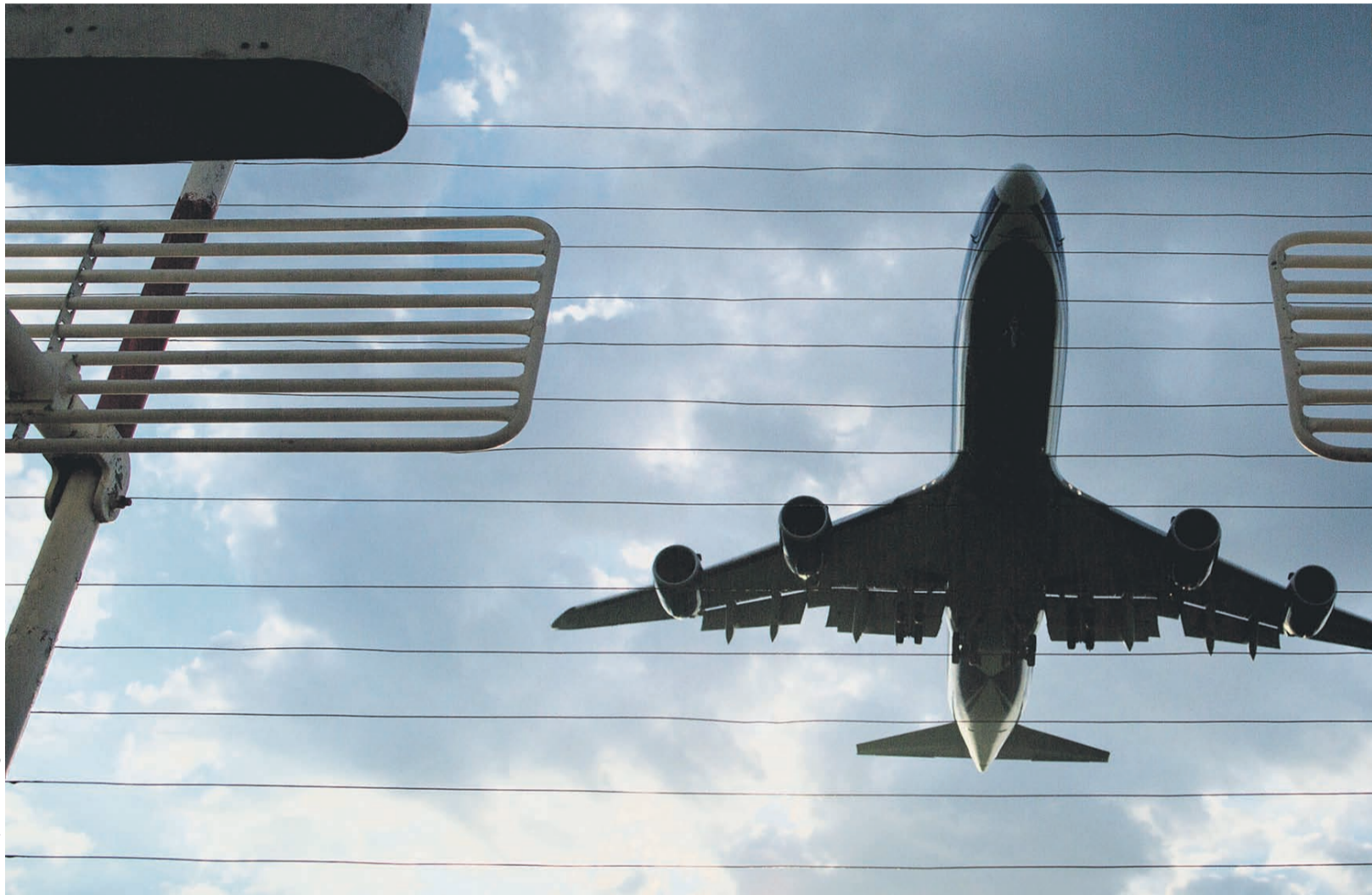
Изначально аэропорты хотели получить из ФНБ 71,68 млрд руб., но сейчас они оценивают проекты из заявок уже в 82–86 млрд

По словам представителя дирекции МТУ, оптимизировать затраты сначала решили за счет железнодорожной ча-