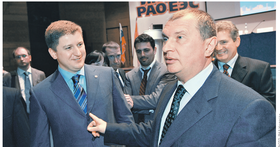
↑ В «Интер РАО» Дод, будучи выходцем из команды Чубайса, сумел сблизиться с председателем совета директоров компании Игорем Сечиным — последовательным противником реформы РАО «ЕЭС». Именно вице-премьер Сечин в 2009 году рекомендовал Дода в руководители «РусГидро». В интервью 2014 года Дод называл Сечина «старшим товарищем»