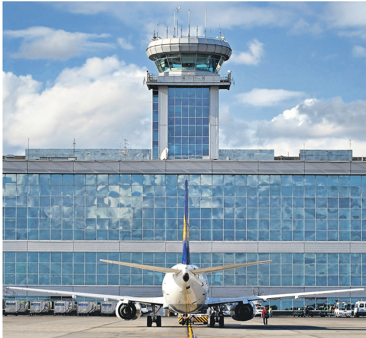
Зарезервированная аэропортом сумма на счетах позволила следствию отказаться от идеи ареста недвижимости

По словам официального представителя Следственного комитета Владимира Маркина, арест средств нужен для того, чтобы обеспечить компенсацию ущерба потерпевших от теракта в аэропорту. При этом Маркин напомнил, что ранее руководством аэропорта Домоде-