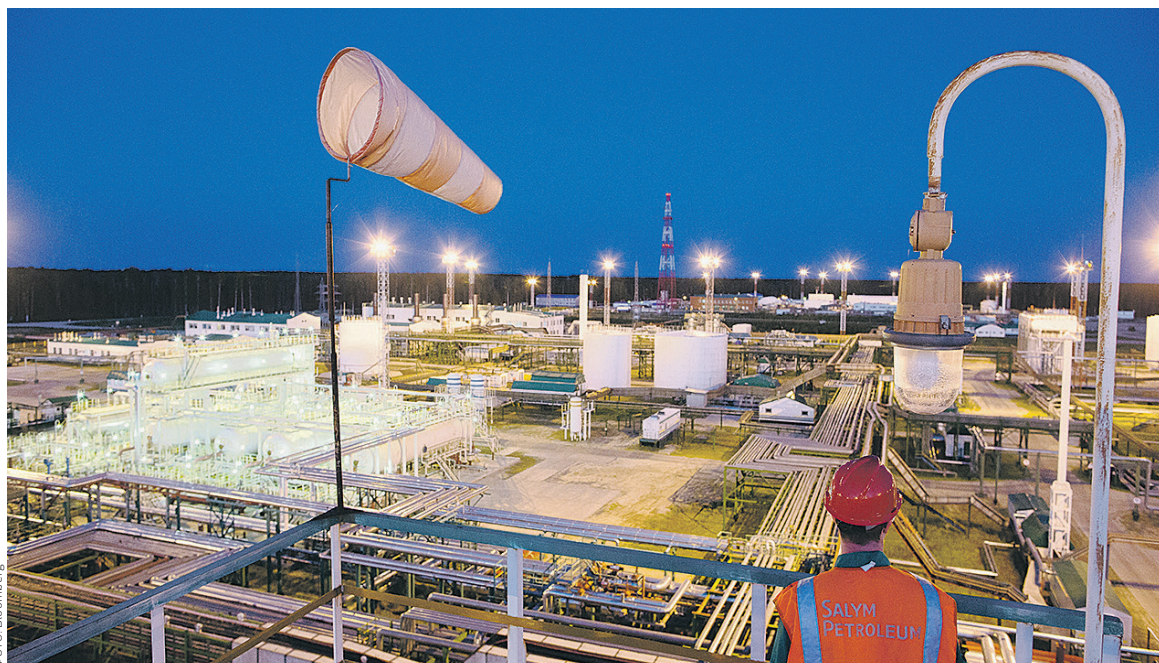
Нефтяники опасаются, что новые правила валютного контроля могут сказаться в том числе на финансировании инновационных проектов в России с участием иностранных инвесторов. На фото: нефтехранилище проекта «Салым Петролеум» — СП «Газпром нефти» и Shell, в рамках которого они осваивают месторождения в ХМАО

По информации «Интерфакса», опасения компаний связаны с законопроектом, который предполагает внесение поправок в закон о валютном регулировании и валютном контроле и в кодекс об административных нарушениях. Поправки обязывают российские физические и юридические лица по истечении срока договора возвращать в страну займы, выданные зарубежным компаниям и гражданам. Таким образом авторы закона хотят закрыть лазейку для вывода денег из страны.