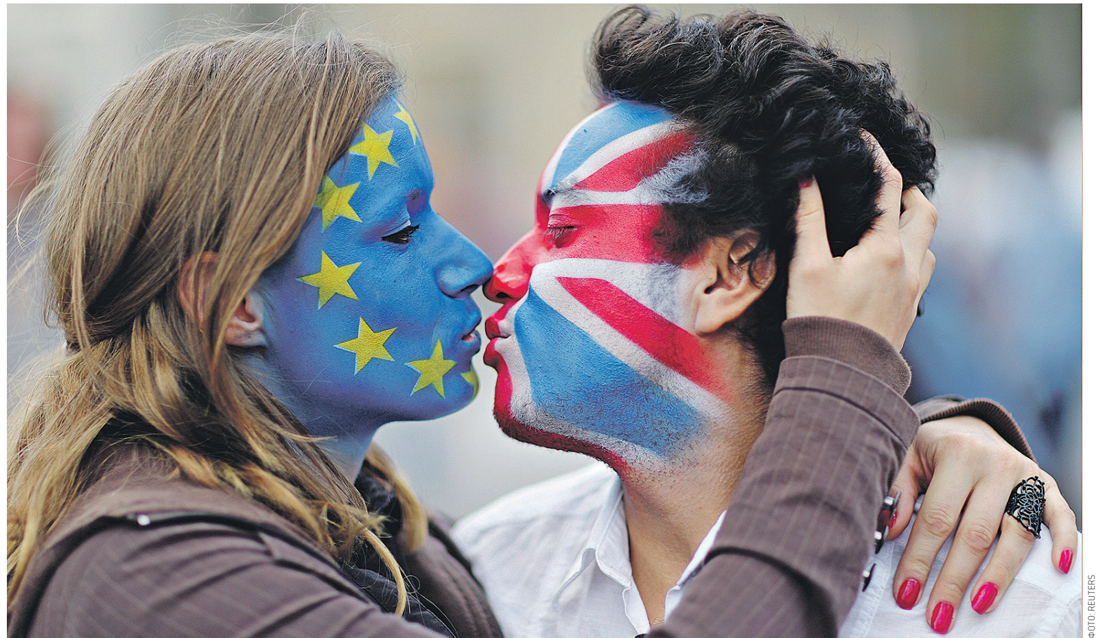
Противники Brexit протестуют в Берлине