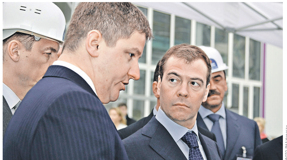
↑ Несмотря на то что в 2014 году Дода переизбрали председателем правления «РусГидро» на следующие пять лет, в сентябре 2015 года он ушел в отставку по собственному желанию. Премьер-министр Дмитрий Медведев утвердил ее без промедления. В марте 2016 года Дод возглавил энергокомпанию «Квадра», подконтрольную группе ОНЭКСИМ миллиардера Михаила Прохорова