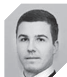
Алексей Галкин** Минэконом- развития РФ