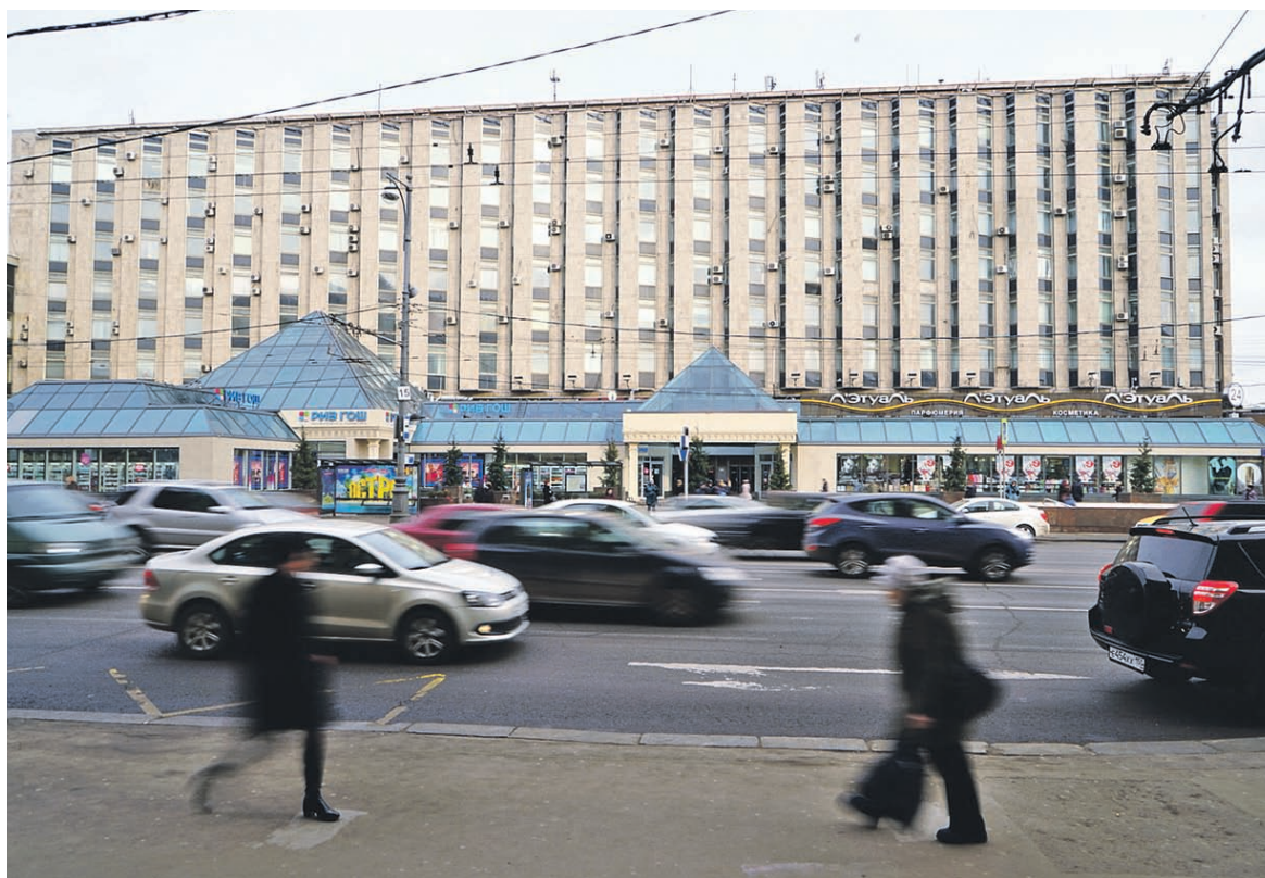
Торговый комплекс «Пирамида» на Тверской пока стоит на месте. Владельцам предписано снести его до 23 февраля

В продуктивном магазине в качестве предупреждения отключали свет, но потом электроснабжение восстановили, поэтому 8 февраля магазин был еще полон товара. Мы в спешке выносили все: хлеб, кефир, молоко. Мой офис сейчас до отказа завален продуктами».