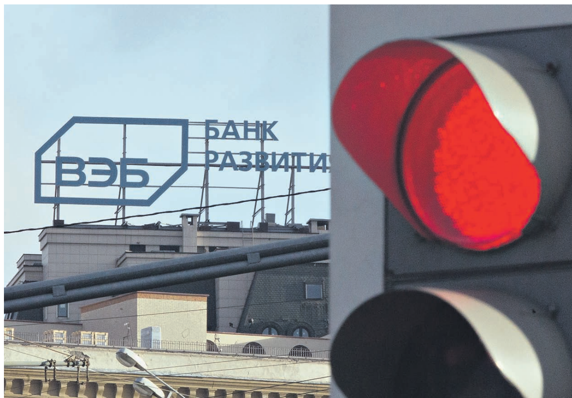
В 2015 году ВЭБ показал лучшую доходность за 11 лет управления пенсионными накоплениями

По закону с 2016 года взносы «молчунов» больше не будут идти на накопительную часть пенсии; 22% от заработной платы будут полностью направляться на страховую часть пенсии. Желающим продолжить отчислять взносы на накопительную часть пенсии необходимо было до конца 2015 года передать свои накопления в частный пенсионный фонд или оставить свои средства в ПФР, но написать заявление о своем желании продолжить накапливать.