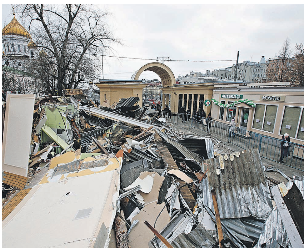
↑ Около 23:30 8 февраля, перед началом сноса павильонов у станции метро «Кропоткинская», несколько десятков человек пытались противостоять полиции и спецтехнике. Шесть человек забаррикадировались в павильоне салона сотовой связи. Но торговые ряды с одной стороны от входа в метро ночью все равно были снесены