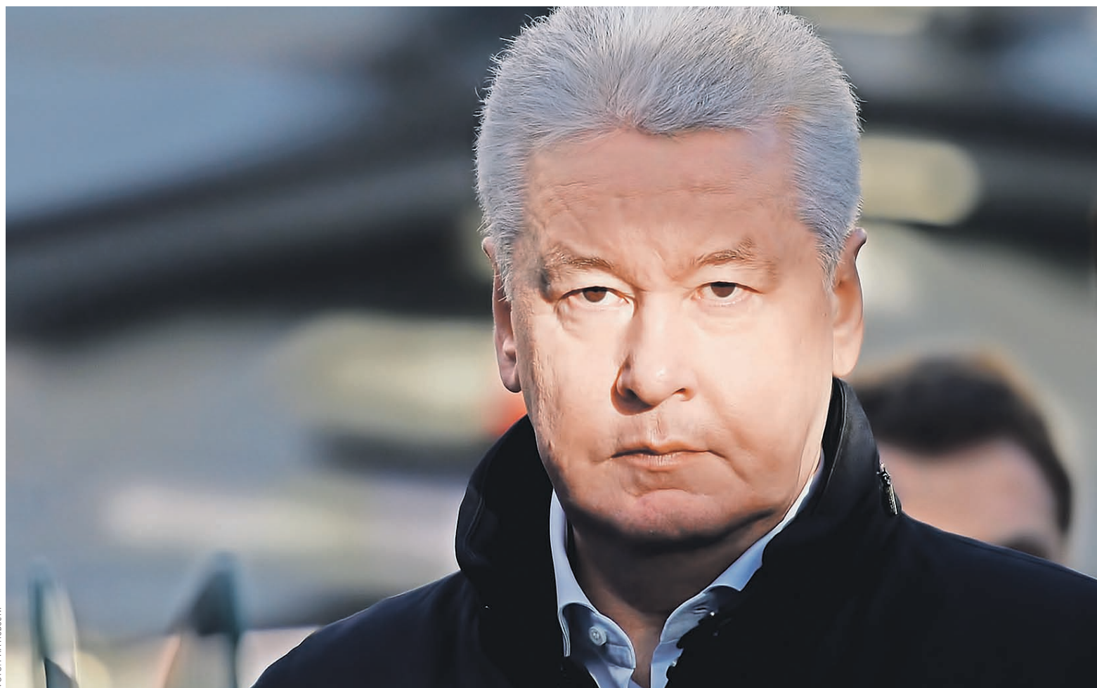
Мэр Москвы Сергей Собянин наказывает бизнес без суда