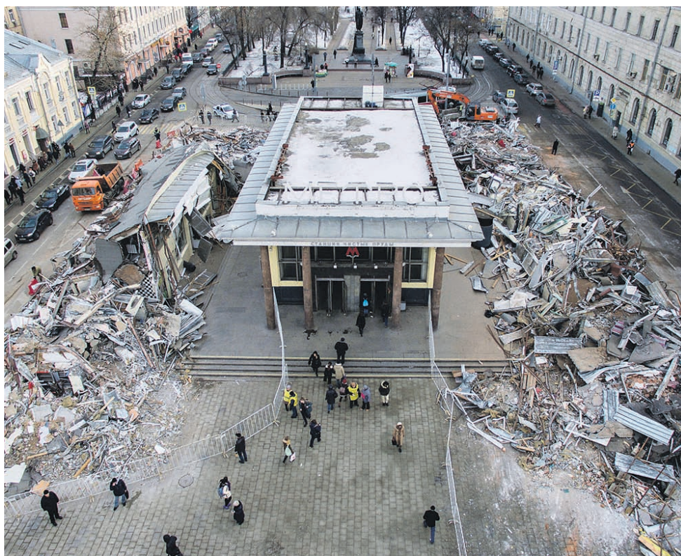
↑ В снесенных павильонах ТК «Чистые пруды» на площади Мясницких ворот работали в общей сложности 318 человек. У всех собственников были зарегистрированные права и действующий договор аренды до 2030 года