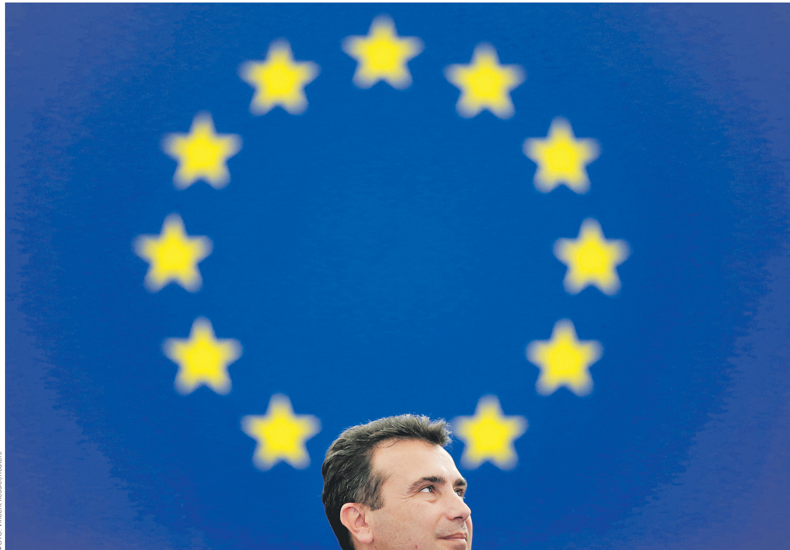
В июне премьер-министр Македонии Зоран Заев (на фото) договорился с Грецией об изменении названия страны. Спор по этому вопросу продолжался почти 30 лет

Из-за того что Македония продолжала использовать название, которое не нравилось грекам, Афины блокировали ее вступление в НАТО. 17 июня Заев и Ципрас подписали соглашение, по которому новым названием балканской страны будет «Северная Республика Македония». 20 июня документ был ратифицирован парламентом республики. Теперь ее населению предстоит принять — или отвергнуть — изме-