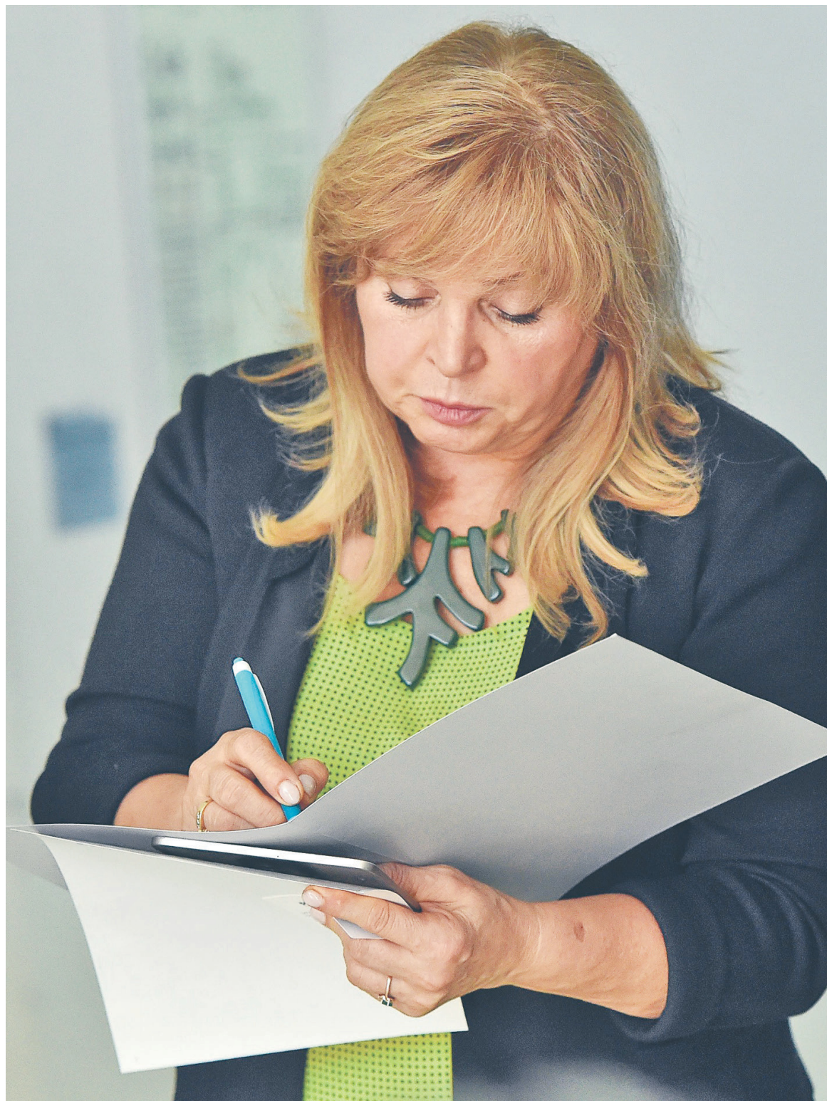
По поручению главы ЦИК Эллы Памфиловой в Приморье выехала группа для анализа поступивших в краевой избирком жалоб