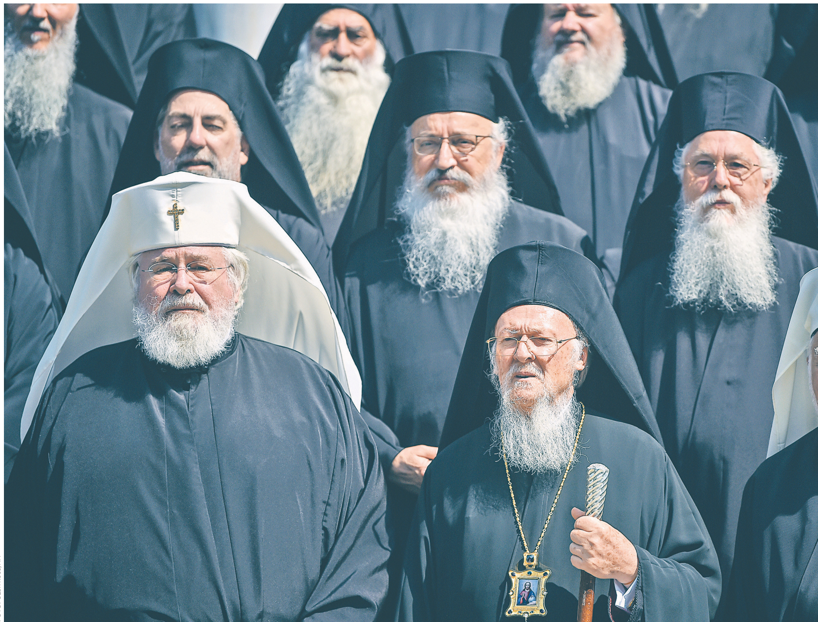
Начинающемуся в Стамбуле священному синоду Константинопольского патриархата предшествовал синаксис иерархии Вселенского престола (на фото, в первом ряду в центре — патриарх Варфоломей) в церкви Святой Софии

Начинающееся во вторник, 9 октября, в Стамбуле заседание священного синода Константинопольского патриархата под председательством Вселенского патриарха Варфоломея продлится до 11 октября. Его повестка не раскрывается. Однако на Украине надеются, что результаты встречи приблизят решение о предоставлении украинской церкви автокефалии (независимости). О том, что вопрос дарования томоса (указа) Вселенским патриархом выходит на «финишную прямую», 19 сентября говорил президент Украины Петр Порошенко. Признаком того, что Варфоломей готов положительно решить вопрос о придании украинской церкви независимости, по мнению украинского президента, было прибытие на Украину экзархов (посланников) патриарха. Экзархи Варфоломея архиепископ Памфилийский Даниил из США и епископ Эдмонтонский Иларион из Канады прибыли на Украину именно для подготовки к предоставлению автокефалии Украинской православной церкви, говорилось в заявлении об их поездке.