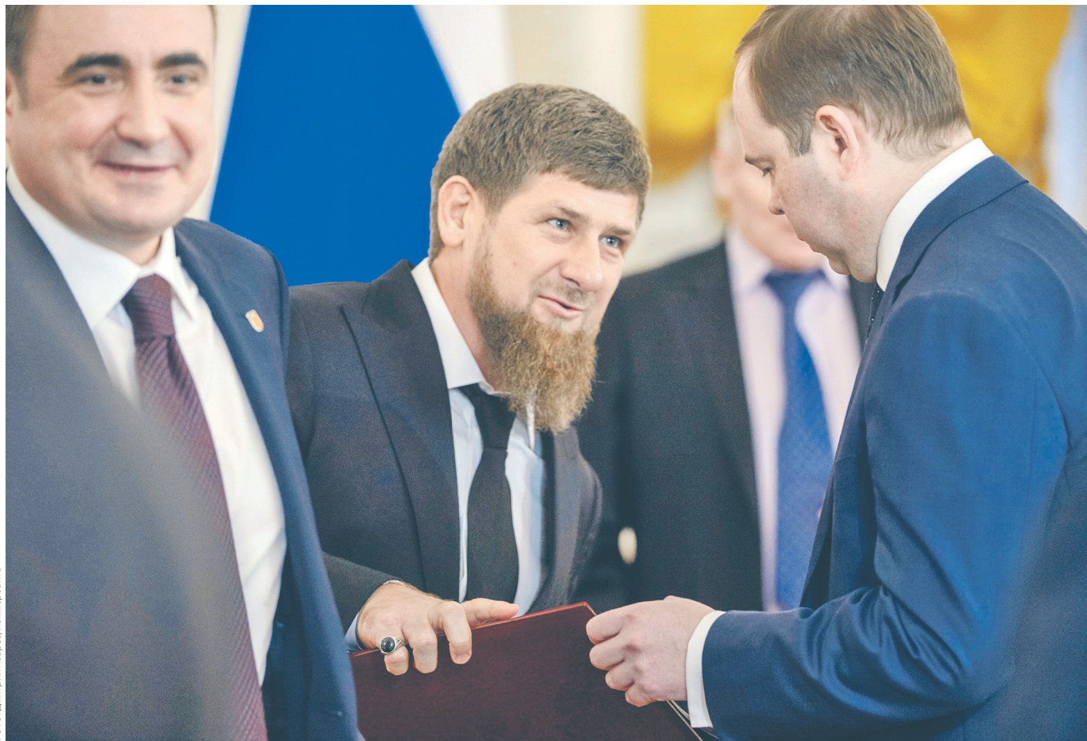
Абсолютным лидером по потенциальной избираемости стал глава Чеченской Республики Рамзан Кадыров (в центре), он получил 5+. Еще одним «отличником» с гарантированным избранием стал губернатор Тульской области Алексей Дюмин (слева)

В частности, в двоечниках — главы Ставрополя, Севастополя, Калмыкии, Алтайского края, Ростовской, Челябинской, Мурманской, Ульяновской областей и Ин-