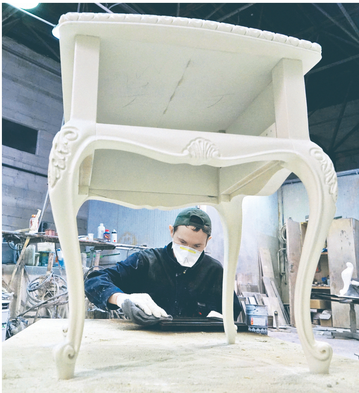
По данным Минпромторга, объем производства отечественной мебели в 2018 году составил 190 млрд руб., около 15% этого объема пришлось на закупки мебели для государственных и муниципальных нужд

Правительство обсуждает переход от ПРЯМОГО ЗАПРЕТА на госзакупки импорта к более мягким ограничениям. Запрет сохранится при закупках для обороны и безопасности, для остальных случаев — ПРАВИЛО «ТРЕТИЙ ЛИШНИЙ» и преференции по цене.