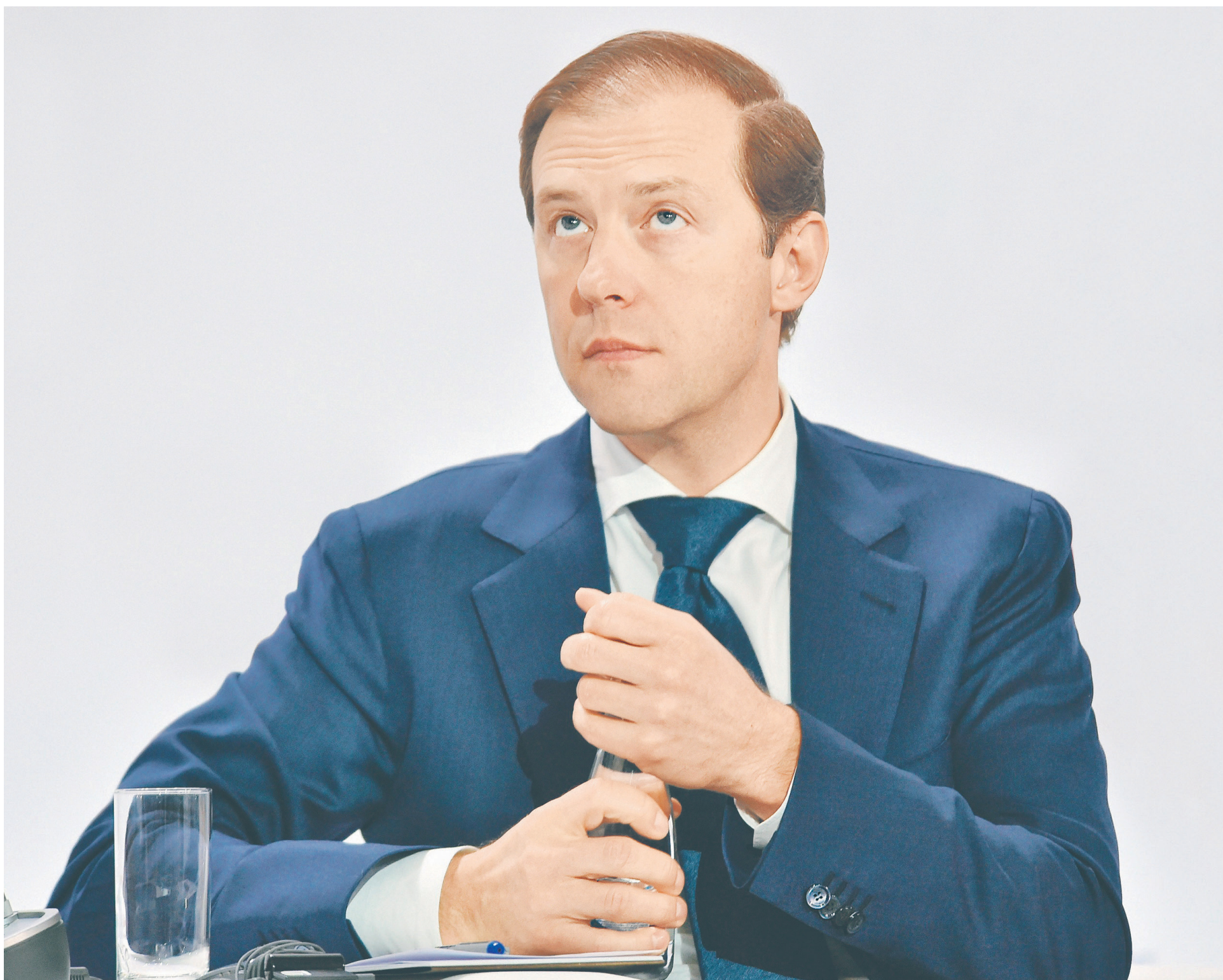
Министр промышленности и торговли Денис Мантуров и его ведомство предлагают не считать пиво алкоголем с точки зрения регулирования продаж, представители пивоваренной отрасли поддерживают инициативу министерства