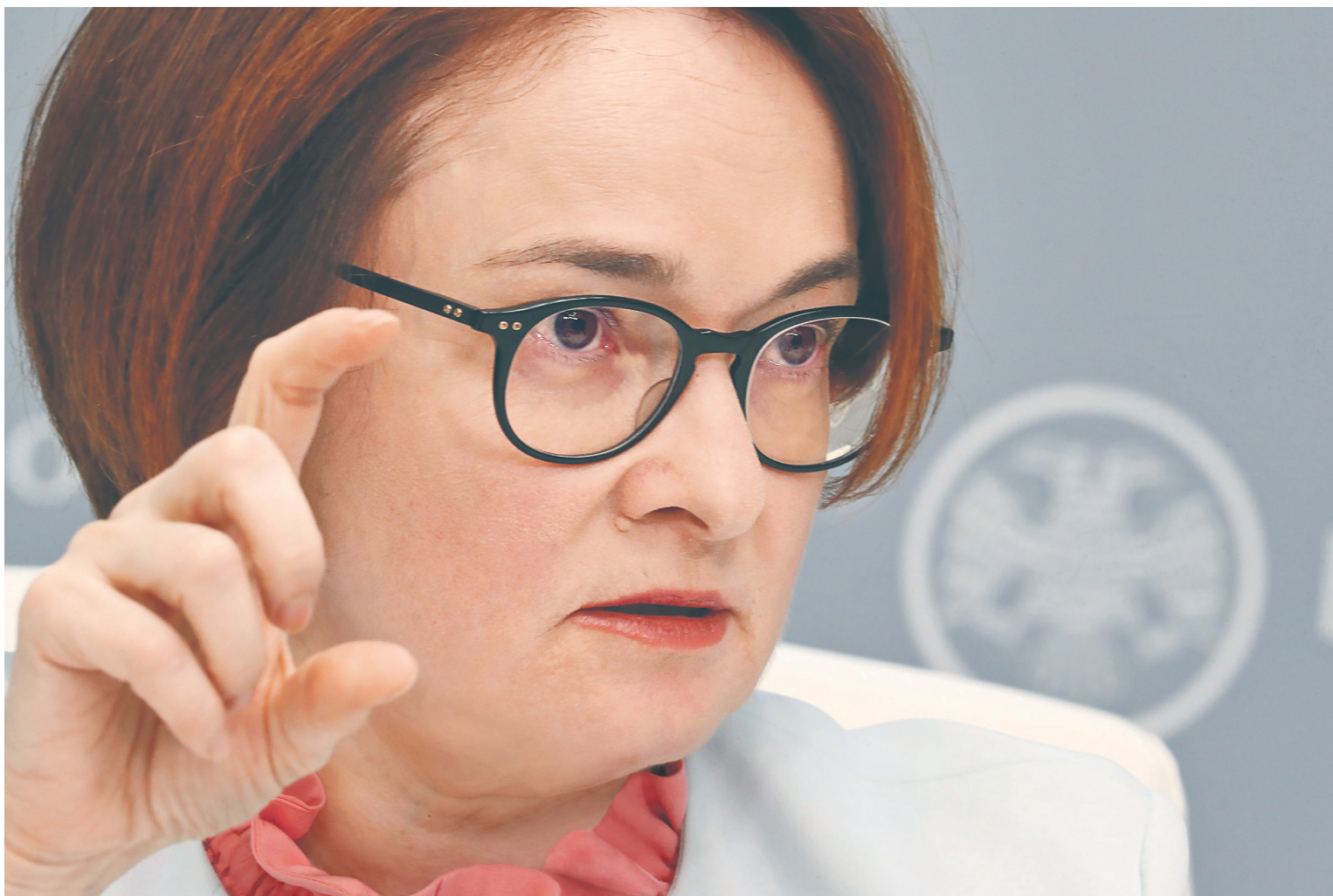
Председатель ЦБ Эльвира Набиуллина признается: нужно время, чтобы понять, верно ли регулятор оценил нейтральный диапазон ключевой ставки, и прежде всего — понять, насколько устойчиво инфляция держится около 4%