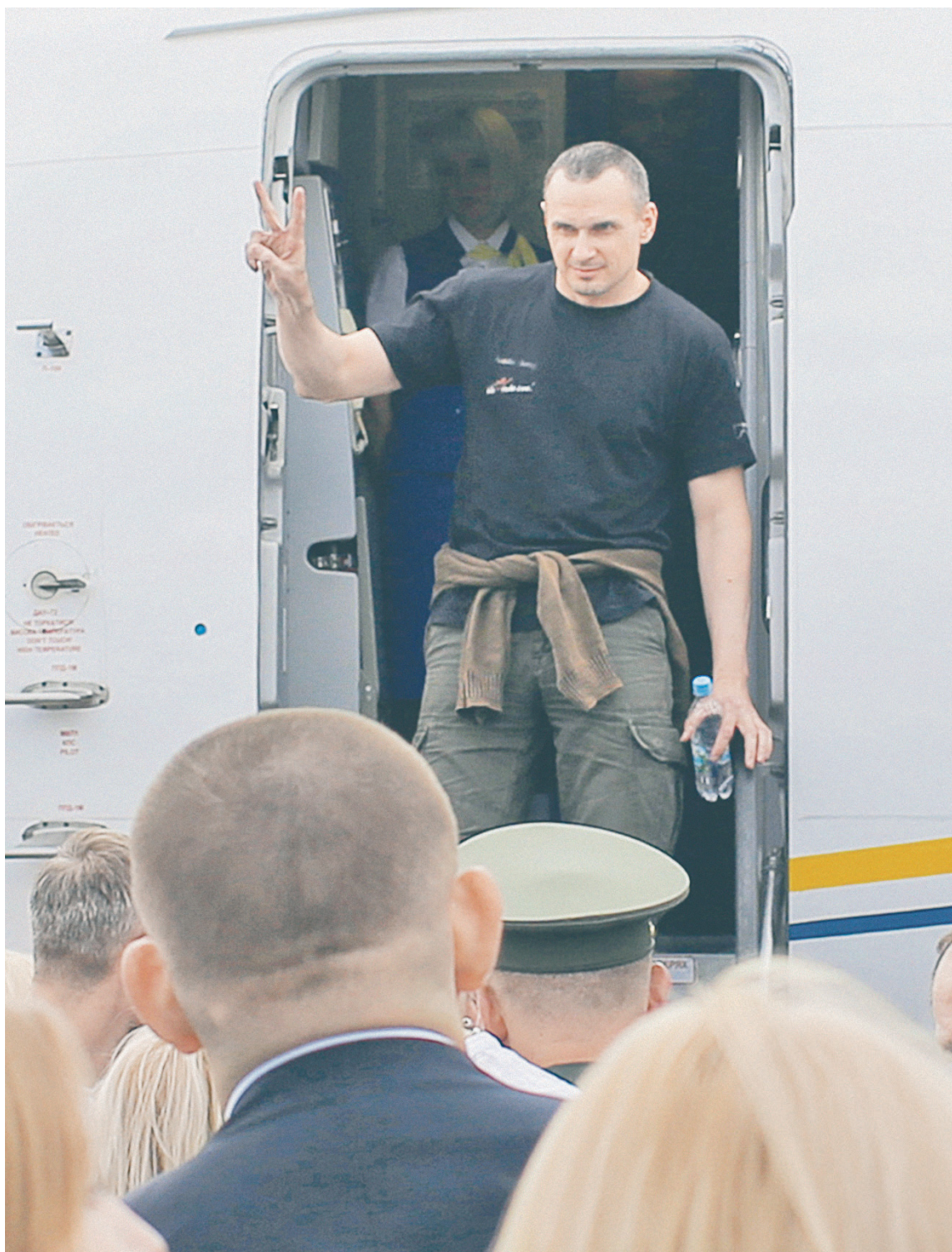
Украинский режиссер Олег Сенцов, который провел в заключении в России больше пяти лет, в киевском аэропорту был встречен на высшем уровне

В свою очередь, в Россию прилетели журналист КИРИЛЛ ВЫШИНСКИЙ и военный из ДНР ВЛАДИМИР ЦЕМАХ.