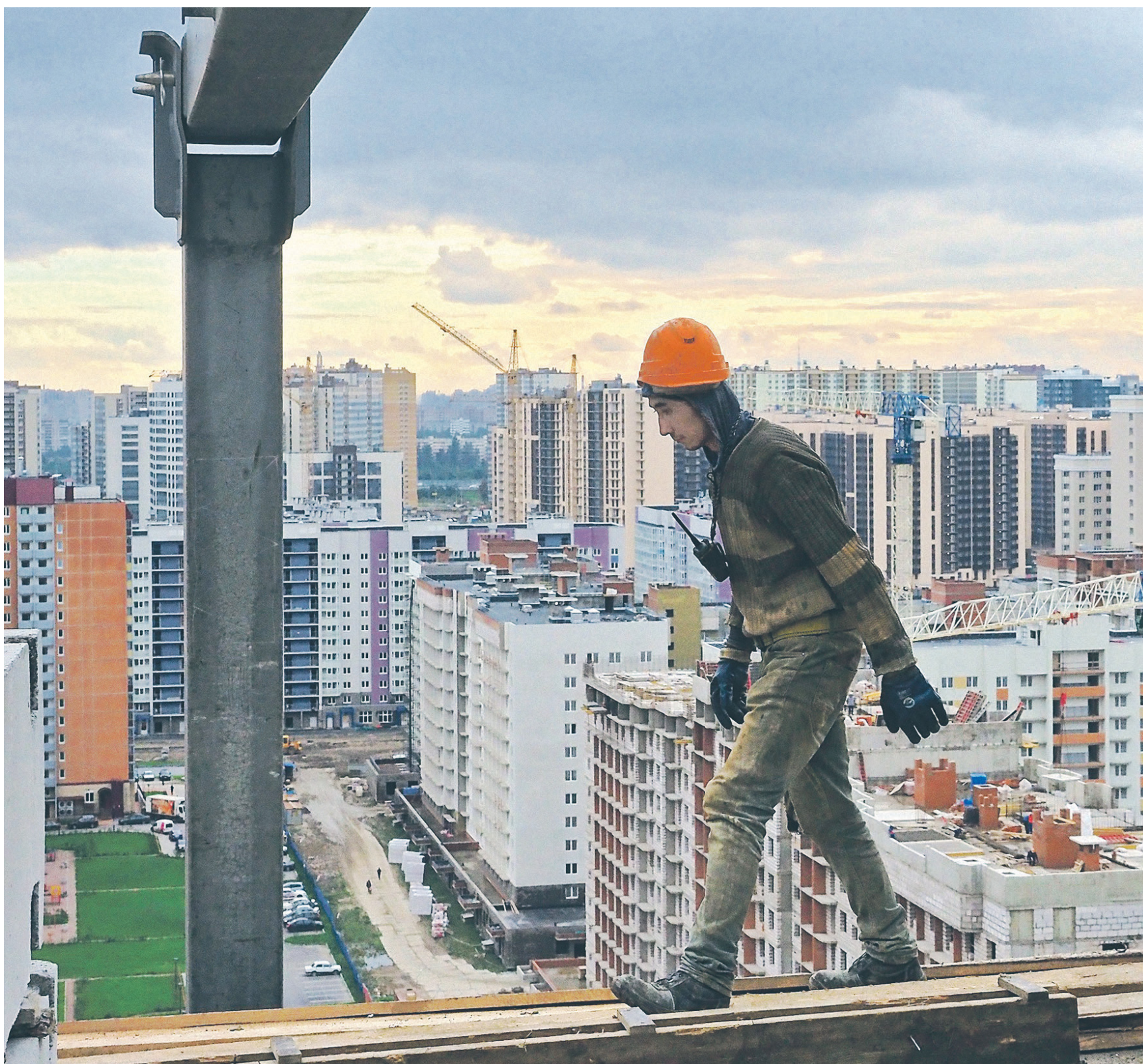
← В Санкт-Петербурге, одном из лидеров спроса на жилье, открыто всего 167 эскроу-счетов с объемом средств 377,6 млн руб. Возможно, это объясняется тем, что большинство жилых проектов в городе получило отсрочку в переходе на эскроу

Кто заработал и кто потерял на холодном московском лете