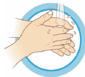
ЧАСТО МОЙТЕ РУКИ С МЫЛОМ