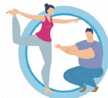
ВЕДИТЕ ЗДОРОВЫЙ ОБРАЗ ЖИЗНИ