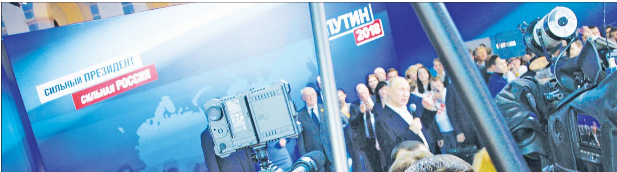
Виталий Бобыльченко находился совсем рядом с избранным президентом России Владимиром Путиным, но пообщаться, увы, не удалось.