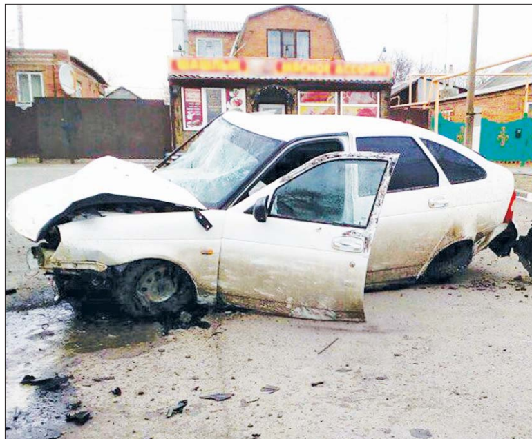
Одна из пострадавших в ДТП машин.

Чудовищная авария произошла в поселке Каменоломни.