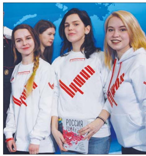
Отличное настроение - залог успешной работы даже в день выборов!