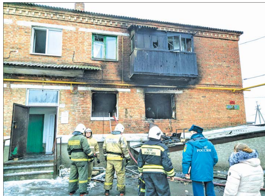
В Шахтах взорвался баллон с пропаном — двое подростков пострадали.