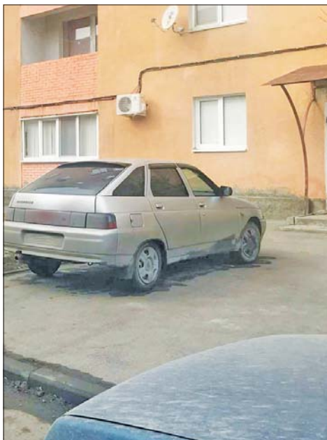
Жители возмущены поведением соседей по подъезду.

— написала Раиса Нестерова (Парфенова). Для того, чтобы пожаловаться, обратитесь в Департамент городского хозяйства по тел. 22-04-87, директор — Леонид Лебединский.