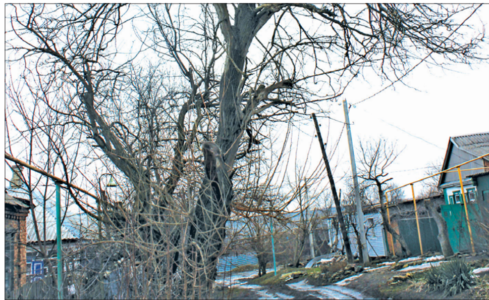
Сухое дерево угрожает жизни горожан.