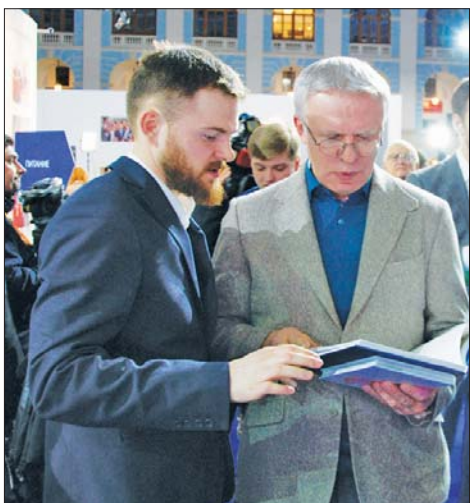
Легендарный хоккеист Вячеслав Фетисов (справа) заинтересованно смотрит новую книгу о культуре.