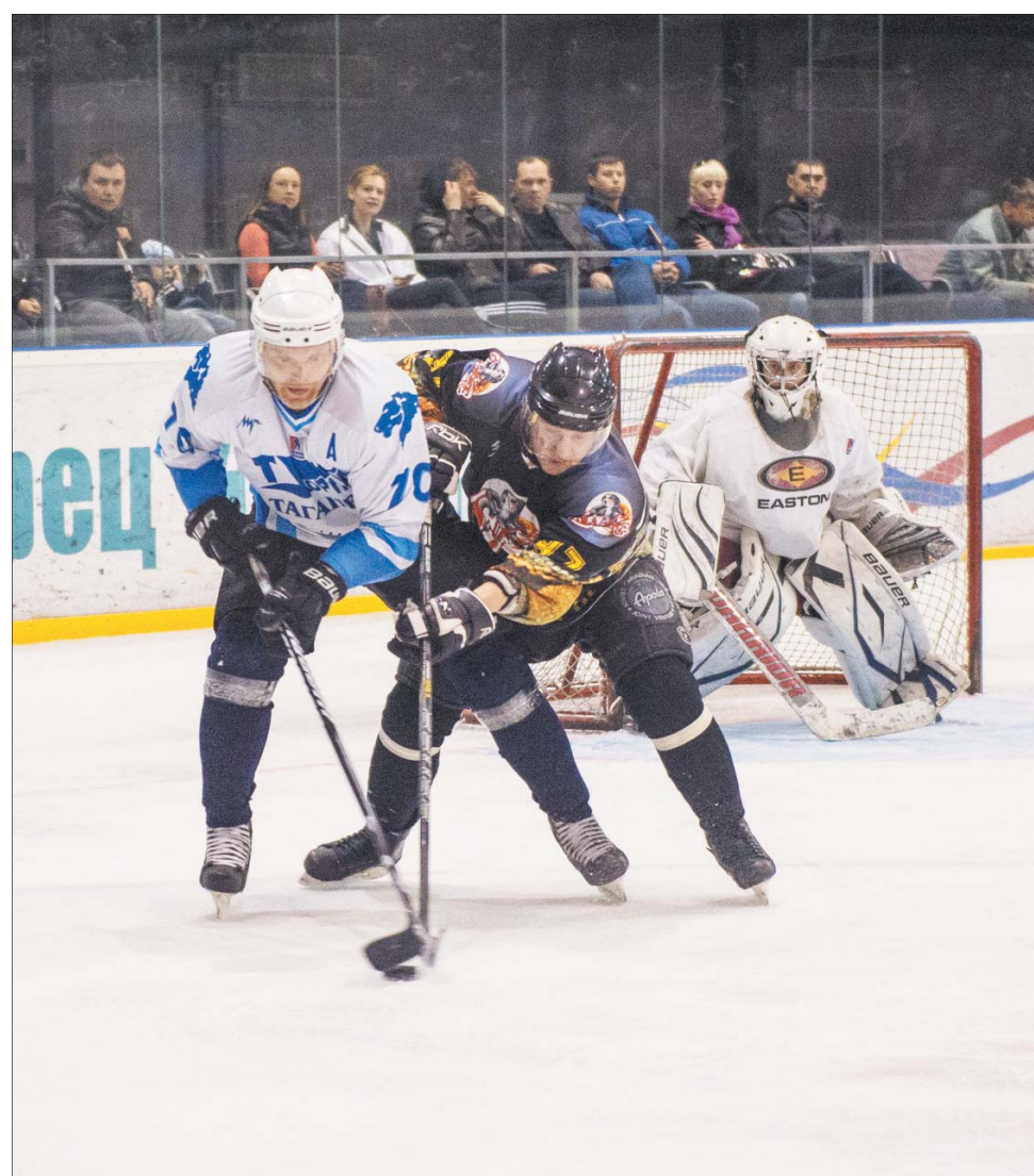
Спустя несколько лет шахтинские «змеи» возвращаются в Сочи.