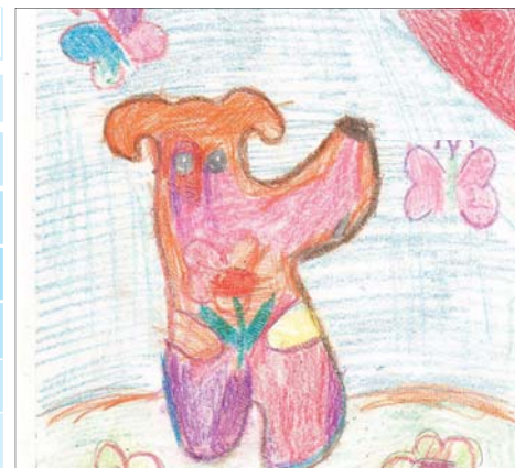
Рисунок Десятова Максима, 6 лет, дет.сад 8.

Прогноз погоды в №14 «КВУ» будет представлять рисунок Малухиной Софьи, 4 года, д.сад 22.