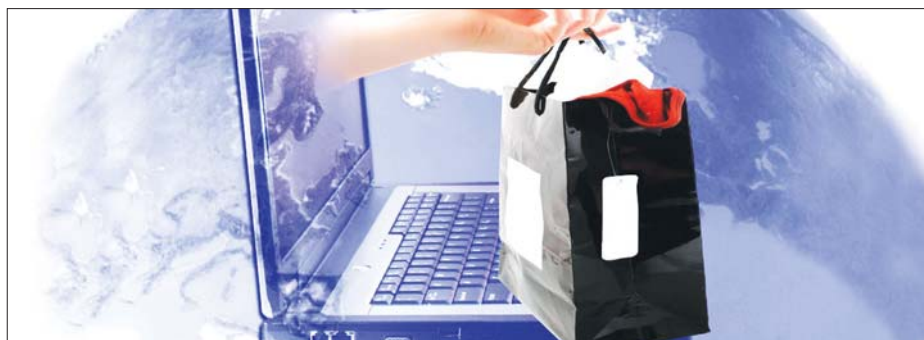
Делать покупки через интернет легко и удобно.

Если приобретаемый товар был в употреблении или в нем устранялся недостаток (недостатки), покупателю должна быть предоставлена информация об этом.