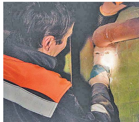
Спасатель достаёт испуганное животное с крыши ДК.