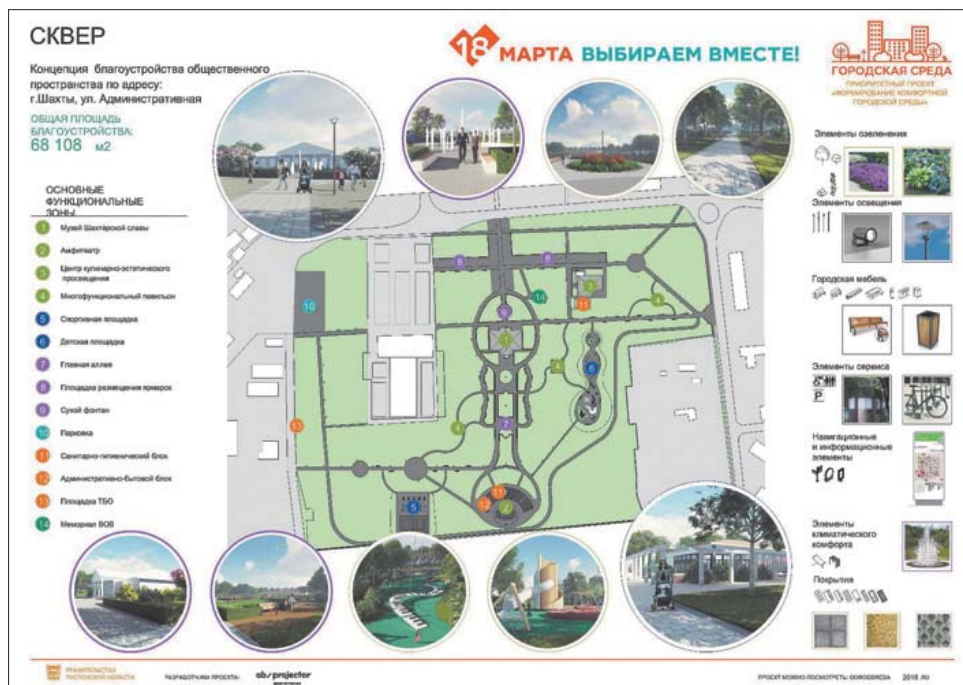
Дизайн-проект сквера на ул.Административной.