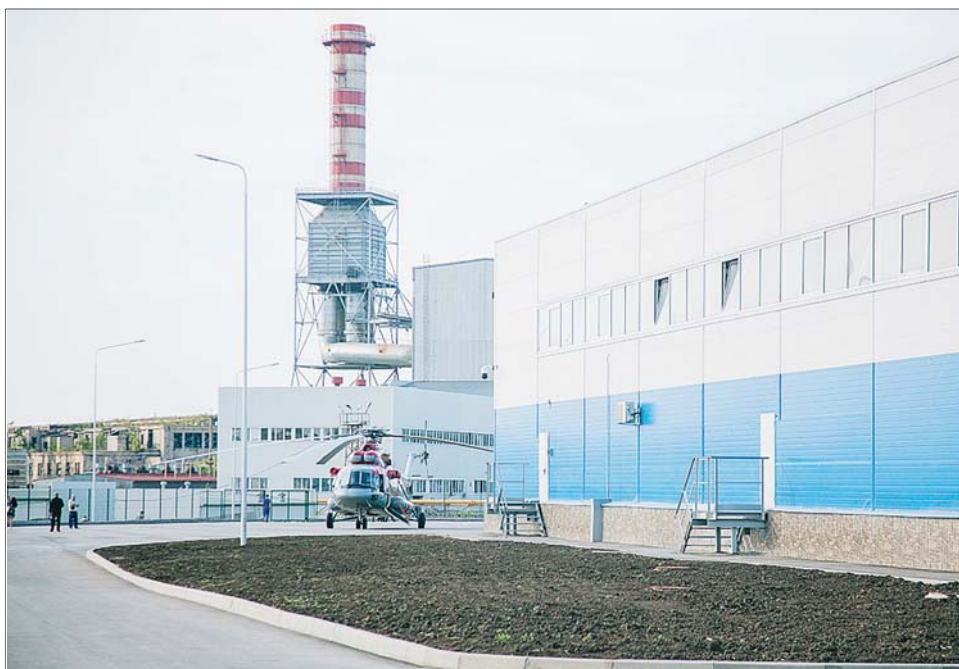
Завод «ВОТЕРФОЛЛ ПРО» заработал в 2017 году 1,5 млрд рублей.

Лидирующую позицию по объему отгруженных товаров собственного производства и выполненных услуг занимает производство текстильных изделий (доля в общем объеме 29,7%).