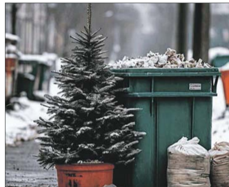
Выбрасывать неподготовленную елку можно только в специальные баки.

Если рядом с вашим домом нет специального бункера, то елку можно выбросить и в обычный контейнер, но следует помнить о некоторых правилах.