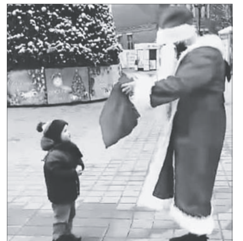
Дети с восторгом подходили к Деду Морозу и рассказывали стихи.