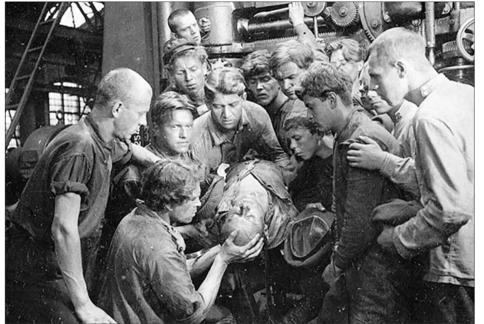
Производственная травма. Кадр из кинофильма «Стачка».

Ради справедливости стоит сказать, что данная больничная касса не была пер-