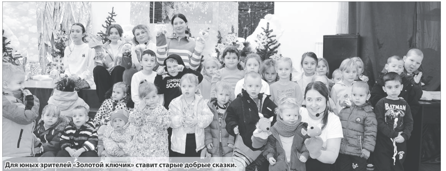
Для юных зрителей «Золотой ключик» ставит старые добрые сказки.

Каждый приезд на гастроли кукольного театра «Золотой ключик», который действует на базе Дома Культуры п. Красногорняцкий Коммунарского сельского поселения, завершается аншлагом. Зал оказывается буквально набитым зрителями. На сегодня в активе «Золотого ключика» более 20 спектаклей. А начиналось все скромно.