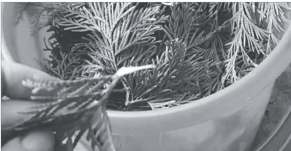
Легче всего зимой и ранней весной укоренить можжевельник, тую и тис.