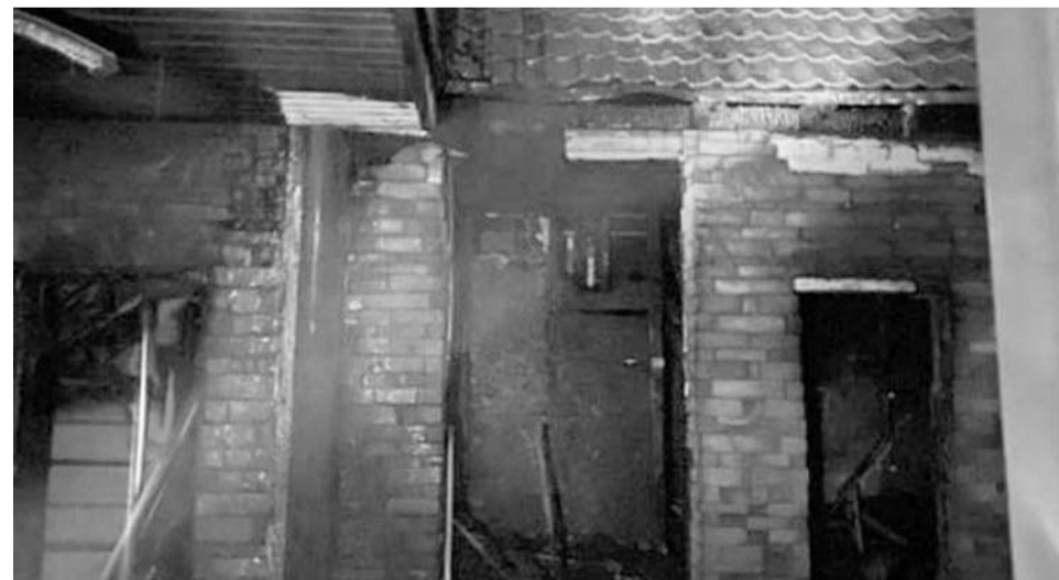
По предварительным данным дом сгорел из-за накалившейся форсунки.