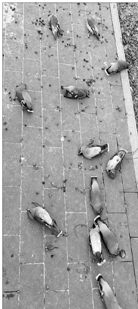
Скорее всего, птицы наелись забродивших ягод из-за чего упали.

В социальных сетях Ростовской области стали появляться фотографии, на которых стая птиц валяется на плитке городского тротуара.