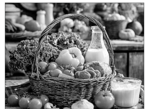
Больше всего цена выросла на репчатый лук и сливочное масло.

Больше всего цена возросла на марку бензина АИ-98. За литр топлива водители на момент 13 января отдавали 62,51 рубль, хотя месяцем ранее оно стоило на 99 копеек дешевле. Марка бензина АИ-92 увеличилась в цене на 65 копеек. Ее стоимость теперь составляет 55,97 рублей. Марка АИ-95 подорожала чуть меньше, но тем не менее для водителей это ощутимая разница в 59 копеек. Ранее бензин стоил 61,52 рубль, теперь же ценник показывает 62,11 рублей.