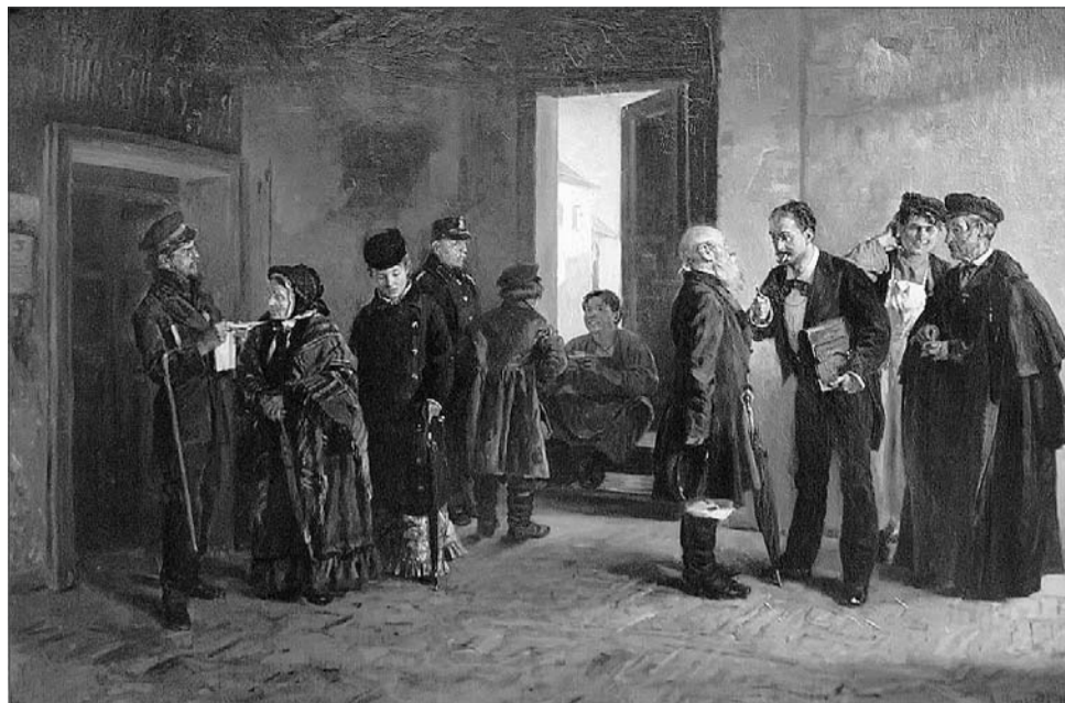
В. Е. Маковский. Картина «В камере мирового судьи». 1880г.

Новочеркасской судебной палате подчинялись 8 округов, распределённых на 63 судебно-мировых участка. В Черкасском округе, куда входил и Александровск-Грушевский, мировые судьи, к которым обращались грушевцы, заседали на двух участках: 5-м и 7-м. Территориально 5-й мировой участок включал улицы и переулки, относящиеся к 1-му полицейскому участку города Александровска-Грушевского и рудники этого участка за исключением рудников Стахеева и Самойлова. Туда же входили посёлки: Максимовский, Сидорово-Ка-