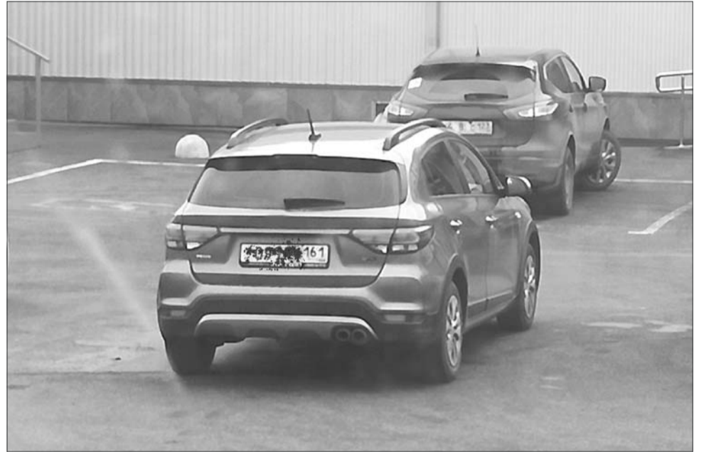
Грязный госномер может быть признан нечитаемым, за что водителя ждет штраф.

В той же статье 12.2 КоАП РФ указано предусмотренное наказание за халатное отношение водителя к госномерам. Так, если автомобиль двигался в условиях плохой погоды, а водитель не знал, что номер испачкан, инспектор вынесет предупреждение или минимальный штраф в 500 рублей. Однако, если номер полностью или частично был замазан намеренно