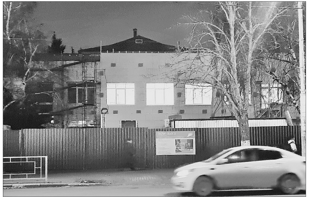
Сейчас в здании проводятся отделочные работы.

Изначально модернизировать здание на улице Советская, 193 «А» должны были до 2 декабря 2024 года, но подрядчик не успел выполнить все работы. 10 декабря администрация Шахт обозначила новый срок сдачи объекта — до конца 2024 года. На тот момент общая строительствость была более 65%. Бригады рабочих усилили, они работали в две смены и по выходным. Предстояло сделать 35% работ за три недели. Уложиться в указанные временные рамки они не смогли. Работы на данном объекте шли с задержкой с начала реконструкции. За первые четыре месяца (из запланированных пяти) было сделано лишь 25%. Такой низкий процент объясняли тем, что здание старое, изношенное. Подрядчику пришлось делать дополнительные работы. Также на сроки повлияла трагедия — в сентябре на объекте рабочего насмерть придавило бетонной плитой. На несколько недель стройка была приостановлена. Но даже при низких процентах выполнения администрация настаивала на том, что «Импульс» сдадут в срок.