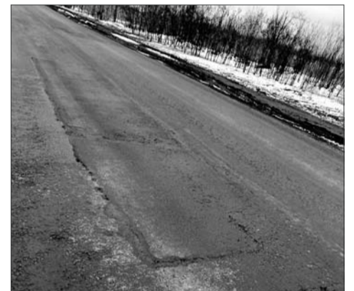
Дефекты на отремонтированных дорогах видны невооружённым глазом.

Напомним, в переулке Капустина дорогу делали от ул.8 Марта до ул.Административная и по маршруту автобуса № 23 (ул.8 Марта — ул.Колесникова). На это ушло 33,5 миллиона. Работы выполняла ростовская фирма «ДРСУ (Дорожно-ремонтное строительное управление)». Общая протяжённость сделанной дороги составила два с лишним километра. Ещё один капремонт завершился на ули-