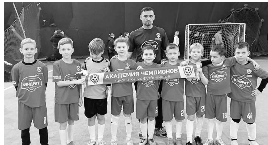
Ребята 2016 г.р выиграли со счетом 13:0.

Однако обе шахтинские команды по итогам 7 и 6 проведенных матчей заняли места в первой тройке турнирной таблицы.