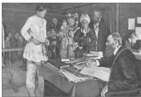
«Семейное дело у мирового судьи». Константин Маковский, 1885 год.