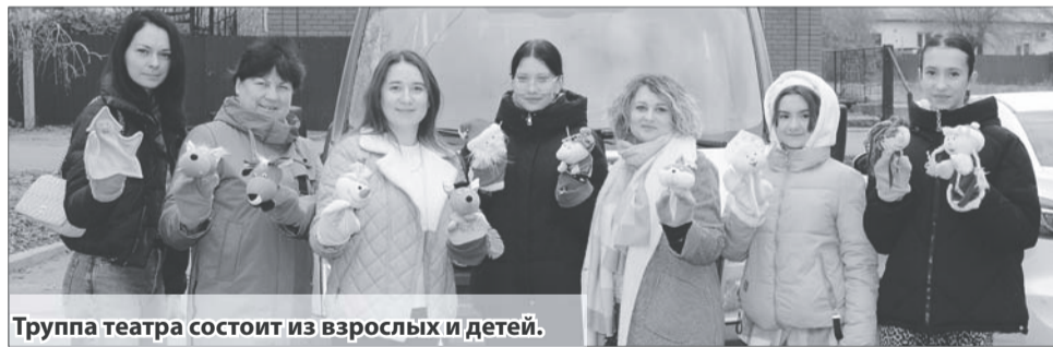
Труппа театра состоит из взрослых и детей.

Театр, где главные герои — куклы, безусловно, особый жанр. Спектакли делаются для детей. Взрослые смотрят их редко. Поэтому большая часть постановок — это старые добрые русские сказки. «Теремок», «По щучьему велению», «Пасхальный колобок», «Как заяц Новый год ждал», «Сказка про бабу, про деду, да про бравого солдата Кондрата» и так далее. Это вам не какие-нибудь новомодные зарубежные мультики, типа «Школы монстров», «Тачек» и «Миньонов!» Это все делается в рамках нашего русского менталитета.