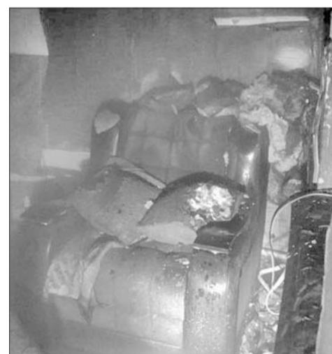
Огонь быстро перекинулся на легковоспламеняющуюся мебель.

Еще один пожар произошел ночью 14 января. Сгорел дом на улице Зорге. Хозяйка использовала строение как дачу, изредка приезжая. В момент возгорания дома никого не было. Соседи увидели дым и сразу вызвали спасателей. К моменту прибытия огнеборцев огонь распространился на площади 15 квадратных метров.