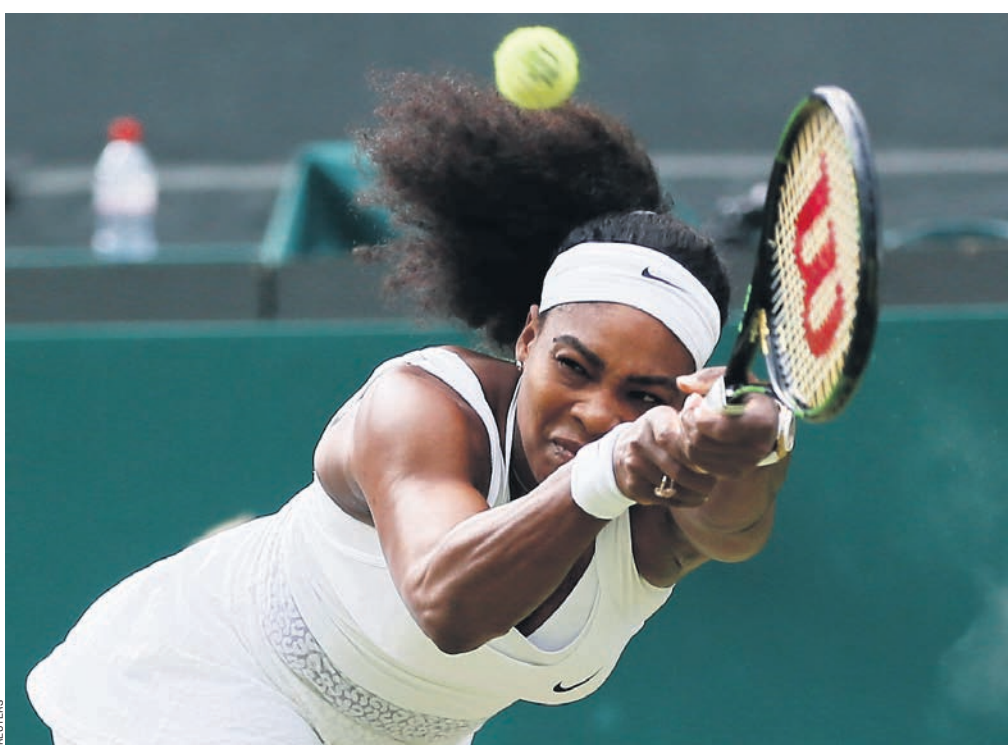
В матче против Виктории Азаренко Серена Уильямс (на фото) вновь доказала, что если она действительно хочет победить, то остановить ее практически невозможно

Если судить только по словам Шараповой, то все у нее вчера было легко и просто. На деле же Вандевей свои шансы получала. И даже чуть не отыгралась после провального, с тремя подрядами проигранными геймами, начала решающей партии. Сумей американка сравнять счет, далеко не факт, что на кураже она не смогла бы пойти дальше. Будем надеяться, что к полуфиналу Марии Шараповой удастся избавиться от таких перепадов в игре, потому как в противном слу-