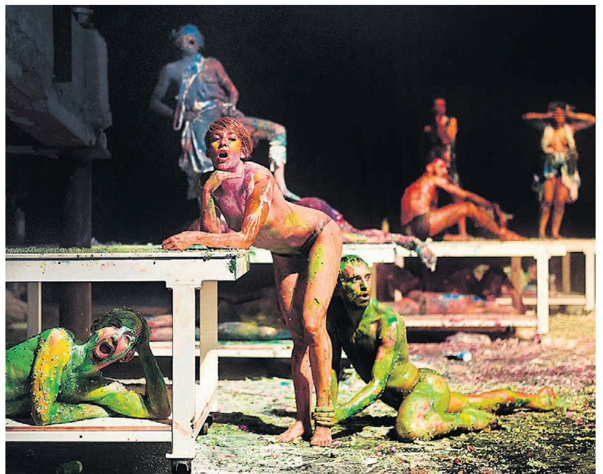
«Гора Олимп» Яна Фабра вбирает в себя не только все стили и жанры, но и весь кровавый человеческий опыт

Собственно, форма этого спектакля — уже часть его содержания, доказывающая, что нет разницы между нами и теми, кто жил в античности. Древние греки играли свои спектакли от рассвета до заката, во время действия можно было есть, пить, разговаривать и выходить по нужде. Фабр предлагает публике то же, но растягивает представление на сутки, так хитро его выстраивая, что главная проблема зрителя — заставить себя покинуть зал. Происходящее напоминает один сплошной фокус или метаморфозу. Общие вакхические танцы (зажигательный твэрк), скандирование слоганов («fuck me! take me!» — кричат люди богам), переодевание, вернее, преобразование (с помощью красок и тряпок) себя в существо другого пола, надрывный плач, когда актеры вытаскивают из-за пазухи куски мяса и бьют ими себя в грудь, — все доводит до изнеможения, но едва ты хочешь уйти, как замечаешь, что затянутый эпилог становится прологом к новой сцене, трагическое превращается в смешное, и наоборот. Так, женский хор, изображающий оргазм (под хохот муж-