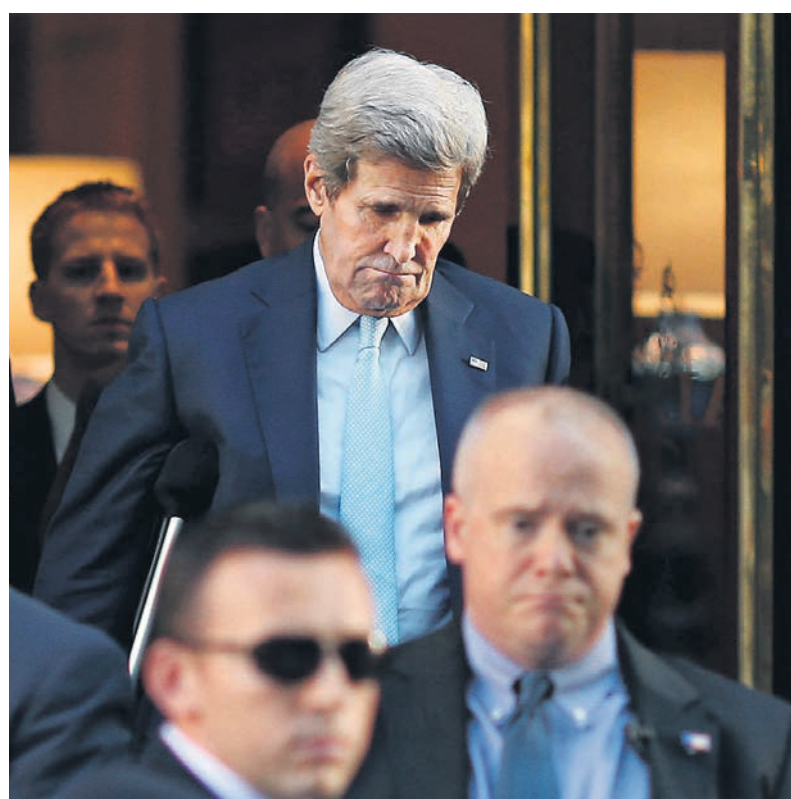
Госсекретарю США Джону Керри пришлось задержаться в Вене. Он надеется, что всего на несколько дней.

Говоря о нерешенных вопросах, Сергей Лавров выделил пункт о снятии с Ирана оружейного эмбарго. «Это важная вещь, потому что сегодня на первый план — и это все признают — выходит задача объедине-