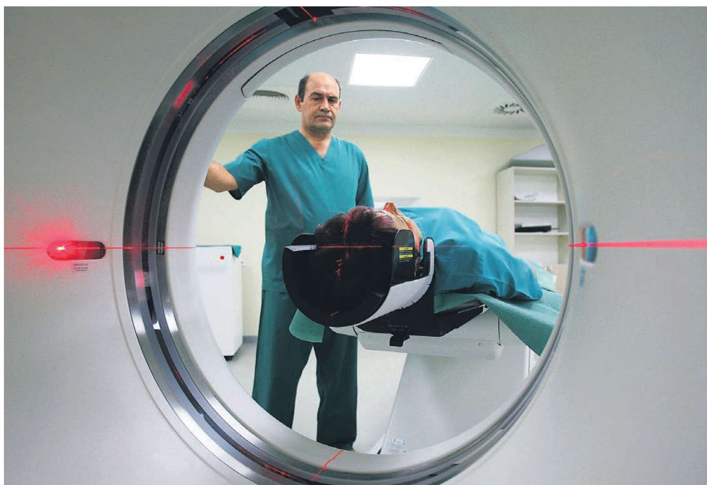
Как выяснил Росздравнадзор, томографы в российских больницах ощущают острую нехватку пациентов

Новые данные Росздравнадзора показывают: закупленное оборудование теперь используется никак не на полную мощность. Наибольший объем проведенных в российских больницах исследований приходится на аппараты УЗИ — по итогам года объем исследований на один такой комплекс составил 4,5 тыс. исследований (12 в сутки). На один компьютерный томограф в 2014 году пришлось 3,9 тыс. исследований (11 в сутки). Аналогичные показатели для МРТ — 3,2 тыс. исследований в год (девять в сутки). На один