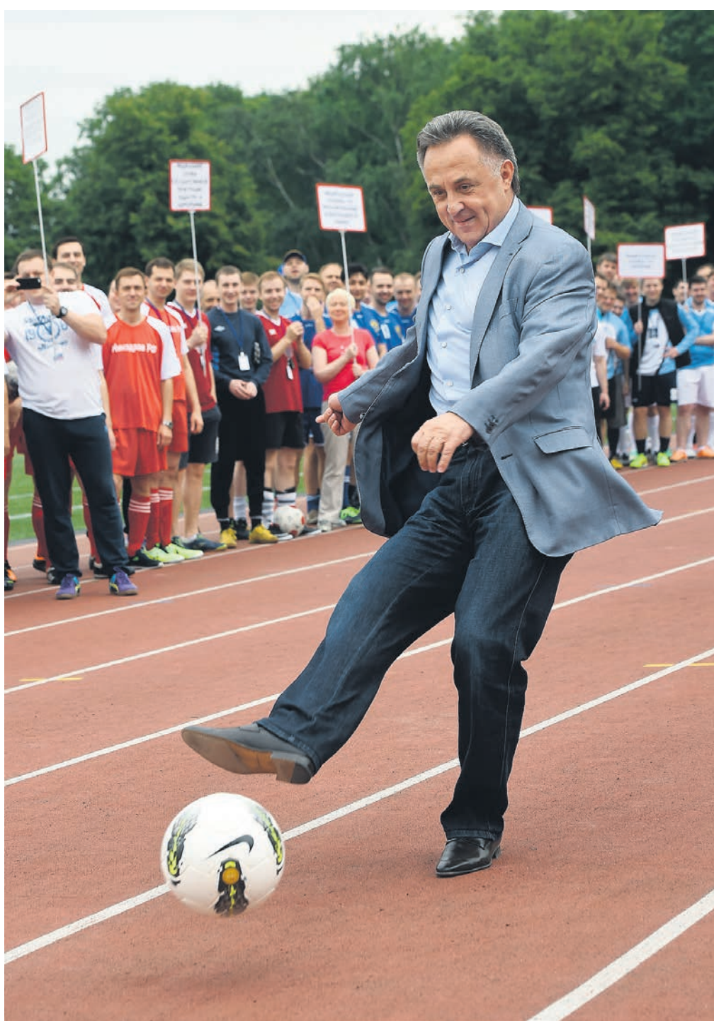
Региональные федерации снова хотят видеть Виталия Мутко президентом РФС

Виталий Мутко уже был главой РФС в 2005–2009 годах. А расстался он с этим постом, сосредоточившись на работе в Минспорта, после того как занимавший должность президента РФ Дмитрий Медведев издал распоряжение о запрете госчиновникам возглавлять спортивные федерации.