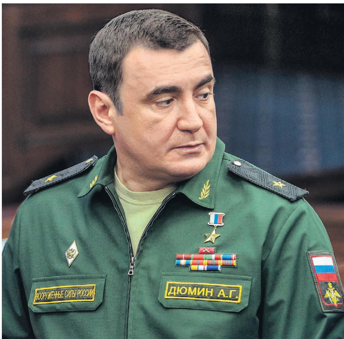
Алексей Дюмин оставил пост в Министерстве обороны, но пока остается военным

Об отставке и назначении врио главы Тульской области Владимир Путин объявил на встрече с Владимиром Груздевым и Алексеем Дюминым. Господин Дюмин признался „Ъ“, что предложение возглавить Тульскую область поступило ему только вчера и стало для него