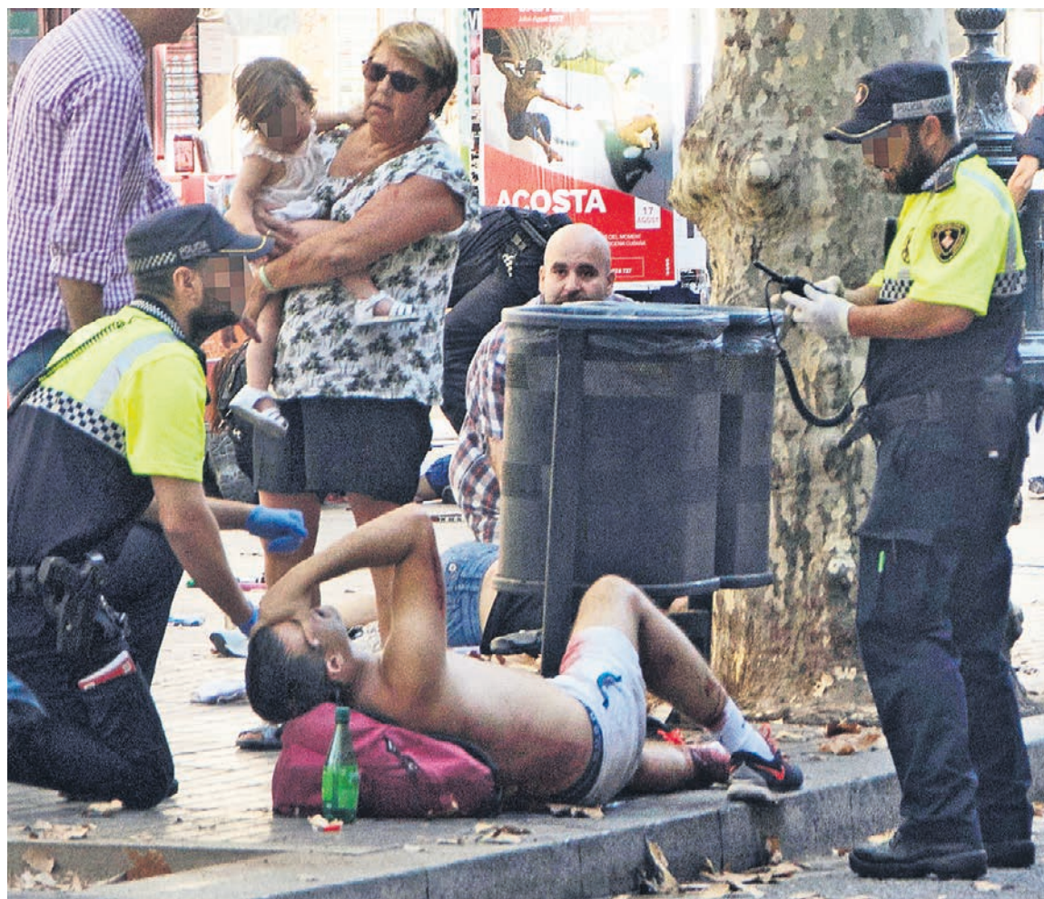
Теракт на бульваре Лас-Рамблас был направлен не только на местных жителей, но и на туристов, которых в это время года в Барселоне особенно много. ФОТО EPA/VOSTOCK-PHOTO

Список произошедших в Европе в последние месяцы терактов с использованием автомобилей пополнился вчера еще одним: на пешеходной улице Лас-Рамблас в центре Барселоны в толпу врезался грузовой автомобиль. По данным каталонских властей на вчерашний вечер, погибли 12 человек, более 80 — были госпитализированы. Ответственность за теракт взяла на себя группировка «Исламское государство». Испанские СМИ сообщили: американские спецслужбы еще за два месяца предупредили каталонских силовиков о возможной атаке террористов, причем именно на Лас-Рамблас. Впрочем, как показывает практика, защититься от подобных атак практически невозможно. Представители российского турбизнеса ожидают, что в краткосрочной перспективе «динамика бронирований туров, скорее всего, замедлится», хотя массовых отмен поездов не будет.