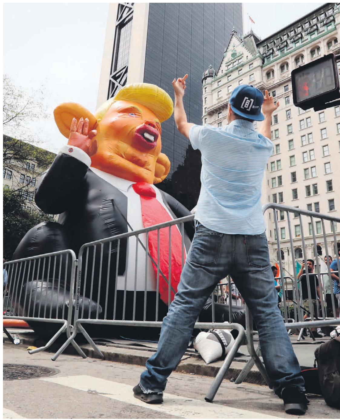
Ответы Дональда Трампа, не пожелавшего открыто атаковать ультраправых, вызвали резко негативную реакцию как у бизнеса, так и у членов Республиканской партии.

Среди объявивших о своем нежелании работать с главой Белого дома также оказались гендиректор Intel Брайан Кражич, глава транснационального фармацевтического гиганта Merck Кеннет Фрейзер,