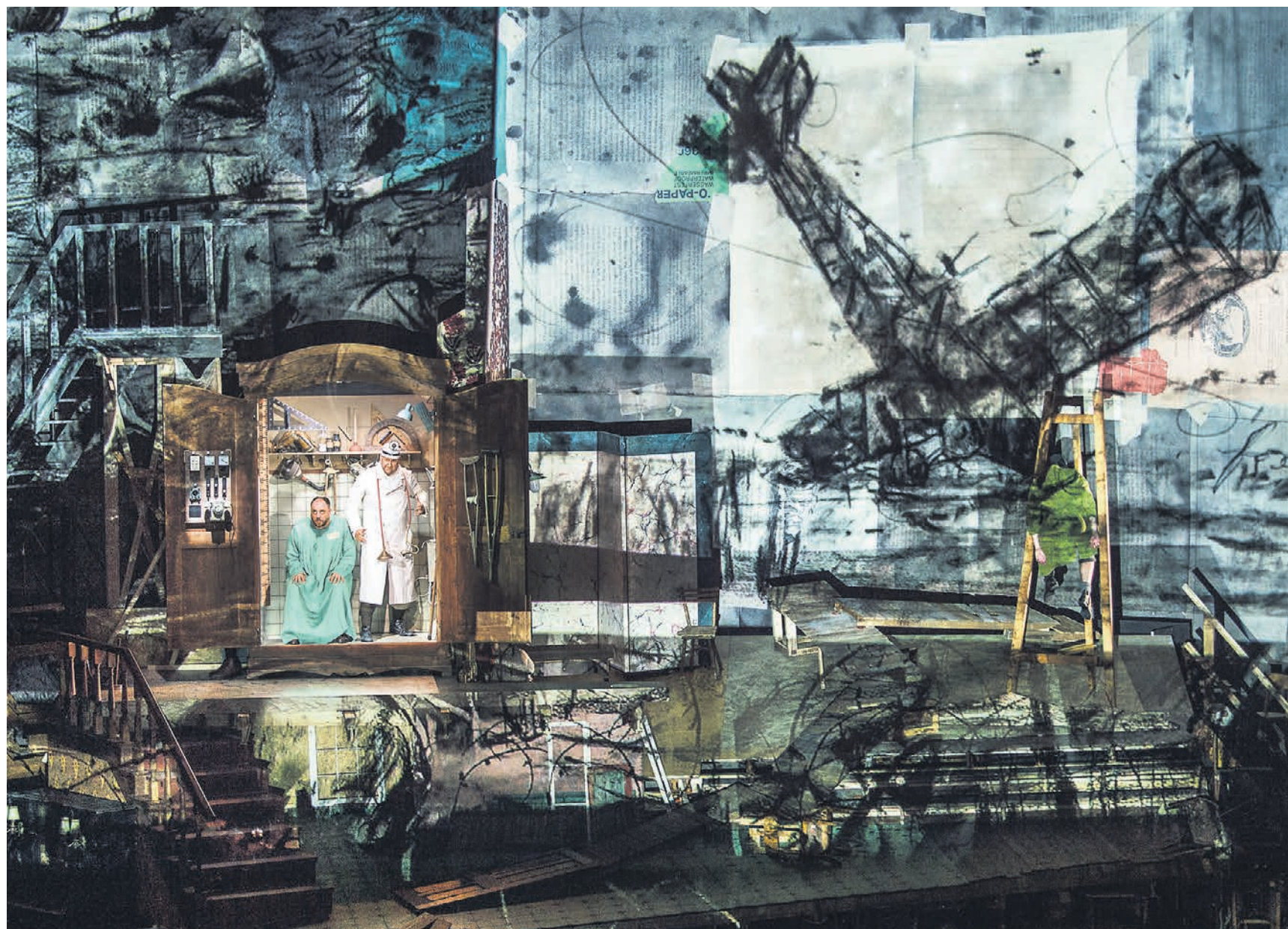
Коробка сцены, словно нутро дырявого чемодана, оклеена ветхими картами, газетами и таблицами, но этого почти не видно — сцену буквально заливают виртуозно сделанные проекции

Но весь вопрос в том, как эти ассоциации проявить. У Кентриджа (вместе с ним над спектаклем работали сценограф Сабина Тейнниссен и видеохудожник Кэтрин Мейбург) на сцене громоздятся аморфная конструкция, больше всего напоминающая руины разбомбленного дома. Груды досок, мебельный хлам, мостики, чудом уцелевший громадный шкаф — в нем разместится потом «кабинет» Доктора, из него же появятся кабацкие музыканты. Коробка сцены, словно нутро дырявого чемодана беженца, оклеена какими-то ветхими картами, газетами и таблицами, но этого почти не видно, потому что сцену буквально