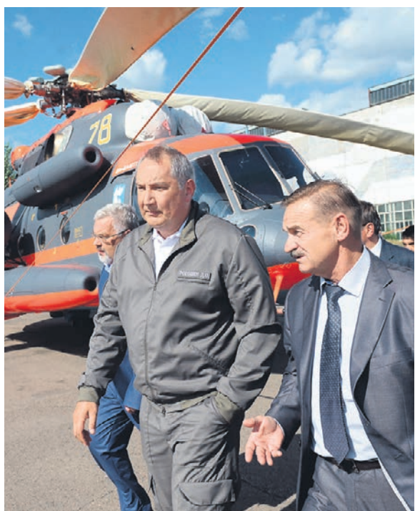
Дмитрий Рогозин (в центре) визитом в Бурятию поддержал авиационную промышленность и врио главы республики Алексея Цыденова

Открывая совещание, вице-премьер уточнил, что МС-21 впервые поднимется на высоту 11 км в сентябре, а всего самолет поднимется в воздух более 20 раз (по состоянию на вчера первый облет совершил девять вылетов). Впоследствии самолет будет перебазирован на летные испытания в подмосковный Жуковский. Юрий Слюсарь, в свою очередь, подчеркнул, что цель программы заключается в выводе на производство 70 машин к 2024 году, а Олег Демченко заявил, что «и мощности, и площади позволяют нам выйти на эти объемы». По данным «Б», в закрытой части совещания обсуждались преимущественно финансовые аспекты программы МС-21, поскольку счи-