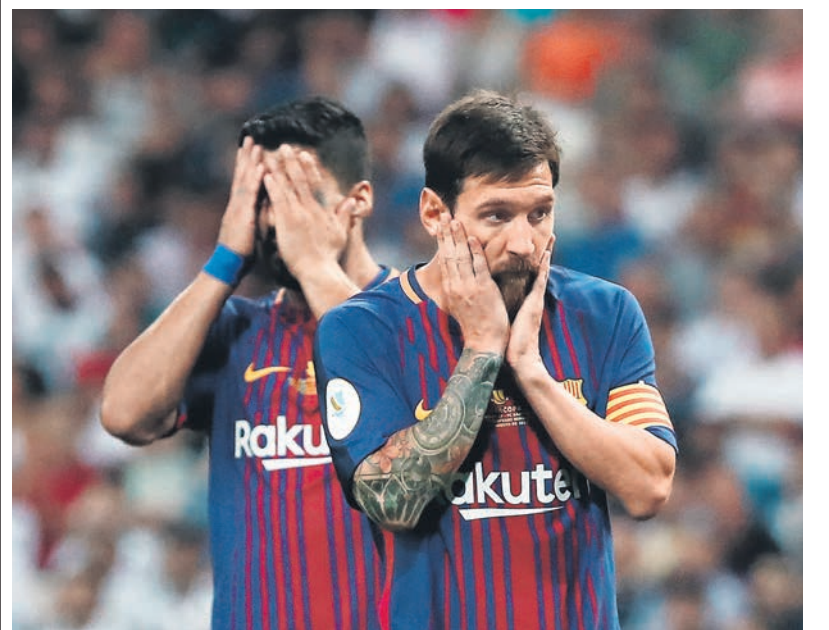
Для лидеров «Барселоны» Лионеля Месси (справа) и Луиса Суареса, оставшихся без своего постоянного партнера Неймара, новый сезон начался крайне неудачно.