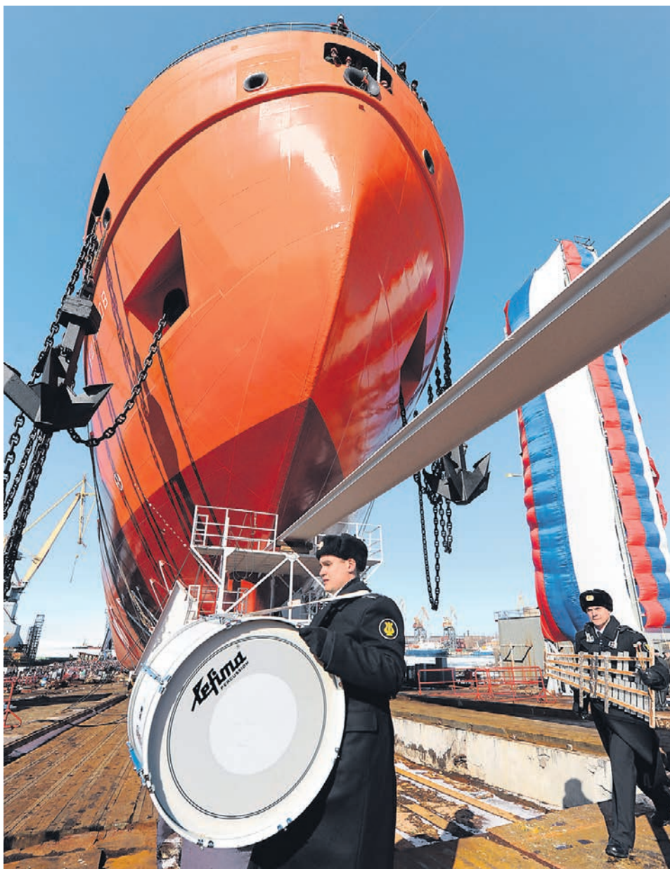
Спущенный на воду с большой помпой в 2011 году «Академик Трешников» (на фото) до сих пор остается единственным новым судном научно-исследовательского флота России.

Средний возраст НИС ФАНО (13 судов неограниченного района плавания) также со-