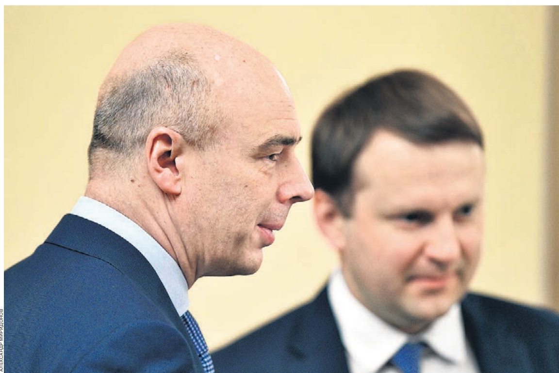
Глава Минфина и Минэкономки Антону Силуанову и Максиму Орешкину как бывшим сослуживцам предложено самим переделить полномочия их ведомств в госзакупках

Контроль госзакупок может перейти от Минэкономки к Минфину и Федеральному казначейству — дискуссия об этом инициирована первым вице-премьером Игорем Шуваловым 9 февраля на последнем совещании по теме, подтвердили „Ъ“ источники в Белом доме. Поручение господина Шувалова пока сформулировано на уровне концепции — конкретные предложения предстоит представить Минэкономки (оно предложит перевести закупки и конкуренцию на проектное управление) и Минфину. Консолидация контроля закупок в финансирующем их ведомстве объясняется проблемами при их информатизации — системы контроля закупок, оборота лекарств и электронный бюджет должны сопрягаться, но до сих пор это вызывало только проблемы с их работой. На этом фоне «Ростех», уже выбравший разработчиком двух информационных систем, может получить контроль и над электронным бюджетом.