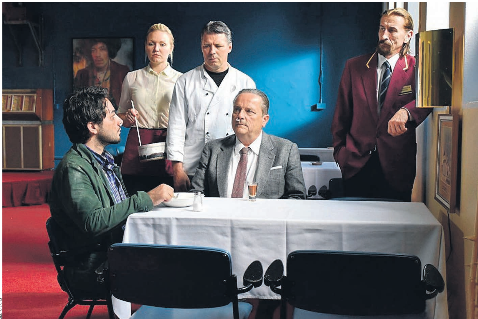
Убогий ресторан на окраине Хельсинки оказывается в фильме Аки Каурисмяки островком гуманизма