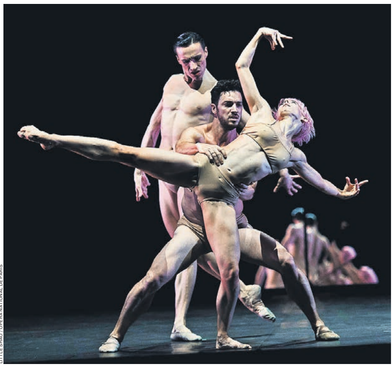
Уэйн Макгрегор заставляет артистов двигаться по сложнейшим пространственным алгоритмам

Jamie xx, он же Джейми Смит, — участник the xx, одной из важнейших инди-поп-групп десятилетия, а также диджей и кумир тусовочного Лондона — замешал все самое актуальное, что есть в сегодняшней электронной музыке; сет этот можно ставить и на вечеринке, пойдет на ура. Олафур Элиассон, кассовый современный художник, визионер, которому в его инсталляциях ничего не стоит управлять стихиями и пускать тела вспять, здесь разыграл в сценографии испытанную сильную карту — зеркальные отражения. С их помощью он меняет объемы и цвета, начиная спектакль полной темнотой и завершая взрывом красок. Его зеркала трансформируют тела и множат конечности, которые то распускаются цветком, то складываются гранями алмаза. Зрелищно очень, но нельзя не заметить, что все это хореограф-американец Мозес Пендлтон продлевал еще в прошлом веке, познакомив со своими волшебными обманками весь мир, включая Россию. Элиассон в собственные сценографические игры втягивает и публику: шарпящие по рядам лучи прожекторов делают из зрителей если не участников действия, то хотя бы живые декорации.