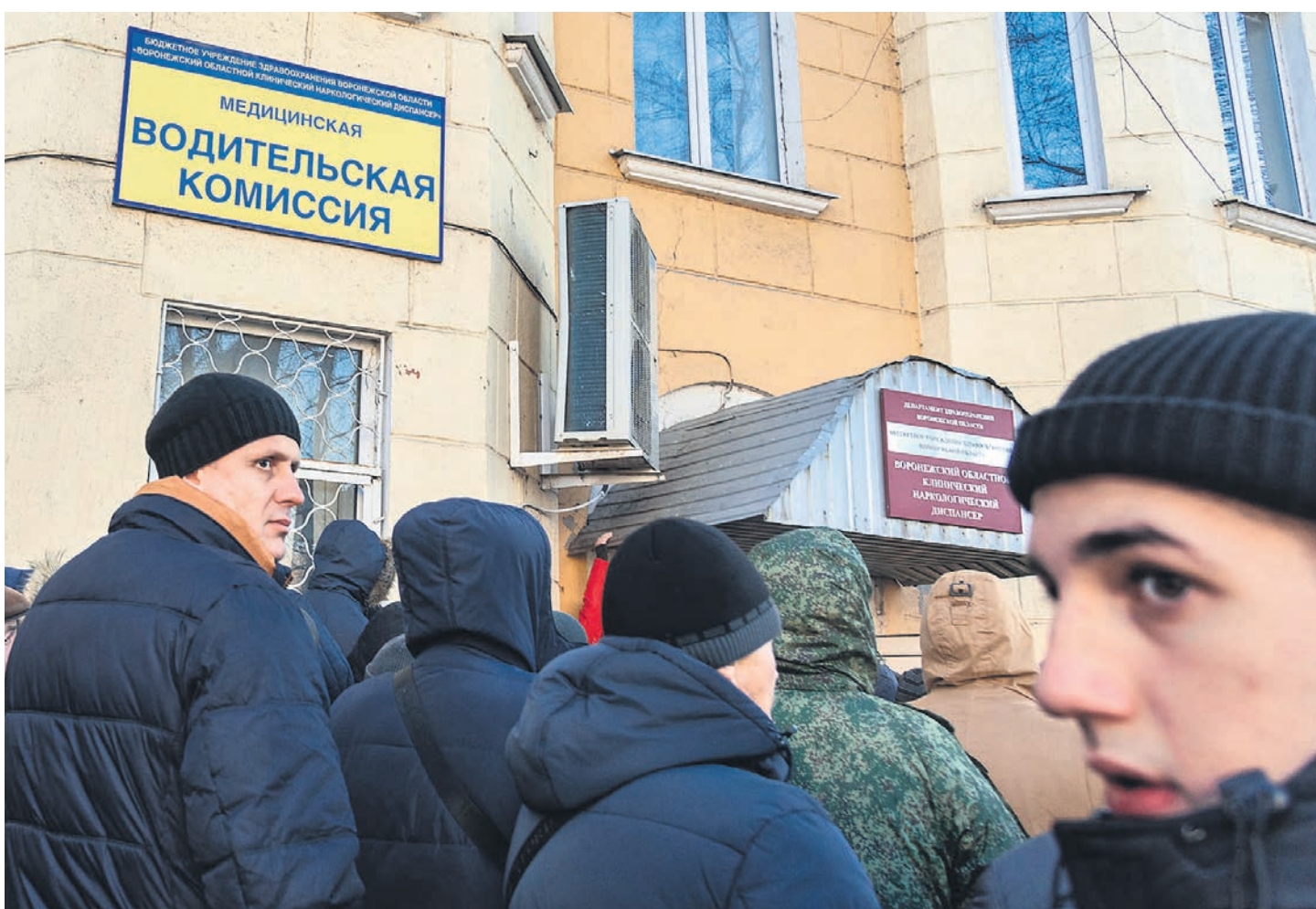
На анализ крови врач может направить любого соискателя прав, у которого обнаружит расстройство поведения

Медосвидетельствование, напомним, необходимо при получении и обмене водительских прав. Минздрав еще в конце 2019 года подготовило поправки к приказу №344Н. Ведомство, как рассказывал „Б“, собиралось ввести новый обязательный тест на хронический алкоголизм (наличие в крови карбогидрат-дефицитного трансферрина — CDT-маркера). Однако накануне вступления в силу правила жестко раскритиковал президент, поскольку новые обязательные тесты могли привести кратному (с 300–500 руб. до 3–5 тыс. руб.) удорожанию медсправок. Минздрав оперативно перенес срок вступления нововведения на 1 июля 2020 года, затем — на 1 января 2021 года, пообещав переписать уже утвержденный документ. В июне была представлена первая редакция поправок, теперь она доработана.