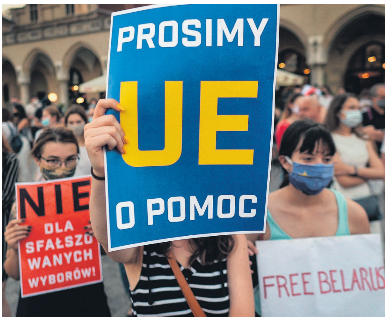
Обращение белорусских оппозиционеров к Брюсселю сработало лишь частично: о признании европейцами Светланы Тихановской победителем президентских выборов речи по-прежнему не идет (на фото: акция протеста белорусов в польском Кракове)

Конфликт между Александром Лукашенко и Светланой Тихановской — политиками, каждый из которых называет себя победителем президентских выборов в Белоруссии, окончательно перешел в международную плоскость. В то время как Александр Лукашенко уже в четвертый раз за пять дней звонил президенту РФ Владимиру Путину, госпожа Тихановская обратилась за поддержкой к лидерам Евросоюза. Те напрямую отвечать не стали, но косвенно выразили поддержку «мирному транзиту власти в Белоруссии» и подтвердили решение ввести персональные санкции против ответственных за фальсификации на выборах и насилие после них. Глава МИД РФ Сергей Лавров также признал, что «выборы прошли неидеально», но возмущение стран Европы назвал геополитикой, не имеющей отношения к правам человека и демократии.