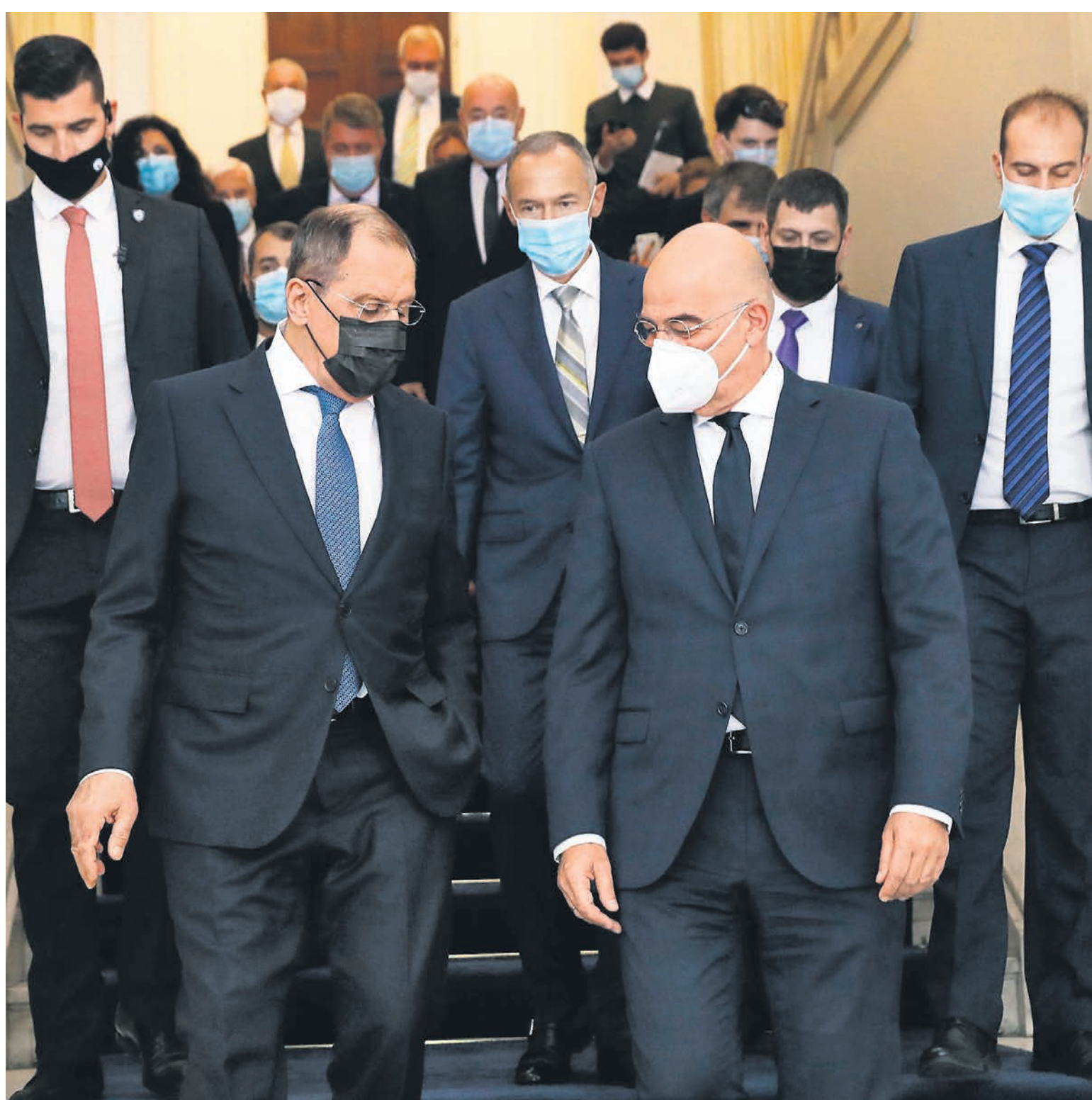
Министр иностранных дел Греции Никос Дендиас (справа на переднем плане) так и не смог добиться от Сергея Лаврова жесткой публичной критики действий Турции.

Греки тоже всячески старались подчеркнуть, что рады гостю. Накануне приезда российской делегации Никос Дендиас выразил надежду, что визит Сергея Лаврова позволит перезапустить двусторон-