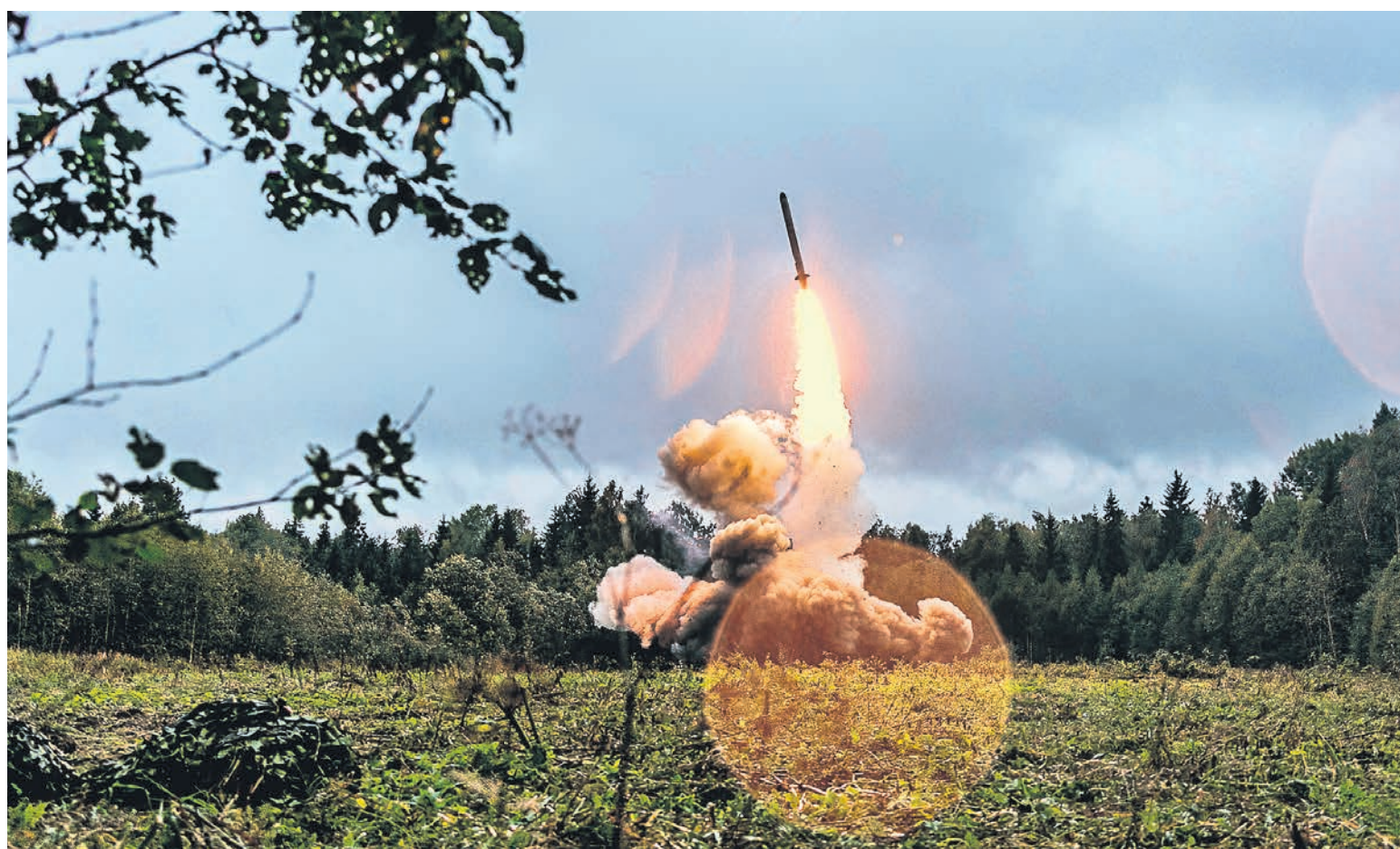
В Кремле считают выход США из Договора о РСМД «серьезной ошибкой, которая усиливает риски развязывания гонки ракетных вооружений» — и поэтому готовы обсуждать с Западом новые правила игры с крылатыми «Искандерами»

В этой связи Владимир Путин выступил с рядом предложений. Во-первых, он повторил то, что уже предлагал в сентябре 2019 года, вскоре после того, как по инициативе США ДРСМД ушел в прошлое. «Мы подтверждаем приверженность ранее объявленному Россией мораторию на разворачивание (в европейской части. — „Ъ“) РСМД наземного базирования, пока в соответствующих регионах не появятся ракетные вооружения аналогичных классов американского производства. Мы также считаем, что не утратил актуальность наш призыв к странам НАТО рассмотреть возможность объявления встречного моратория (на разме-