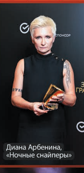
Диана Арбенина, «Ночные снайперы»