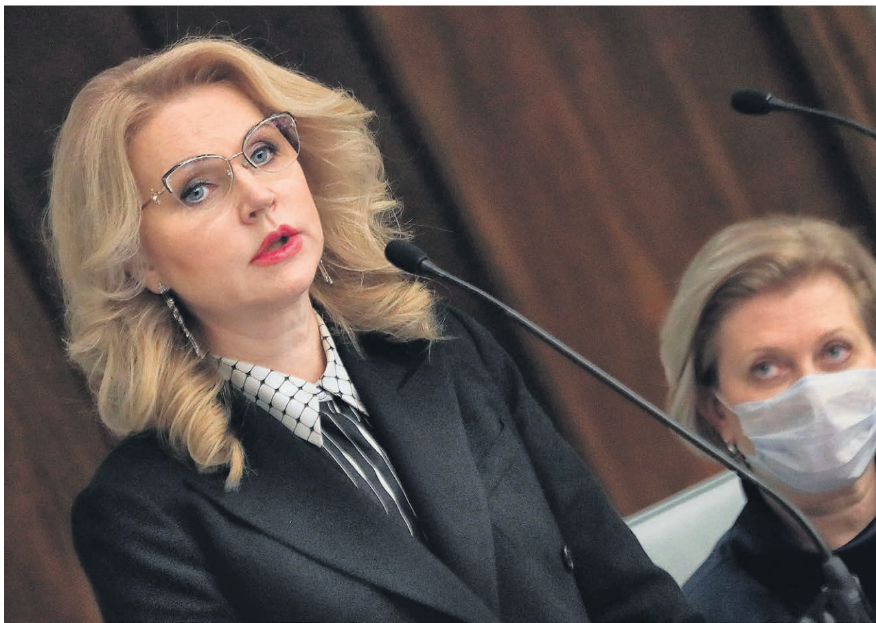
Вице-премьер Татьяна Голикова провела законопроект о ковидных сертификатах через первое чтение

Госдума в четверг одобрила в первом чтении правительственный проект поправок к закону «О санитарно-эпидемиологическом благополучии населения», регламентирующий введение в регионах сертификатов иммунного статуса граждан, вакцинированных от ковида, перенесших его либо имеющих медотвод от прививки. Наличие сертификата, содержащего QR-код, может быть условием для посещения ряда общественных мест. Еще до начала обсуждения произошло бурное выяснение отношений с элементами потасовки между коммунистами, развернувшими баннер «КПРФ против QR-фашизма», и единороссами. Несмотря на ожесточенные споры, законопроект в итоге был принят в первом чтении силами «Единой России», ЛДПР и части «Новых людей». КПРФ и «Справедливая Россия — За правду» (СРЗП) голосовали против.