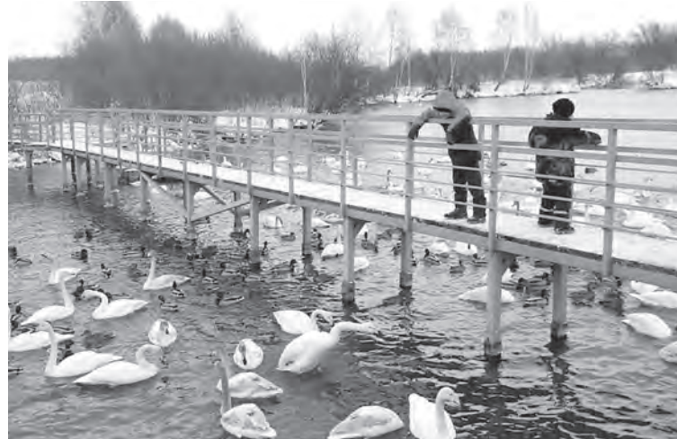
Озеро Светлое находится в Советском районе Алтайского края.