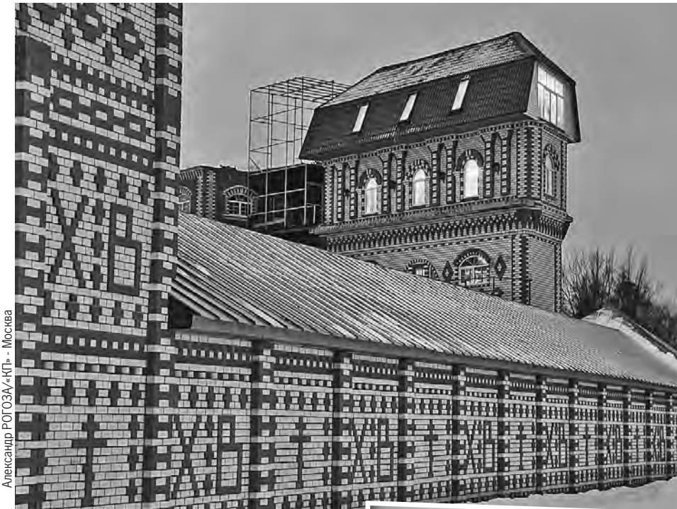
Так выглядит отстроенный в 90-х монастырь в деревне Острово.

- Они появились здесь в конце 90-х, - рассказывает местный житель. - Купили кусок бывшей колхозной земли. Сначала построили храм и несколько зданий вокруг. Своей церкви в деревне не было, поэтому некоторые женщины потянулись на службы. Моя мать однажды сходила. Возвращается: «Ребята, это не наши...» Уже через год вокруг церкви был построен забор, и с тех пор они живут обособленно. Службы у них идут - колокола вроде есть, но они всегда транслируют в колонки записанный колокольный звон. В праздники сюда приезжают вереницы дорогих авто и микроавтобусов - их запускают на территорию и снова закрывают ворота.