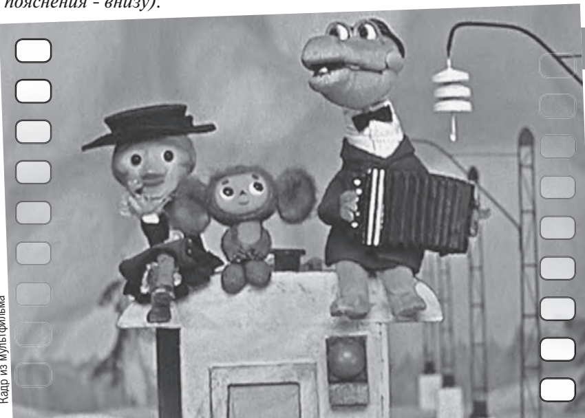
Кадр из мультфильма

Если вы считаете, что знаете все о Чебурашке, крокодиле Гене и старухе Шапокляк, проверьте свои знания с помощью нашей анкеты.