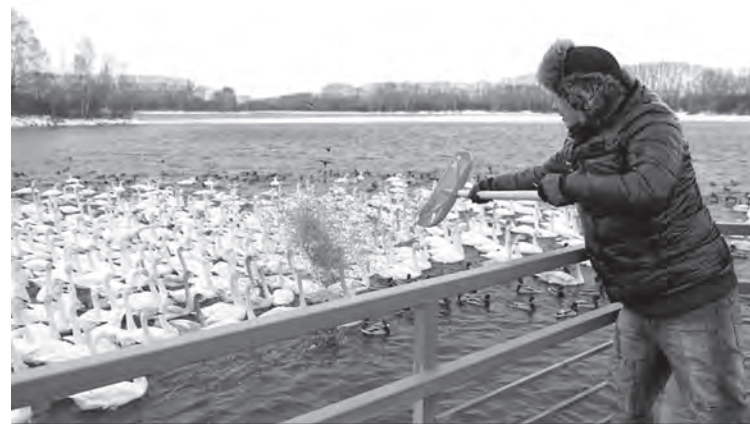
На сезон для пернатых закупают 20 тонн овса.

— На сезон закупаем 20 тонн корма. Я кормлю их каждый день. В морозы даю поболь-