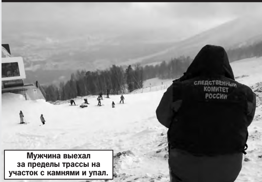
Мужчина выехал за пределы трассы на участок с камнями и упал.