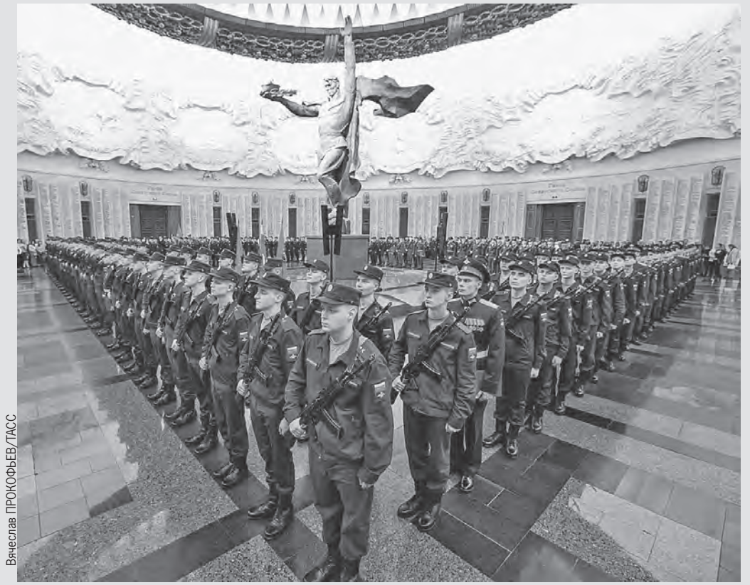
Москва, Музей Победы на Поклонной горе. Зал Славы.

Около 130 новобранцев 154-го отдельного комендантского Преображенского полка