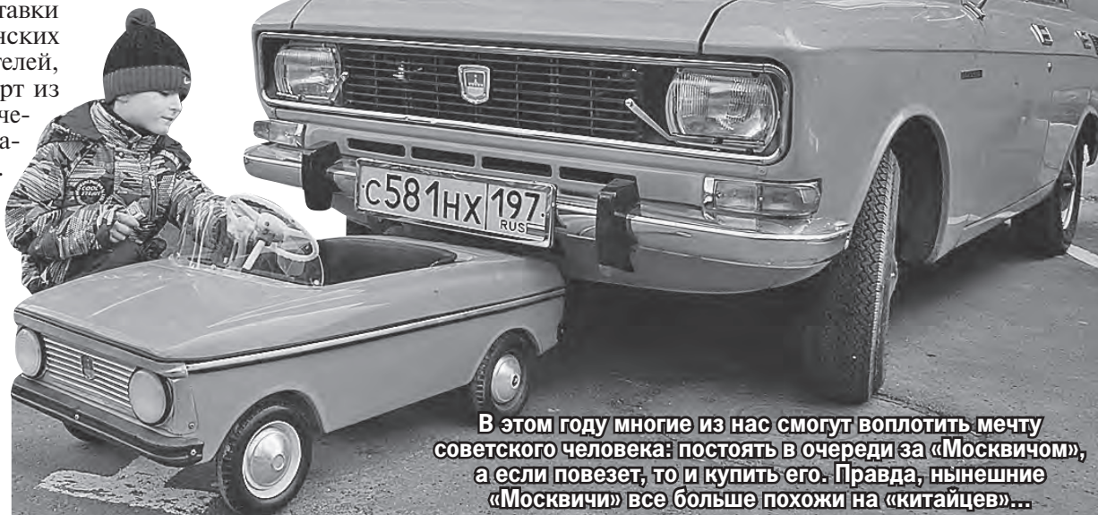
В этом году многие из нас смогут воплотить мечту советского человека: постоять в очереди за «Москвичом», а если повезет, то и купить его. Правда, нынешние «Москвичи» все больше похожи на «китайцев»...

Китайским компаниям выгодно поскорее занять ниши, освободившиеся после ухода мировых гигантов. Пример тех, кто это уже сделал,