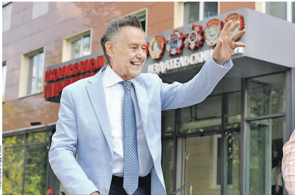
Андрей Дмитриевич готовил большую программу к своему 90-летию 16 июля. Теперь подарком ему будет наша память. На фото - поэт в гостях у «Комсомольской правды» в июле 2013 года.