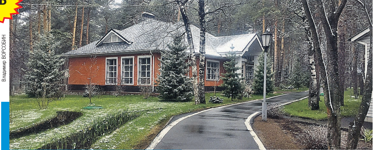
Этот аккуратный одноэтажный дом и есть загородная резиденция Тулеева. На крыльце - инвалидная коляска...

Почему из Кузбасса бегут люди (население области уменьшается на 5 - 10 тысяч человек ежегодно)? Почему у