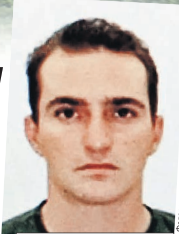
Федеральная полиция Бразилии

К слову, футбол для Родриго, по одной из версий,