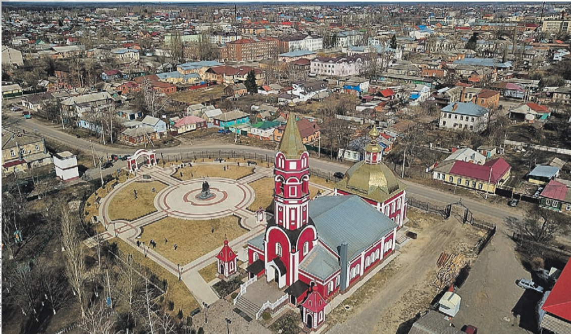
Центр Борисоглебска. Для жителей Балашова этот город в соседней Воронежской области является примером для подражания и предметом тихой зависти...