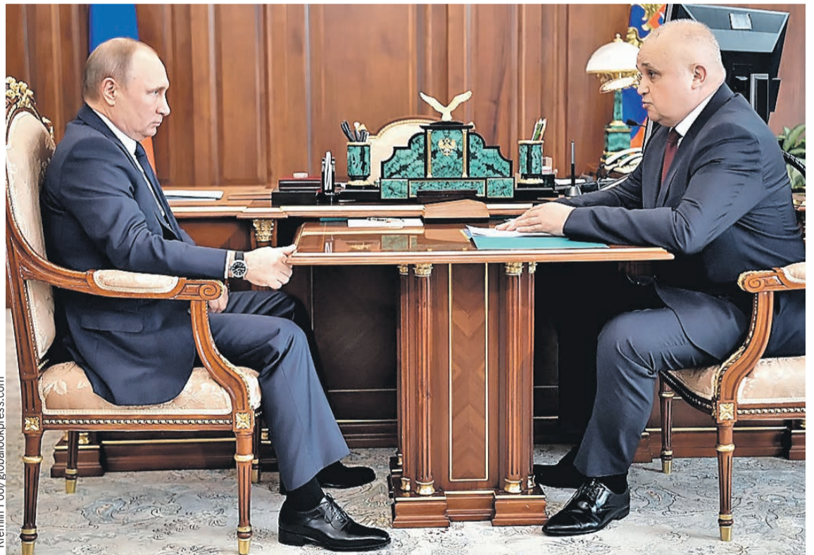
Все просьбы, с которыми пришел к Путину и. о. губернатора Кузбасса Цивилев, президент пообещал решить. «Перечень большой, но и область немаленькая», - сказал глава государства.

чень большой, но и область немаленькая. Что касается школьных автобусов, будем делать... Но нужно, чтобы они ездили по нормальным дорогам, а не разваливались через месяц.