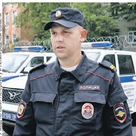
ГУ МВД по Санкт-Петербургу и Ленинградской области

Гости из Перу приехали в Россию поддержать родную команду. А в перерывах между матчами отправились в Северную столицу. Практически целая перуанская диаспора обосновалась в хостеле в Керченском переулке. Но в первую же ночь в гостинице произошло ЧП. По предварительной версии, закоротило проводку. Огонь моментально распространился по старому зданию. Большинство болельщиков продолжали спать. А те, кто почувствовал запах гари, не предупредив остальных постояльцев, побежали на улицу.