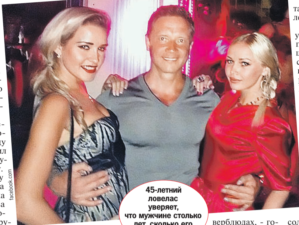
45-летний ловелас уверяет, что мужчине столько лет, сколько его девушкам.

- Никаких иллюзий по поводу того, что меня посадят, я не питал. В один прекрасный день мне повезло: забыли переподписать подписку о невыезде. Я вышел от