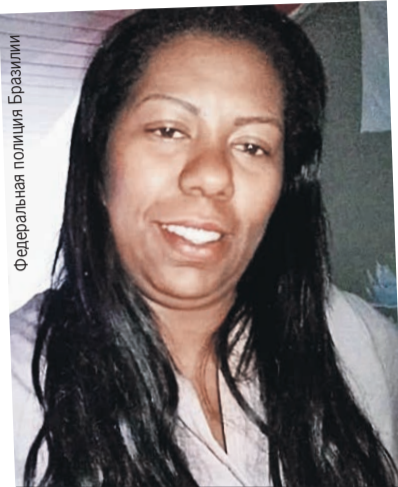
Федеральная полиция Бразилии

Чтобы накрыть банду, бразильские полицейские даже просили помощи у военных. И все равно