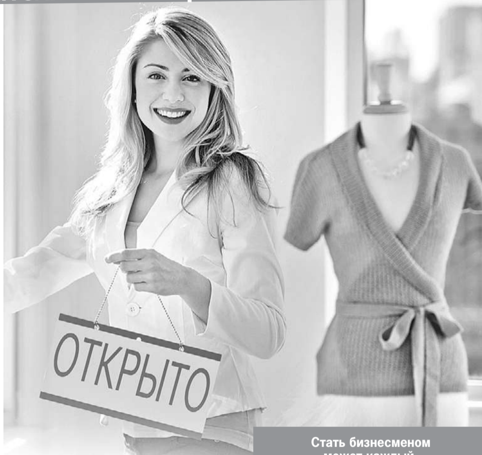
Стать бизнесменом может каждый.

На грант могут рассчитывать ИП или юридические лица (доля должна составлять не менее 50%) от 14 до 25 лет. Возраст - ключевое условие: вид деятельности роли не играет, будь то кафе, барбершоп, сырная лавка или магазин кроссовок. Деловая молодежь может получить от 100 до 500 тысяч рублей. А на создание бизнеса в Арктической зоне - до 1 млн рублей. Обязательными условиями для получения гранта являются софинансирование в размере не менее 25% от стоимости проекта, а также прохождение бесплатного обучения в Центре «Мой бизнес» или АО «Корпорация МСП». Деньги можно направить на аренду и ремонт помещения, приобретение оборудования, оргтехники, ПО, на услуги связи, оплату первых платежей по договорам лизинга и т. д. При этом запрещено использовать средства гранта на закрытие кредита, оплату налогов или покупку автомобиля.