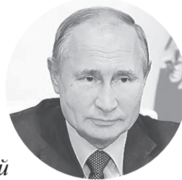
Президент России Владимир ПУТИН.

«Мы веками жили вместе. Вместе победили в самой страшной войне. И будем вместе жить и дальше».