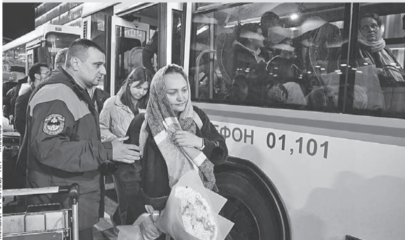
Женщину на фото родственники встретили букетом цветов. Также волонтеры раздавали беженцам пуховики, теплую обувь и все необходимое.

Первый эвакуационный рейс МЧС с россиянами, которым удалось сбежать из сектора Газа, прибыл в Москву.