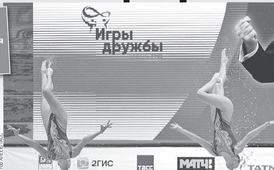
В прошлом году в Казани уже прошли Игры дружбы по водным видам спорта, где приняли участие спортсмены 13 стран.

Президент МОК Томас Бах и его команда называет Игры дружбы политизированными. Кажется, в МОК просто боятся, что Игры дружбы станут реальной и честной альтернати-