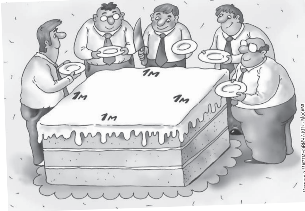
Катерина МАРТИНОВИЧ/«КП» - Москва