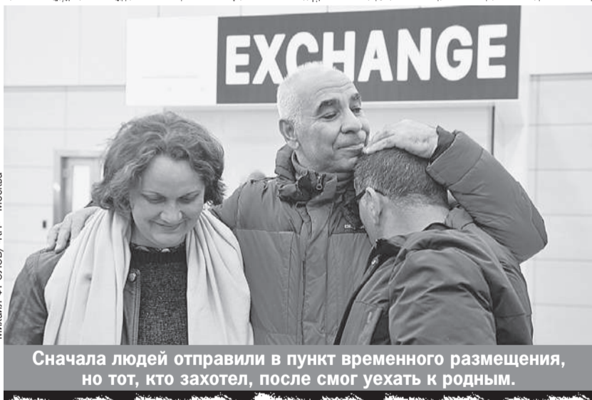
Сначала людей отправили в пункт временного размещения, но тот, кто захотел, после смог уехать к родным.