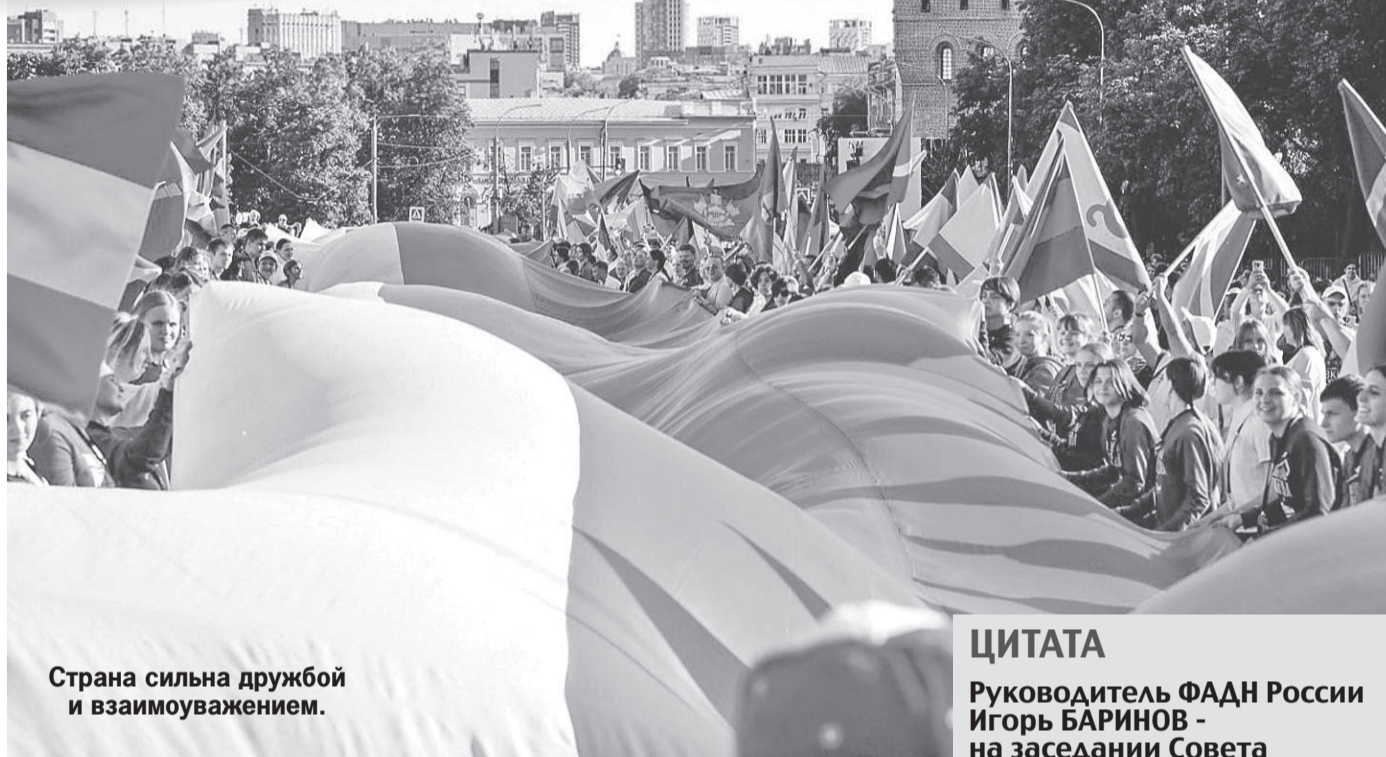
Страна сильна дружбой и взаимоуважением.

Случившееся - лишь ответная мера. 16 марта 2022 года Россию исключили из Совета Европы. В сентябре прошлого года Комитет министров СЕ принял резолюцию, существенно ограничивающую полномочия российского эксперта в Консультативном комитете по мониторингу выполнения обязанностей по защите национальных меньшинств. Кроме того, Россию лишили права отслеживать на международном уровне случаи нарушения прав этнических меньшинств, включая русскоязычное население за рубежом.