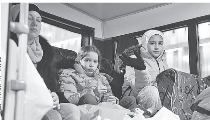
Среди прилетевших в Москву первым рейсом было 28 детей.