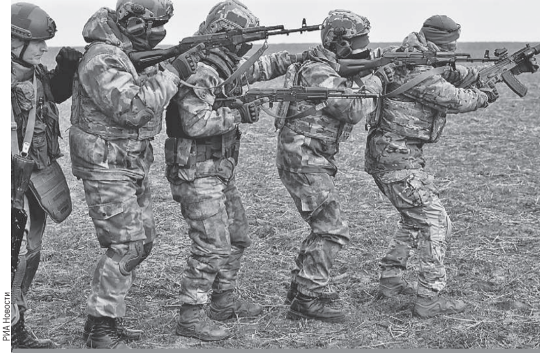
Не важно, опытный ты боец или зеленый новичок, но слаживание на полигоне пройти придется.

Батальон Судоплатова задумывался как подразделение территориальной обороны из жителей Запорожской области. Но получилось иначе - отряд стал одним из самых технически продвинутых добровольческих подразделений. Здесь служат десантники, даже собственная артиллерия.