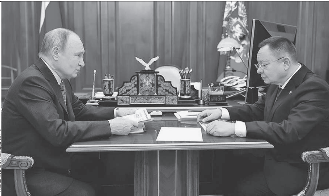
Ирек Файзуллин пообещал поставить рекорд в этом году по сданным квадратным метрам жилья. Судя по темпам строительства, это ему удастся.

✓ Последняя версия программы расселения аварийного жилья рассчитана до 2027 года. В плане стоит 725 тысяч домов. С учетом рекордов по вводу жилья министр пообещал все выполнить в срок. Хотя и оговорился, что