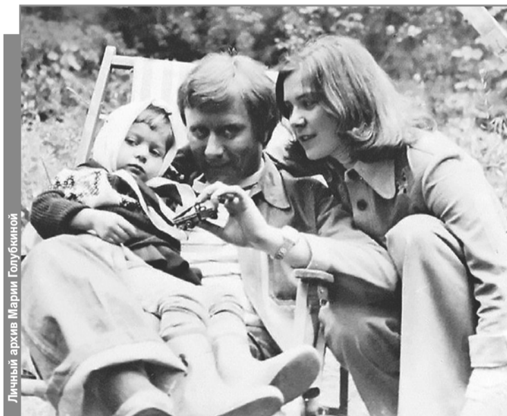
Андрей Миронов, Лариса Голубкина и маленькая Маша. Недавно Мария Голубкина заявила, что актер был ее родным отцом, а не отчимом.

ее, осыпая самыми унижительными словечками.... В общем, возни с Ларисой хватало, но, слава Богу, у нее оказался ровный, необидчивый характер».