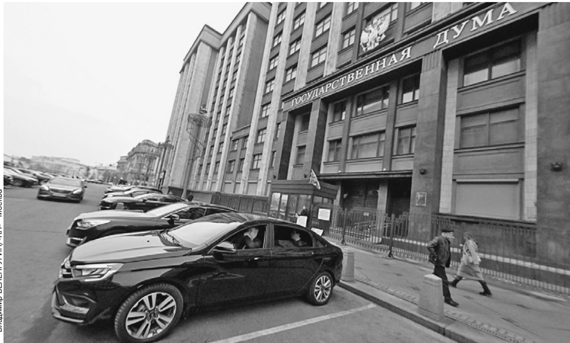
Владимир ВЕЛЕНГУРИН/«КР» - Москва