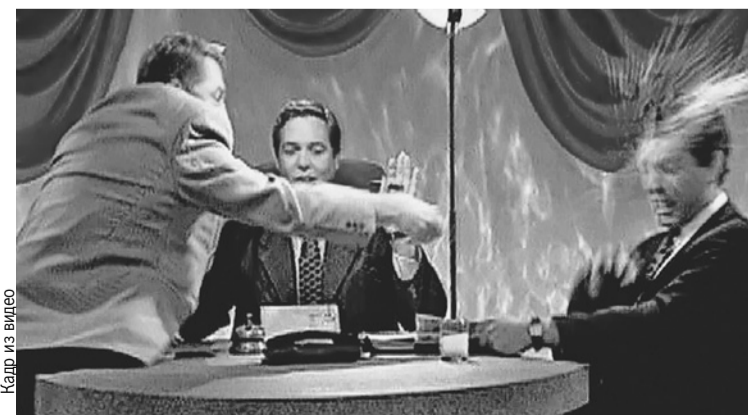
Исторический кадр. Владимир Жириновский в эфире программы Александра Любимова «Один на один» (ОРТ) поливает Бориса Немцова апельсиновым соком. 18 июня 1995 г.

- Эти сюжеты вырваны из контекста. Не показано то, что спровоцировало конфликт. Например, за что отец облил апельсиновым соком Немцова? Только что делегация ЛДПР вернулась из Буденновска, где террористы захватили больницу, в заложниках дети, женщины. И отец рассказывал об этом. А Немцов в тот момент сидел с пошлым журналом и говорил обидные вещи, связанные с половой жизнью. Это было оскорбительно. Отец не выдержал и плеснул в него соком. Когда сюжет показали в парламенте Греции, депутаты встали и аплодировали Жириновскому стоя. По их мнению,