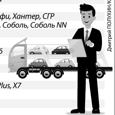
Дмитрий ПОЛУХИН/Комсомольская правда