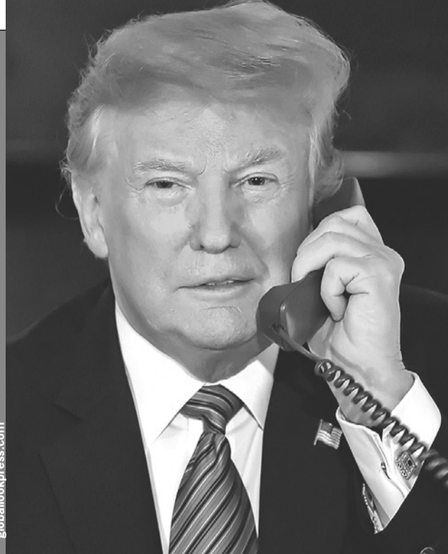
После визита в Москву Стива Уиткоффа его друг и босс, президент США Дональд Трамп, проговорил с коллегой Владимиром Путиным 2,5 часа.