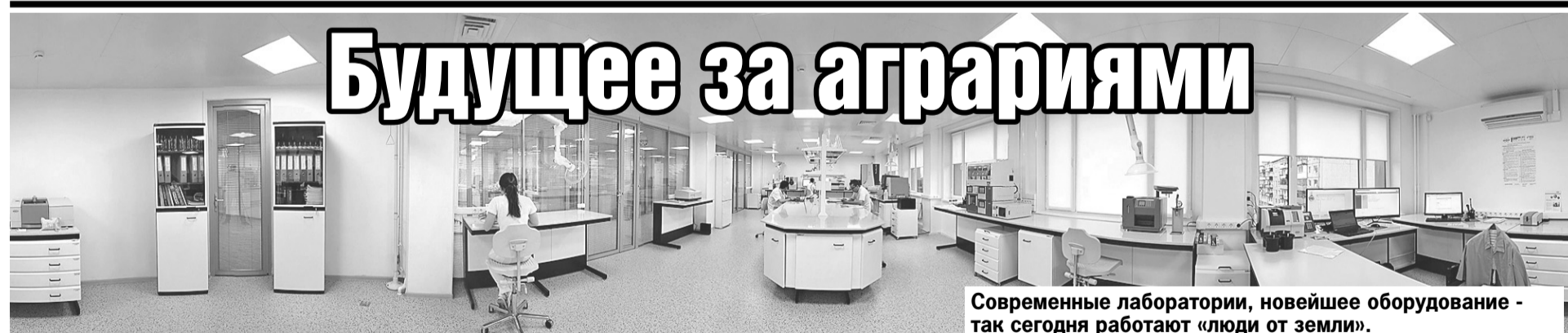
Современные лаборатории, новейшее оборудование - так сегодня работают «люди от земли».