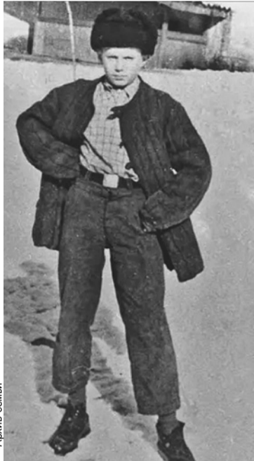
На этом фото Вове Жириновскому - 10 лет. Почему штаны такие короткие? Какие были на барахолке, такие и купили. Алма-Ата, 1957 г.

- Его мама растила шестерых детей одна. Потому папа по-особому отно-