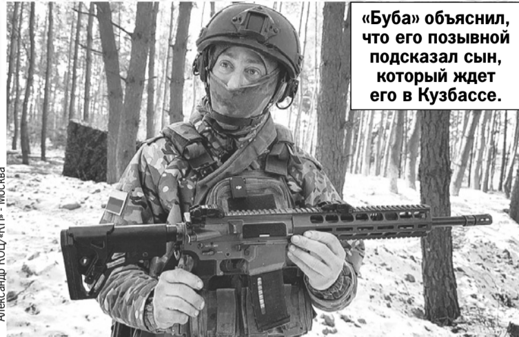
Александр КОЦ/«КП» - Москва

Перед перегонем в тыл на всякий случай сняли пулемет, а на антенну повесили красные штаны и тельняшку - чтобы не попасть под дружественный огонь. Пулемет на него скоро вернут, и машина еще послужит морпехам 810-й бригады.