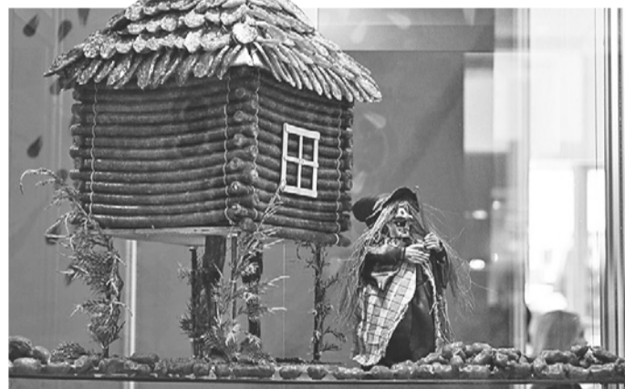
Колбаса - продукт древний и универсальный.

Обыкновенный полуфабрикат в руках умелого повара становится кулинарным шедевром.