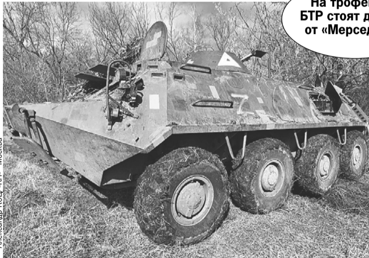
Александр КОЦ/«КП» - Москва

- У противника есть подразделения, которые имеют хорошее снабжение, экипировку, боевой инвентарь, но в стрелковом бою наши на голову выше, - убежден «Быба».