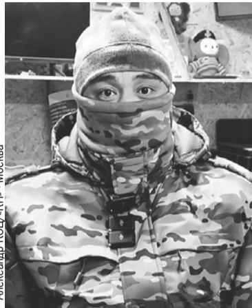
Александр КОЦ/«КП» - Москва

- Всегда страшно. Приходит момент, когда просто нужно это чувство самосо-