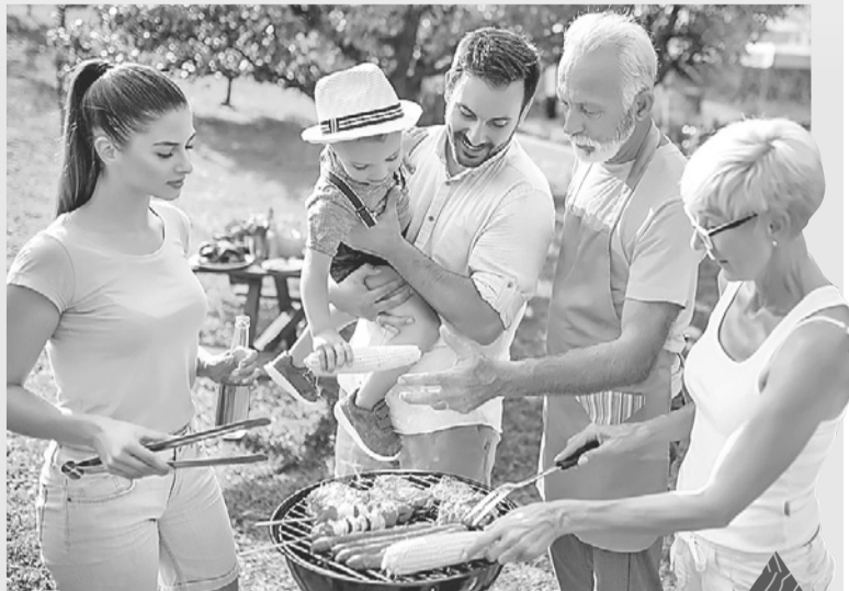
Мясо на природе всегда вкуснее, чем дома. Ученые этот феномен объяснить не могут.