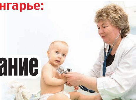
Валерий ЗВОНАРЕВ, «КП» - Челябинск