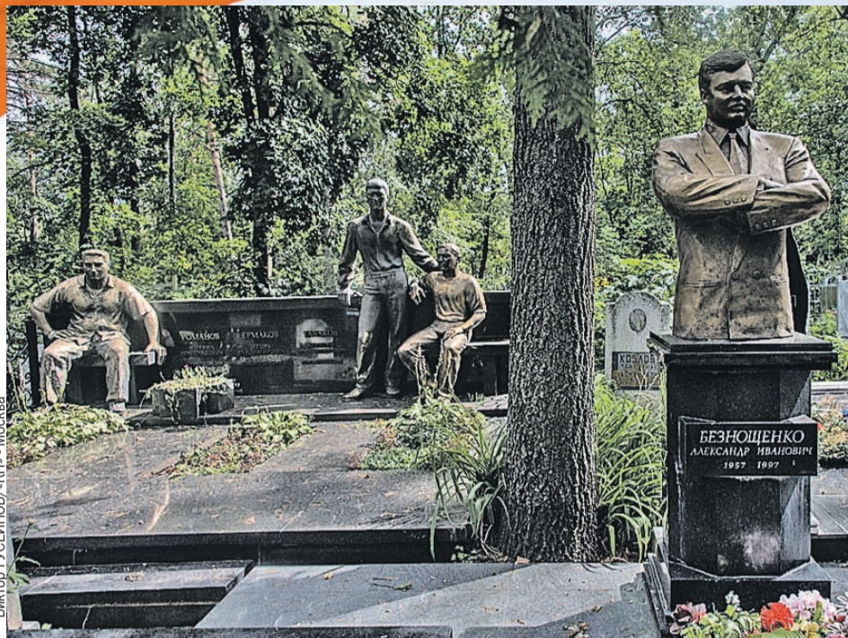
Виктор ГУСЕЙНОВ/«КП» - Москва

Те времена давно прошли. - А раньше-то как было! О-о-о! - рассказывает брат-водномоторник Булат,