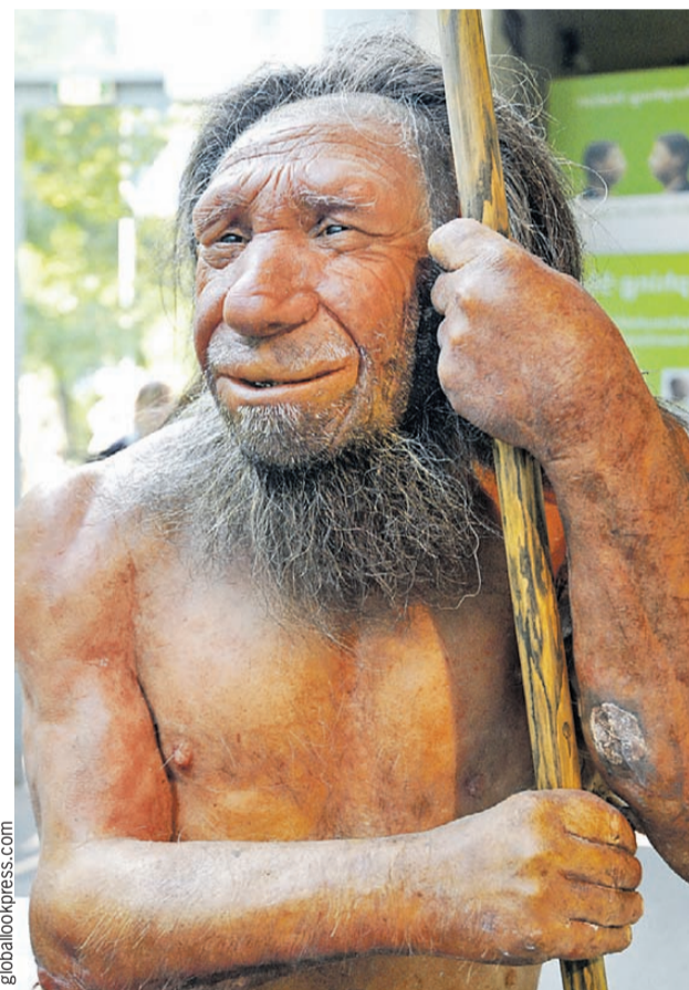
Вот такие допотопные ловеласы склоняли человеческих женщин к тесному общению.

Вряд ли кроманьонцы сильно зарились на неандертальских женщин, скорее их мужчины были охочи до другого привлекательного вида. И в этом увлечении они в прямом смысле слова не знали границ. Народов, которые каким-то чудом избежали сексуального домогательства неандертальцев, раз-два и обчелся. Генетиче-