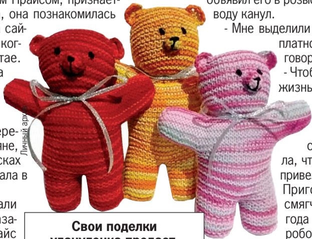
Свои поделки уланудэнка продает.