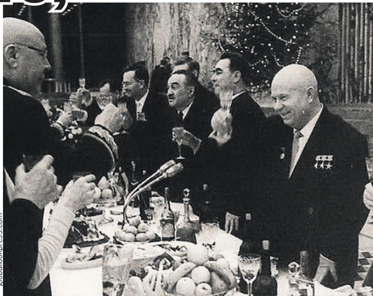
Маршал Советского Союза Семен Тимошенко (на фото - слева) поздравляет первого секретаря ЦК КПСС Никиту Хрущева с Новым годом. Справа от Никиты Сергеевича - его соратники Леонид Брежнев и Анастас Микоян. Москва, Кремль, декабрь 1963 г.

Постышев так и сделал: осудил «левый елочный загиб» и рекомендовал «положить ко-