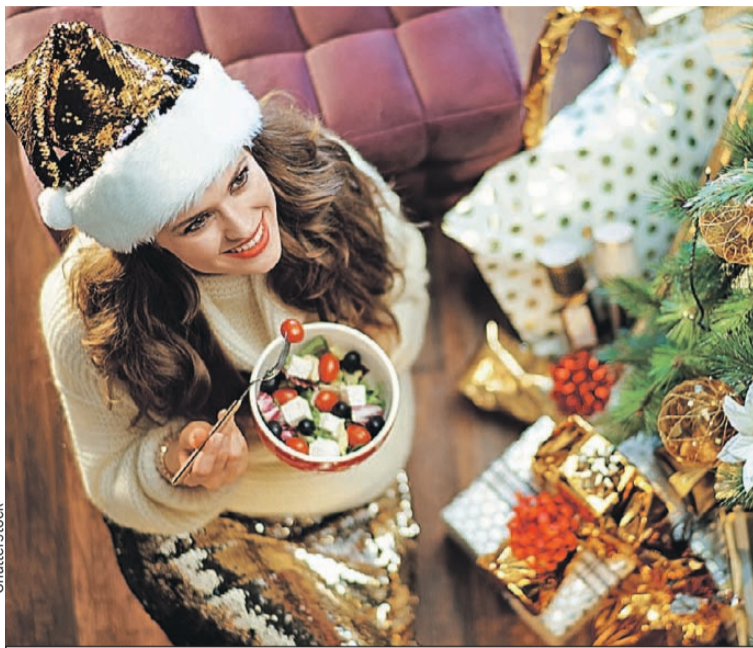
Даже полезной закуски должно быть в меру.

цепт. Картофеля кладите самый минимум, как будто это дорогой деликатес. Во-вторых, вместо покупного майонеза возьмите более легкую заправку (например, греческий йогурт или сметану) или сделайте домашний майонез. Так вы будете знать, что использовали самые свежие и натуральные компо-