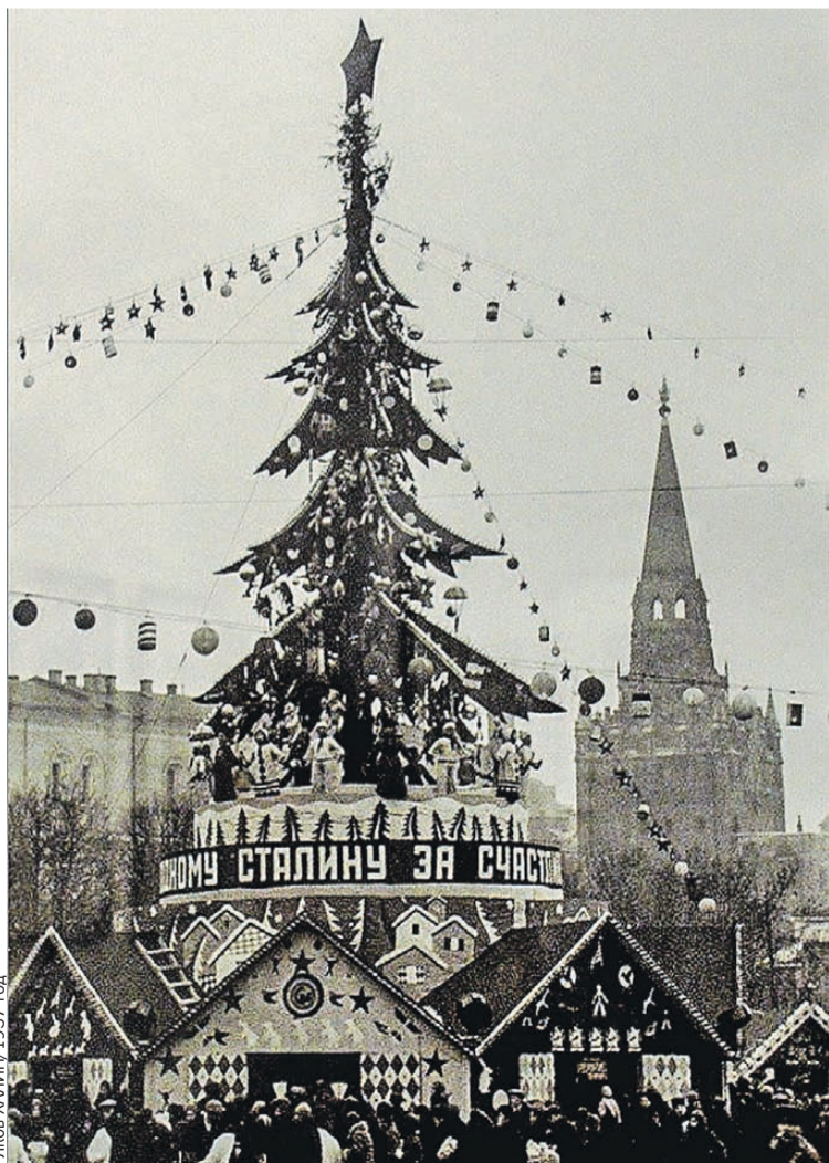
Москва, елка у Троицких ворот. В Кремле - товарищ Сталин, а на новогодней елке среди украшений - здравица в честь великого вождя. 1937 год.

Оказывается, в то время государь заложил не один, а целых три Александровских сада - Верхний, Средний и Нижний - от Угловой Арсенальной до Водовзводной башни: для «красоты и прогулок и праздных забав». Сегодня сад перестали делить на части: теперь он просто один Александровский. Но 200 лет назад народ охотнее всего шел именно к верхней большой рождественской и новогодней елке - у декоративного грота «Руины».