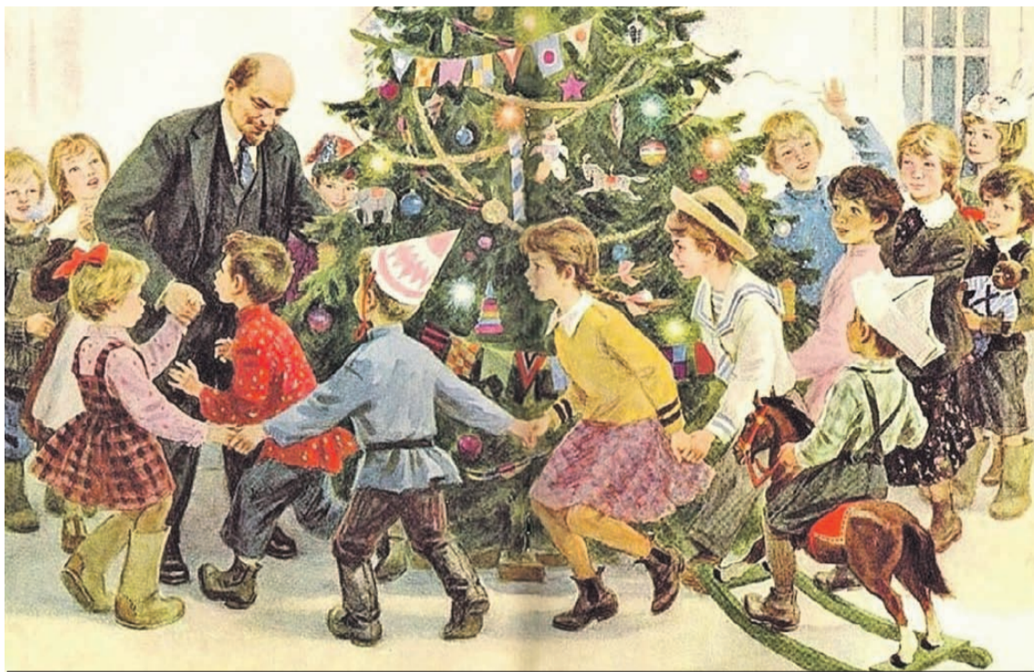
Детский новогодний хоровод с дедушкой Лениным. Поздравительная открытка. 1950-е годы.

ной хороминой на Красной площади, в Тайницком саду у зданий Старых и Новых приказов и у Лобного места, перед Спасскими воротами.