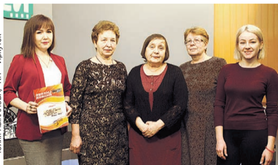
Тома из лучших коллекций «КП» отправились в школьные библиотеки.

- В первый год мы собрали очень много бумаги и благодаря этому участвовали в акции. А теперь дети приносят всю имеющуюся макулатуру. Причем мероприятие организуют родители,