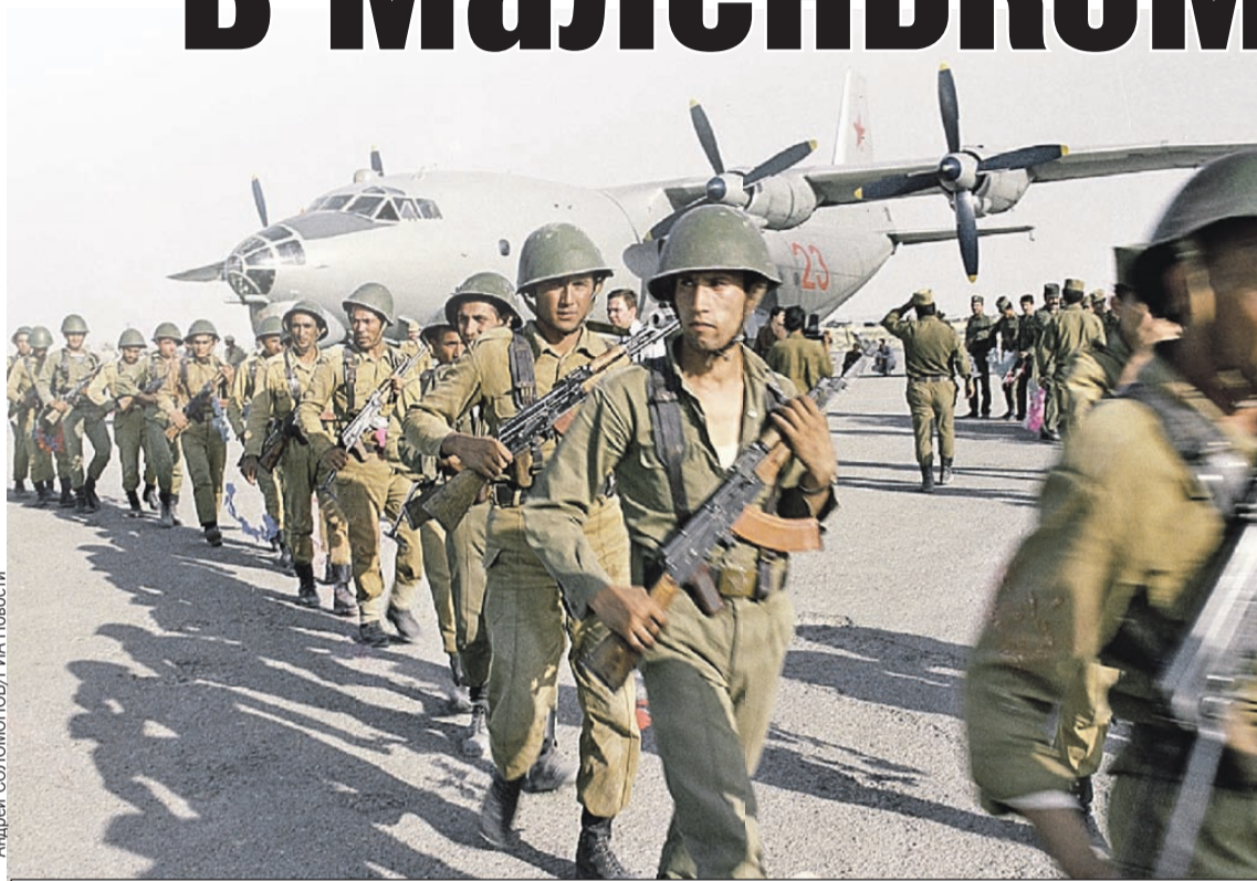
Советский спецназ высаживается в Афганистане. Весна 1988-го.

В самом СССР эта война поначалу держалась в секрете. Газеты и телевидение хранили молчание о ее размахе и потерях, сообщая лишь об исполнении «интернационального долга» в Демократической Республике Афга-