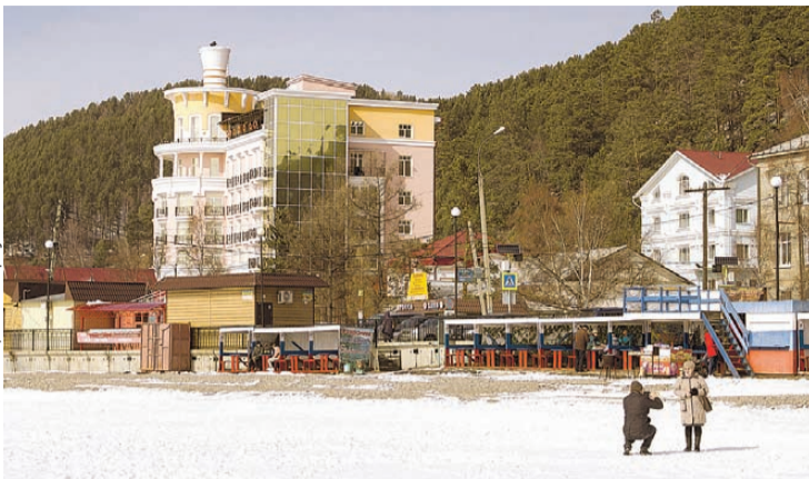
Зона отдыха на берегу имеет место быть, но организованная, а не стихийная, как сейчас.

- Дело в том, что палатки находятся слишком близко к кромке воды - менее 20 метров, - пояснили в ведомстве. - По закону это недопустимо, беседки мешают отдыхающим свободно гулять по берегу. Конечно, зона отдыха на берегу Байкала имеет место быть, но обустроить ее стихийно,