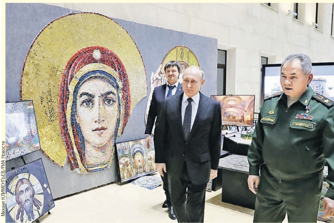
Владимир Путин приехал во вторник на ежегодную коллегию Минобороны. А перед этим Сергей Шойгу провел президента по выставке, на которой были не только новые вооружения, но и образцы внутреннего убранства Главного храма Вооруженных сил, который строится в Подмоскowie к 75-летию Победы.

- Я пью даже не чай, а заваренные, облитые кипятком травы с Алтая.