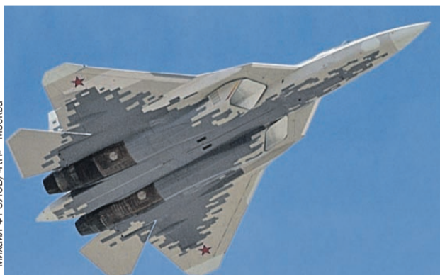
Михаил ФРОЛОВ/«КТ» - Москва

Срочно поднятый в воздух поисково-спасательный вертолет быстро обнаружил дымящуюся воронку от врезавшегося в землю истребителя. А в нескольких километрах - приземлив-