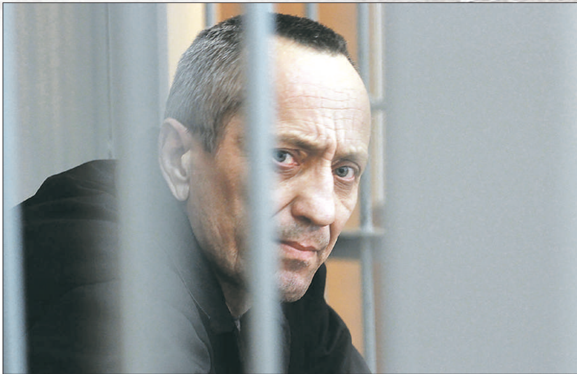
Михаил Попков рекордсмен: получил уже два пожизненных срока.

- У меня были лишь основания ее подозревать. Я не ишу себе оправдания, но это стало толчком к моему будущему, - признавался маньяк в интервью «КП» - Иркутск». - Каждый человек переживает по-своему: кто-то легко прочувствовал все и забыл, кто-то болезненно. Что получилось у меня? Самое худшее развитие сценария... Просыпаясь утром, первым делом бежал в ее