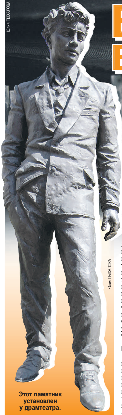
Этот памятник установлен у драмтеатра.

Лучшие коллективы России презентуют свое видение на известные произведения.