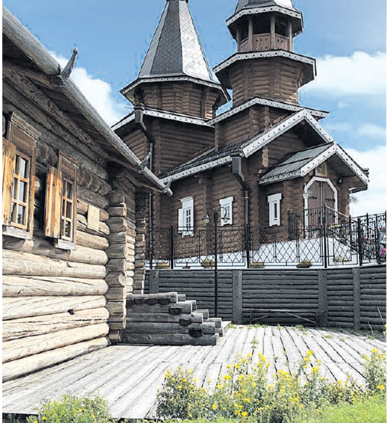
Архив Татьяна ЛЕБЕДЕВОЙ

Увидеть этот комплекс едут люди со всего мира.