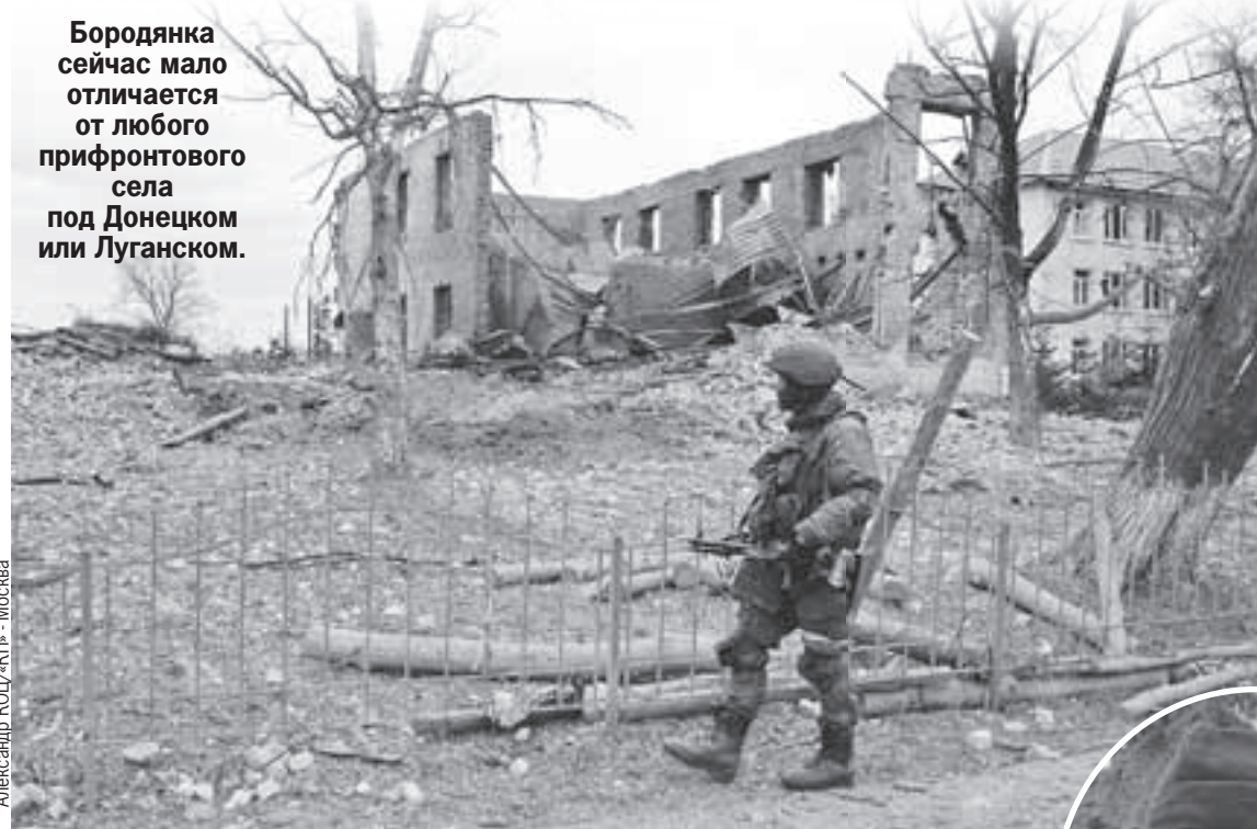
Александр КОЦ/КП - Москва

Бородянка сейчас мало отличается от любого прифронтового села под Донецком или Луганском.