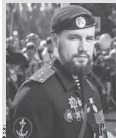
Вохе было всего 28 лет. Из них 8 он провел на войне.