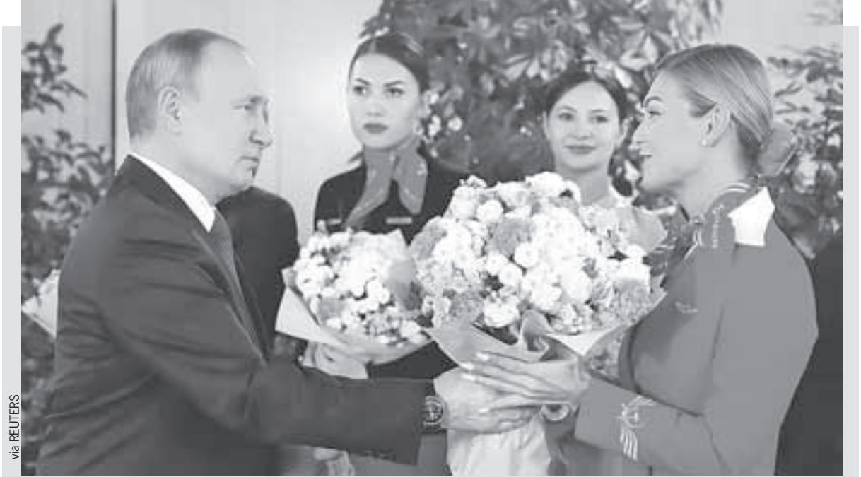
Накануне 8 Марта Владимир Путин в учебном центре «Аэрофлота» поздравил с праздником летный персонал и стажеров из разных российских авиакомпаний. И вручил букеты. Он осмотрел кабину, позволяющую отрабатывать навыки управления российским лайнером МС-21, и в сопровождении командира воздушного судна Марии Касьяник совершил имитационный полет на авиасимуляторе «Сухой Суперджет-100». А также посетил центр «Вода - суша» по подготовке экипажей к нештатным ситуациям.

(Министр труда и соцзащиты Антон КОТЯКОВ - о размере пособия на ребенка от 8 до 16 лет.)