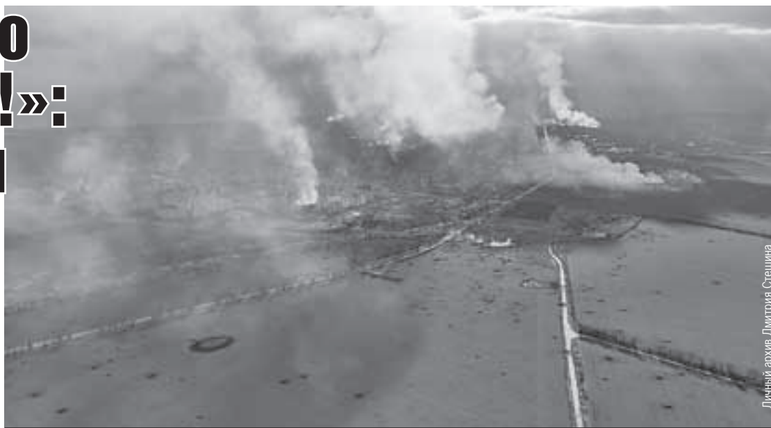
Так выглядят окрестности Мариуполя с высоты.

Он показал мне надпись на экранчике: «Уваг! Бійці ЗСУ! (ВСУ, Вооруженные силы Украины. - Авт.) Терміново (срочно. - Авт.) виходьмі з Маріуполя!»