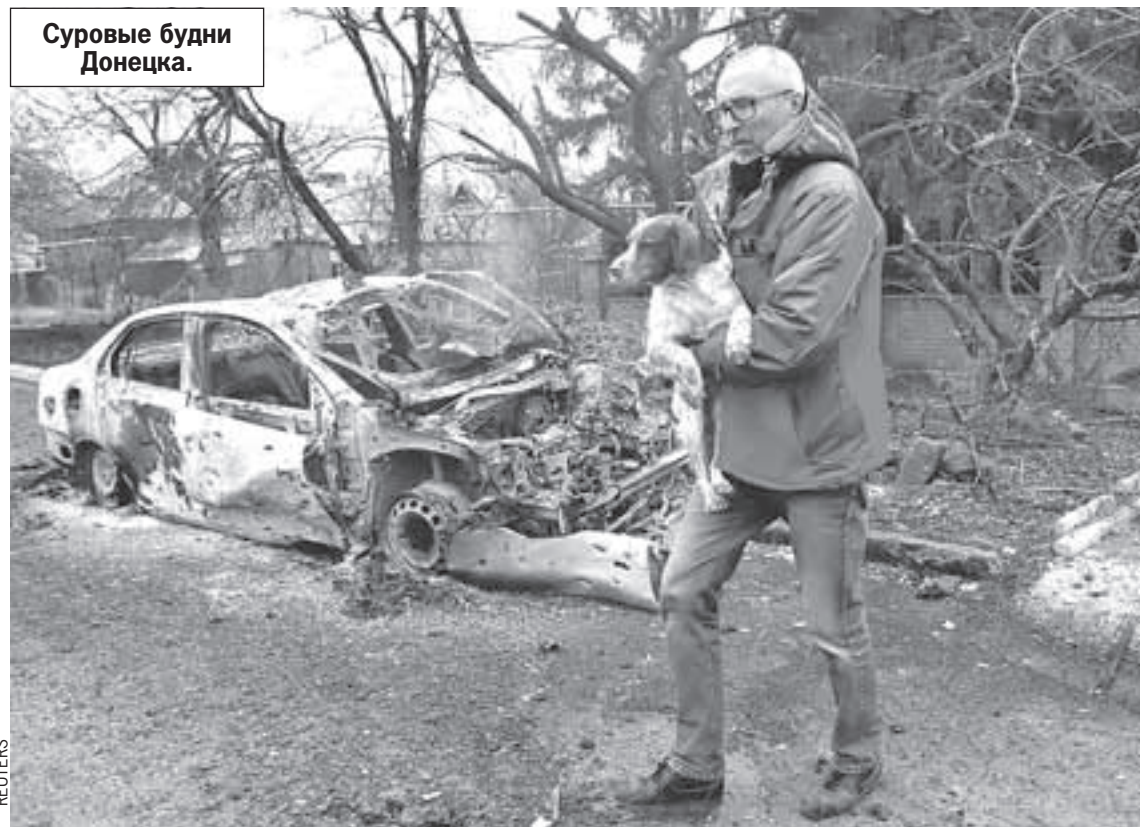
Суровые будни Донецка.

- Но вам даже не показали короткий список тех, кто из культуры понимает и принимает происходящее. Знаете,