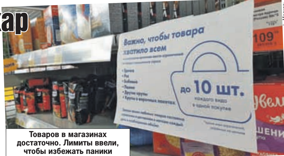
Товаров в магазинах достаточно. Лимиты ввели, чтобы избежать паники и отсеять спекулянтов.

больше, чем в обычный выходной. Продуктов хватает, однако на бакалейных полках - проблемы. Та же картина с растительным маслом и туалетной бумагой. А вот гречки нет вовсе. И водку размели почти подчистую - времени сейчас сложные, а бельскую власти не внесли в список социально значимых товаров (не иначе по недосмотру).