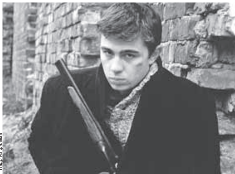
Сергей Бодров завещал нам: «Во время войны нельзя говорить плохо о своих!»

и Донбассу. В Донбасс заехало за все эти годы считанное количество артистов и музыкантов. Единицы!