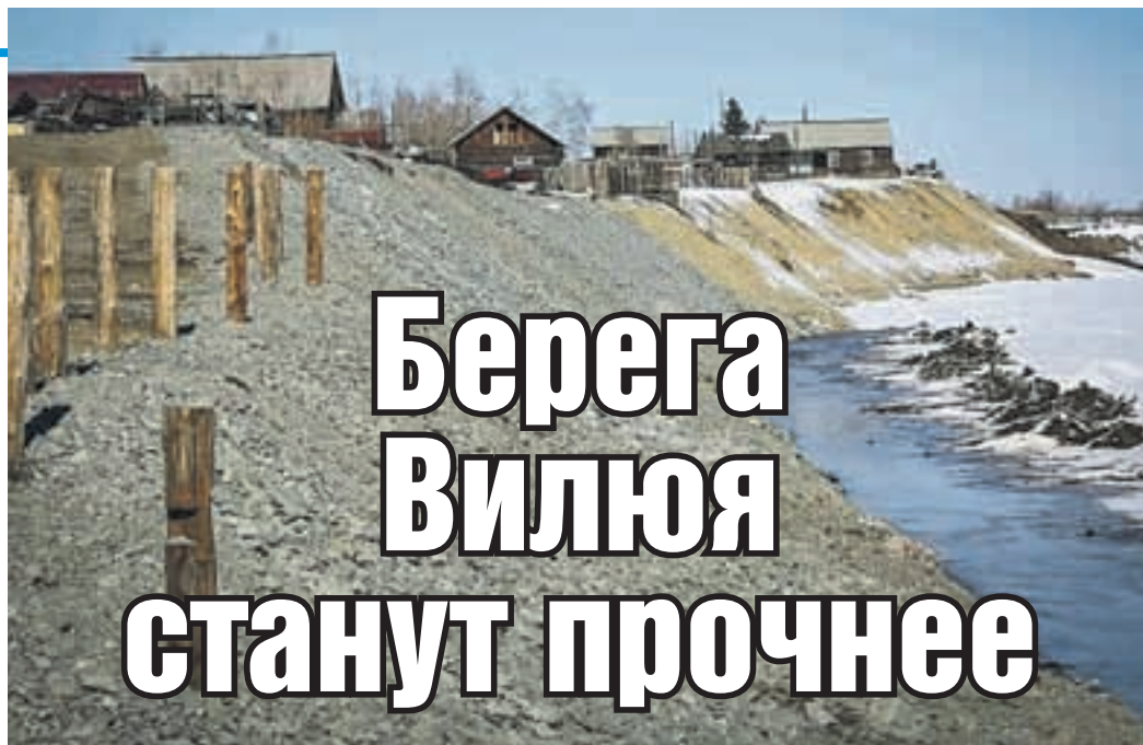
Эти откосы сделают более пологими и отсыпят прочным материалом.

Укрепление берега вблизи Верхневилуйска стало одной из тем, которую обсуждали на выездном совещании министра природных ресурсов и экологии