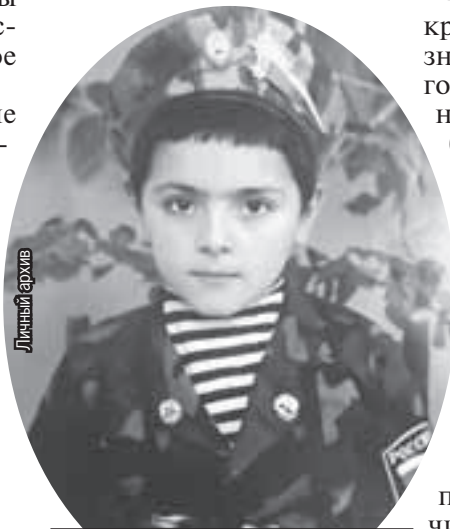
Будущий Герой России мечтал стать десантником с самого детства.