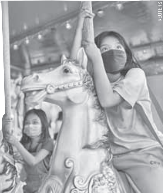
В мире постепенно отменяют ковидные ограничения. Но ношение масок остается обязательным. Например, на Филиппинах это требование касается и детей.

Пока антидепрессанты не входят в клинические рекомендации по лечению и профилактике сердечно-сосудистых осложнений COVID-19,