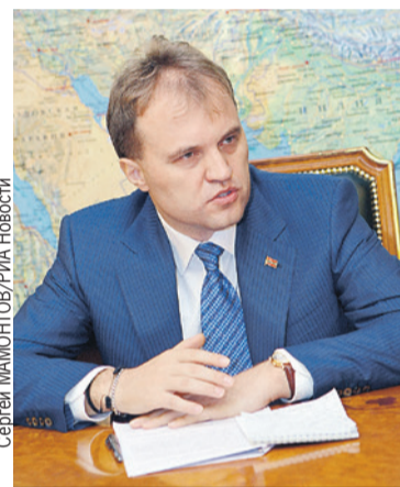
Евгений Шевчук несколько лет возглавлял Приднестровье.

- Большинство граждан всегда выступали против вывода российских миротворцев. Российские войска - в зоне разделения между вооруженными силами Молдавии и Приднестровья они являются сдерживающим фактором. Чтобы противоречия в экономической и политической плоскости не перетекли в агрессивную форму.