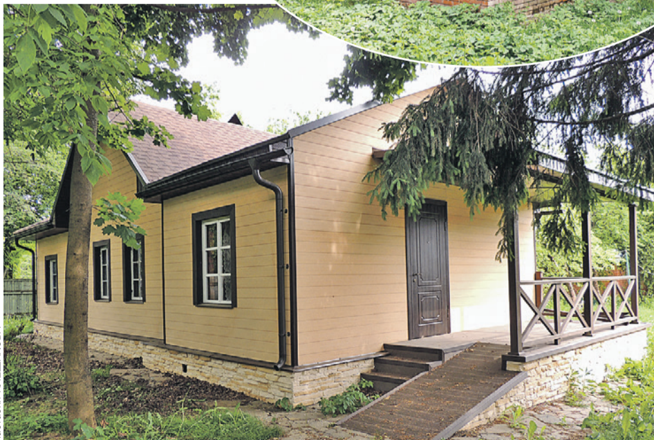
Дача Баталовых, хоть ее и преобразили дизайнеры программы «Идеальный ремонт» на Первом канале, стоит пустая. Пока сосед не снесет незаконные постройки, хозяева сюда ни ногой.