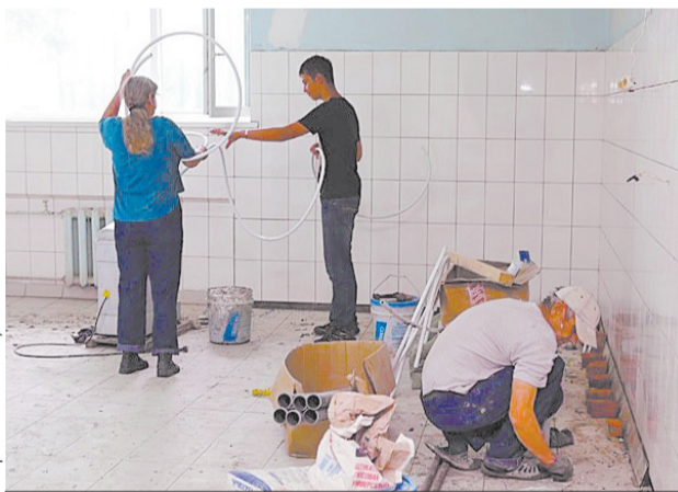
За лето в школах и садах предстоит сделать большой объем работ.

Особое внимание уделяют благоустройству прилегающей к учреждениям образования территории, ремонту дорог и лестниц