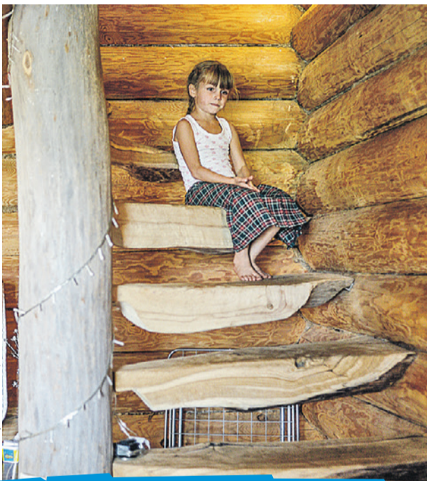
В новых деревнях новых сельских русских все экологично - даже ступеньки в доме.

людей умерло. Умирали одиночки-алкоголики, умирали и сгорали в своих домах целыми пьющими семьями. А статистика говорит, что употребление алкоголя стало снижаться только в последние годы. Руководители сельхозпредприятий так мне и говорят: «В брежневские времена квасили все, начиная с руководителей районов». Люди