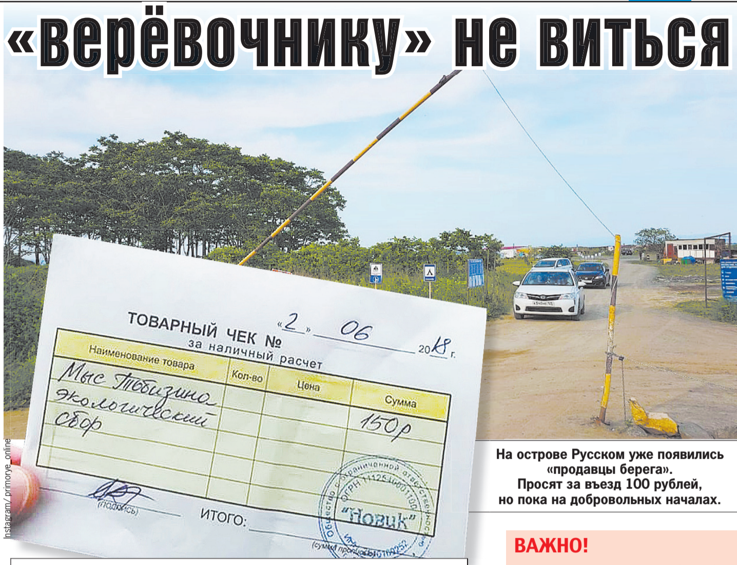
На острове Русском уже появились «продавцы берега». Просят за въезд 100 рублей, но пока на добровольных началах.

На Тобизина настолько крутые «верёвочники», что готовы выдавать вполне официальные товарные чеки с печатью.