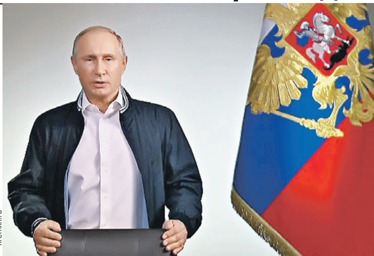
Владимир Путин поздравил выпускников школ 2018 года в соцсети, которая сегодня наиболее популярна у тинейджеров.

- Вы быстро осваиваете новые технологии, уже многое знаете и умеете. В этом ваша заслуга - и искренняя благодарность вашим родителям, учителям, наставникам за труд, мудрость и терпение.