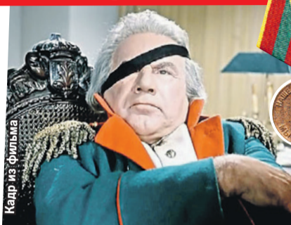
На войне Игорь Ильинский был рядовым фронтовой бригады. До звания фельдмаршала было еще 20 лет - фильм «Гусарская баллада», где он сыграл Кутузова, вышел в 1962 году.

Он не мог смириться с ужасами военной жизни - его пугала не столько опасность, сколько обыденность гибели: «...В овраге я вижу наш исковерканный обгоревший танк. Он уже несколько дней стоит здесь. Я заглядываю внутрь и вижу обгорелый и обуглившийся труп, слившийся с рулевым управлением.