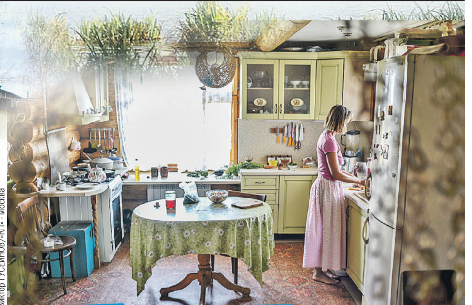
Переехавшие из мегаполисов устраивают свой деревенский быт не по сельским обычаям - по городским, чтобы не только красиво было, но и быт облегчалось...

- Тогда все очень плохо, особенно в малых городах. Картины, как в 90-х. Есть у нас еще один ресурс - малые предприятия в сельской местности. За счет чего рванул Китай? Большинство пластмассовых китайских игрушек сделано в сельской местности. В царской России село делало все что угодно - от карет до стекла. И даже в СССР была промыс-