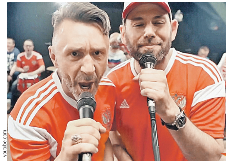
Шнур (слева) в случае поражения нашей сборной напишет новую песню...

Будем бутсы целовать вам, только знайте, чемпионы, стоит разик проиграть вам, снова станете - ***.