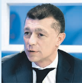
Евгения ГУСЕВА/«КП» - Москва

пенсионеров, так и будущих. Поставлена задача увеличивать пенсии выше инфляции. Люди, которые сегодня достигли пенсионного возраста, получают прибавку. В 2019 году она должна составить в среднем 1 тыс. рублей с учетом индексаций в феврале и апреле. Прибавка означает, что в течение следующего года средняя пенсия будет уже 15 400 рублей.