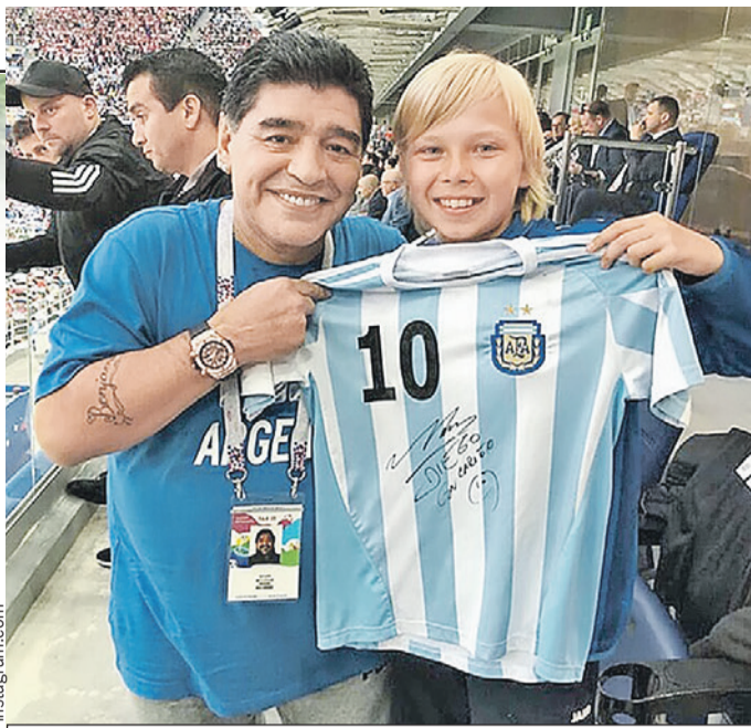
Не каждому поклоннику футбола выпадает такое счастье, чтобы тебя обнял сам Марадона.

Но Марадона сам заметил в толпе светловолосого