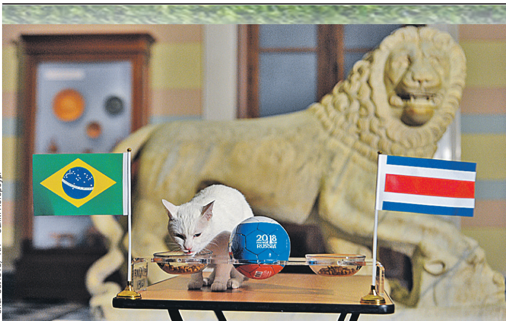
Кот-оракул Ахилл предсказал победу сборной Бразилии над Коста-Рикой. Пентакампионы выиграли 2:0, забив два мяча в самом конце игры.