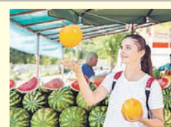
Валерий ЗВОНАРЕВ / «КП» - Челябинск