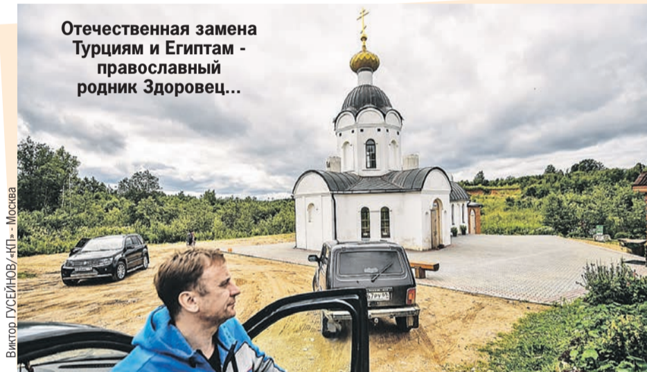
Виктор ГУСЕЙНОВ «КП» - Москва

б) красив (по запросу «Селигер» из интернета высыпаются красоты отрендериванной Ниловой Пустыни, палатки на фоне заката, поддаты рыбаки в компании с копченым угрем, рой полногрудых до-