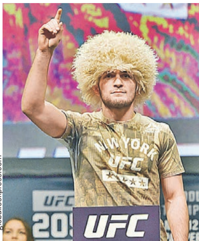
Хабиб научился раскручивать свои бои. Но встреча с Конором - это уже личное, а не бизнес.

- В тюрьме Конору было бы гораздо безопаснее. Если бой состоится, то Хабиб станет тем человеком, который