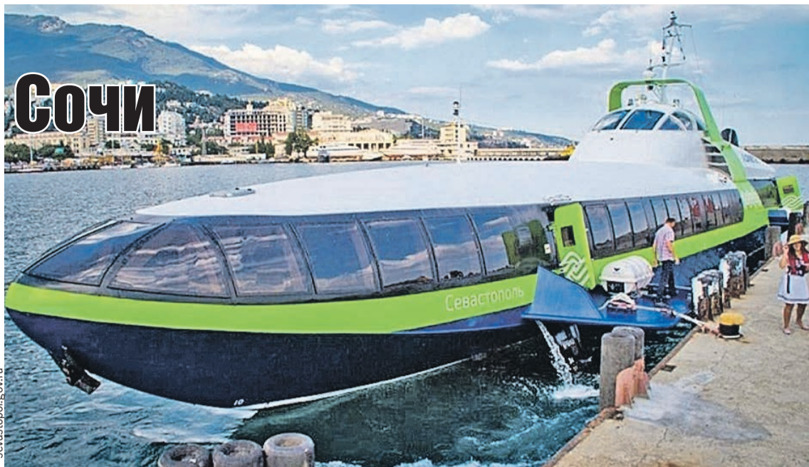
Эта красавица, которая из Севастополя домчит туриста до Ялты меньше чем за два часа, вмещает 120 пассажиров. А через год ее увидят и в портах Краснодарского края.

- Мы приняли десятки нестандартных решений по энерго- и водоснабжению, по обеспечению газом,