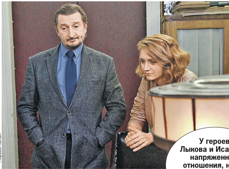
У героев Лыкова и Исаковой напряженные отношения, но им приходится общаться - убийца сам себя не поймает.

а что - отказываться? А было время, когда надо было просто работать и не думать, нравится тебе роль или нет. Потому что было ограниченное количество работы. Сейчас получше ситуация, мне кажется.