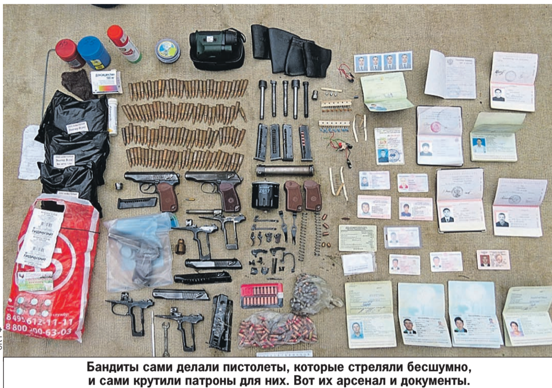
Бандиты сами делали пистолеты, которые стреляли бесшумно, и сами крутили патроны для них. Вот их арсенал и документы.