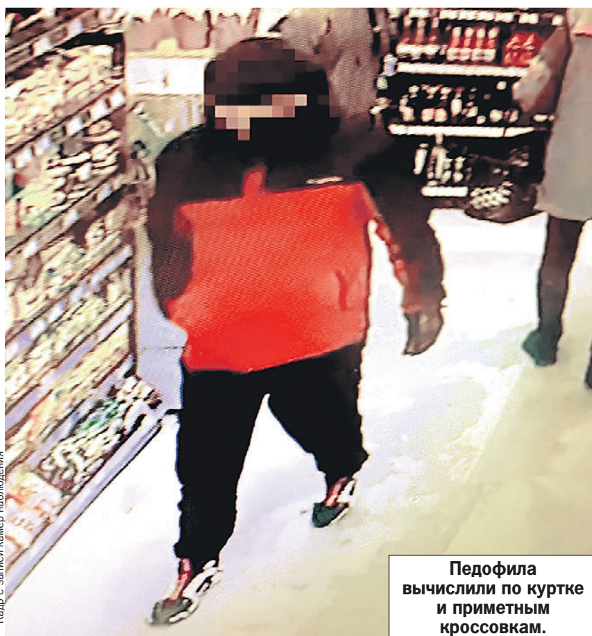
Педофила вычислили по куртке и приметным кроссовкам.

Выяснилось, что педофилу 44 года и раньше он уже был судим. Следователи завели против него уголовное дело по статье «похищение» (по ней грозит до 12 лет лишения свободы).