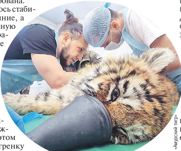
Во время операции малышу дали общий наркоз - чтобы меньше беспокоился.

Главное, чтобы травма не доставляла тигрице дальнейшего дискомфорта, - только в этом случае ее вернут в дикую природу. Наблюдать за хищницей нужно еще около месяца.