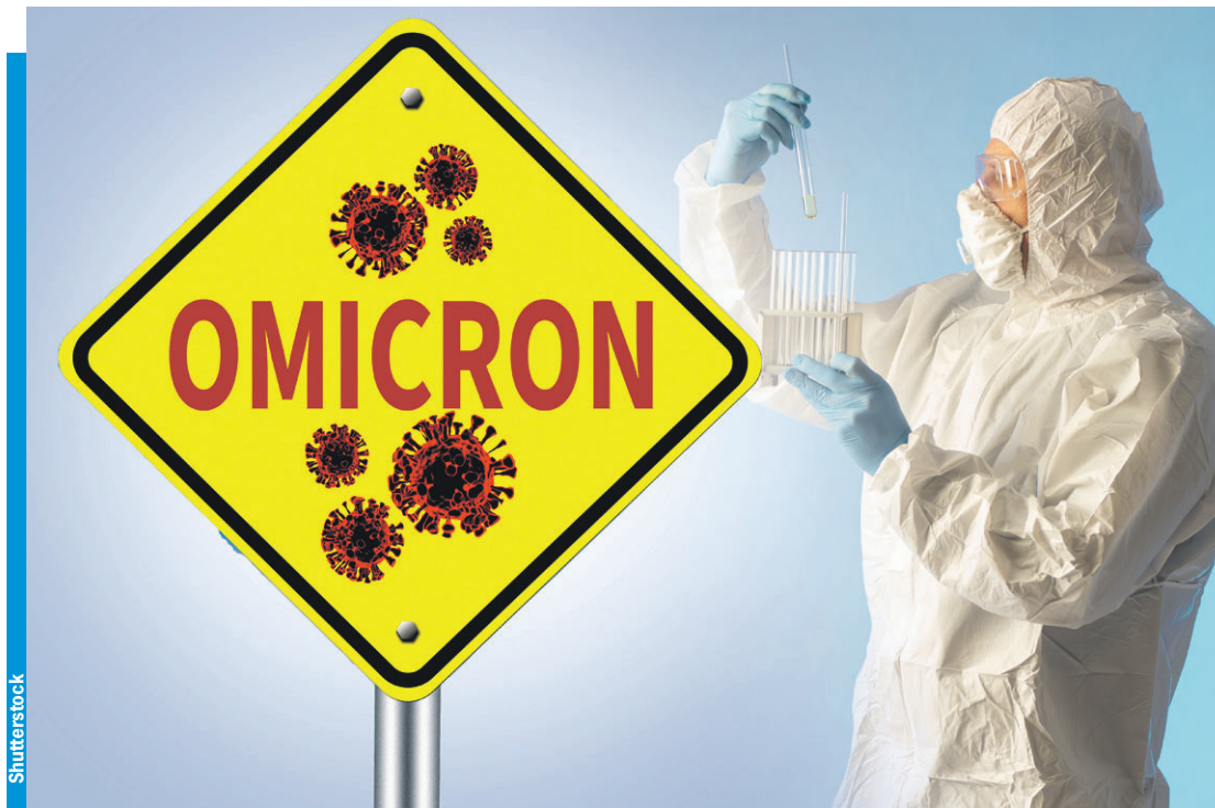
Мутировавший коронавирус проверяет на прочность систему здравоохранения. Выстоит или нет?

- Мы испытали максимальные нагрузки в четвертую волну, которую сейчас проходим. В регионе коечный фонд составляет 9,5 тысячи единиц. Мы задействовали максимально 3000 коек. Если пойдет увеличение за-