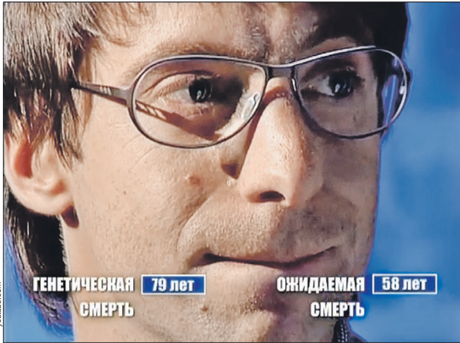
Смерть в 58 лет - именно такой страшный прогноз дали врачи, проверившие состояние здоровья Зеленского, которому на тот момент было всего 36...