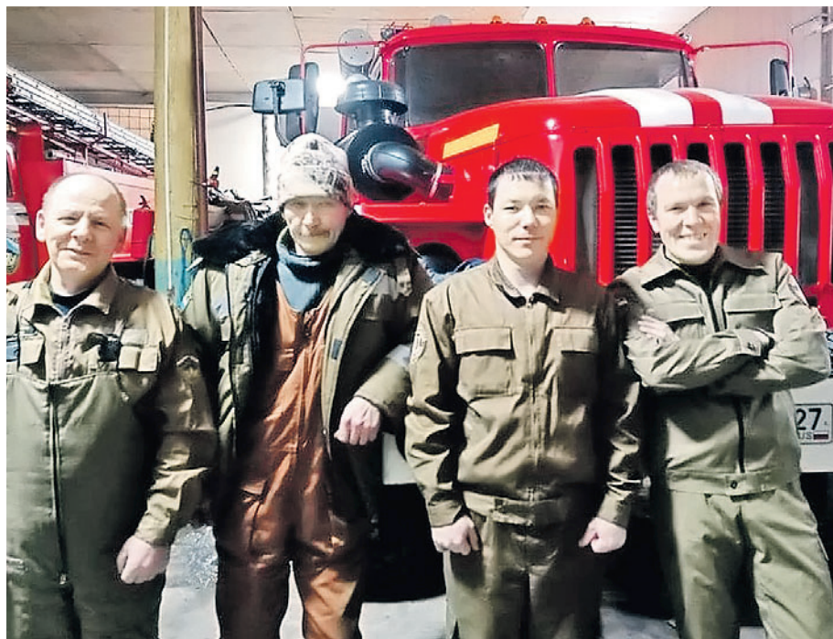
Четверо спасателей пришли на помощь рыбакам.