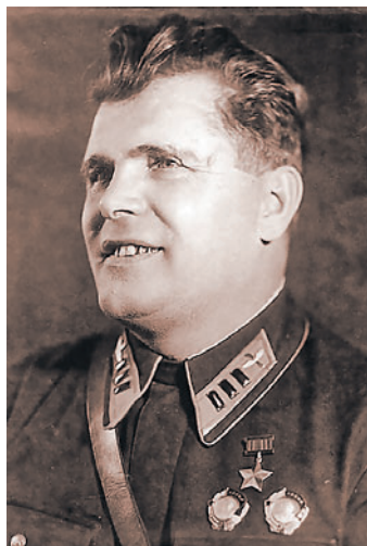
Первым дальневосточным пилотом по праву считается Михаил Водопьянов. Кабина аэроплана в те времена не отапливалась, поэтому приходилось работать в таком обмундировании.