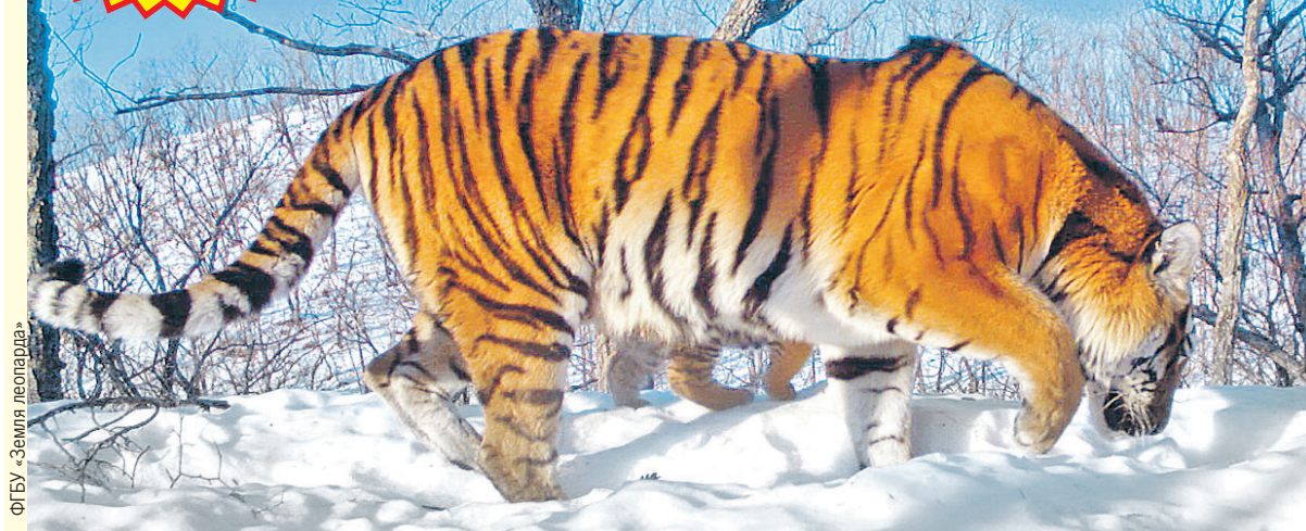
ФГБУ «Земля леопарда»