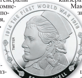
5-фунтовая монета с изображением Эдит Кэвелл

медсестру-правдоискательницу, хотя за укрывательство британских солдат ей полагалось всего несколько месяцев тюремного заточения. Уайзмен являлся партнером банкиров американского инвестиционного банка Куна и Леба, ранее профинансировавшего Японию для войны с Россией, и тесно сотрудничал с главой Федеральной резервной системы (ФРС) США Полом Варбургом, выходящем из знаменитого немецкого банковского клана Варбургов - братом особо доверенного консультанта кайзера Вильгельма