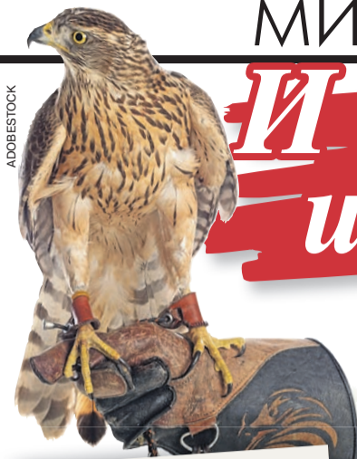
В Кремле есть подразделение Федеральной службы охраны, в штате которого состоят соколы-балобаны, их задача - отгонять ворон и «регулировать» численность голубей.

- Соколиную охоту невозможно описать, ее надо видеть, - делится впечатлениями