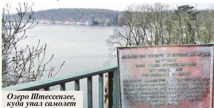
Озеро Штессензее, куда упал самолет