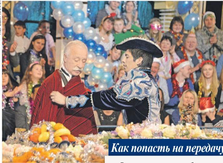
Как попасть на передачу