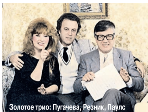
Золотое трио: Пугачева, Резник, Паулс

- Не знаю точно, сколько у меня песен. Несколько сотен. Из них много ушло в народ. Как это получается? Иногда песня может очень долго оставаться без движения. Просто валяться где-то, как у одной певицы (Аллы Пугачевой. - Ред. ) валялся «Айсберг». Лежал четыре года у нее на рояле. А потом прошло время, и - раз! - «Айсберг» выплыл, взял курс на популярность. Почему? Очевидно, что просто в какой-то момент все сошлось: какие-то ветра пересеклись, человеческие эмоции, зрительские ожидания. Когда это все сложится, тогда и получается хит.