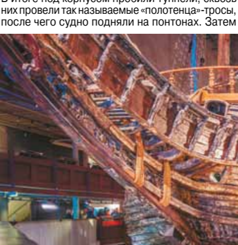
«Васа» — самый известный из поднятых и отреставрированных кораблей.

— Получается, в процессе исследования корабля можно найти и другие органические артефакты? — Вполне возможно, что в этом иле, который насыщен сероводородом, мы могли бы найти фрагменты растительных канатов, может, фрагменты кожаных изделий. Но самая заветная мечта любого археолога — найти на одном из таких корабельных цесту — особый пенал, в котором хранились древние книги. О такой находке в свое время мечтал выдающийся археолог Владимир Дмитриевич Блаватский.