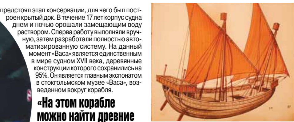
Так мог выглядеть этот византийский корабль.

Недавняя ситуация в московской школе, когда большой диабетом мальчик был вынужден делать сам себе укол инсулина в туалете, навела депутатов на мысль о том, что с системой медицинской помощи в образовательных учреждениях не все в порядке. Главная проблема несчастных случаев в школе, связанных со здоровьем детей, в том, что до занятий физкультурой допускают учителей, не прошедших глубокой диспансеризации, — говорит зампред Комитета Госдумы по охране здоровья Олег Куликов. — Мы неправильно отказались от прежней практики — обязательного медосмотра и требования справки перед поступлением в школу, — добавляет зампред комитета Госдумы по образованию Ирина Мануйлова. — Справка перестала быть обязательной, поскольку существует понятие медицинской тайны. Родители не хотят, чтобы о серьезных проблемах со здоровьем ребенка знали педагоги и одноклассники. А учителя, не зная этих нюансов, не могут обеспечить безопасность детей! Полтора года назад был издан приказ Минздрава о медпомощи в образовательных