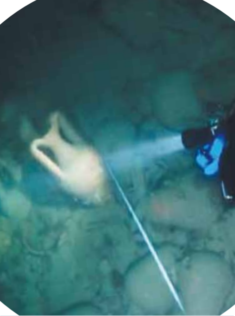
На дне аквалангисты работают 20 минут, а поднимают на поверхность полтора часа.