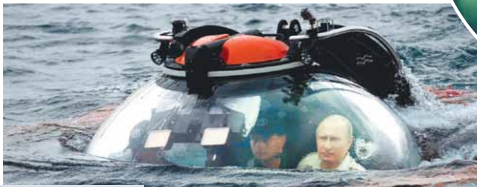
В августе в рамках экспедиции РГО к затонувшему судну в батискафе погрузился Владимир Путин. Под водой президент провел около 40 минут.