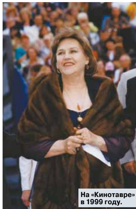
На «Кинотавре» в 1999 году.