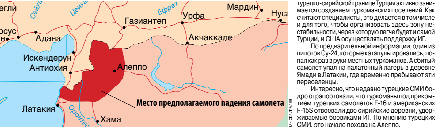
Место предполагаемого падения самолета

Турецкая сторона утверждает, что Су-24 был сбит истребителями F-16. При этом самолет-нарушитель перед этим якобы предупреждали 10 раз.