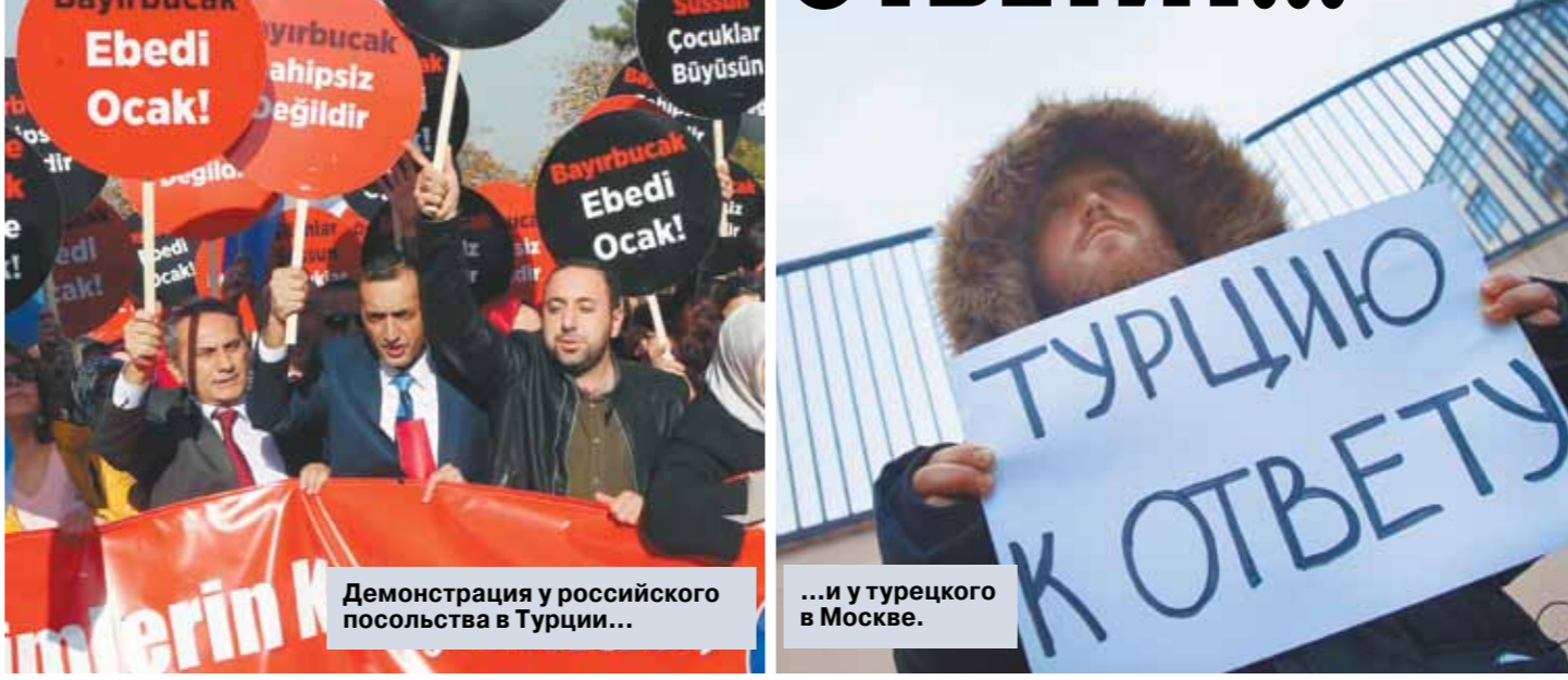
Демонстрация у российского посольства в Турции...