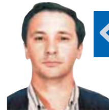
Джузеппе Д'АМАТО, итальянский журналист