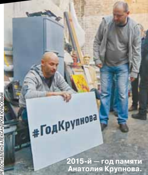
2015-й — год памяти Анатолия Крупнова.

В первый раз я увидел его, когда был совсем юным человеком и только поступал в институт. Потом пришлось уйти на два года в армию, куда мне прислали материалы «Звуковой дорожки», вырезанные из газеты. Тогда для меня эти заметки были глотком свежего воздуха, и я всегда нетерпеливо ждал, когда же придет конверт с ними, следил, что происходит у нас на сцене.