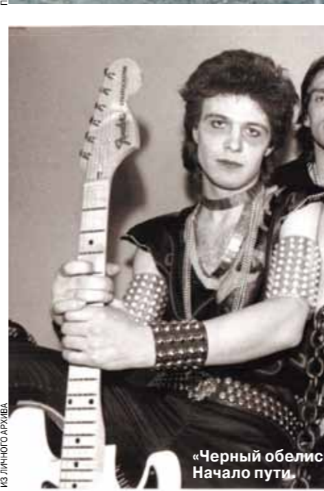
«Черный обелиск». Начало пути.

Как команда будет работать? Но музыканты успокоили его и сказали, что все пройдет хорошо. Перед записями Толкиа подливал гипс, «валывал» в себя обезболивающее и играл. Я следил за перемещениями команды и как-то пришел послушать ее живьем.