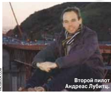
Второй пилот Андреас Лубитц.