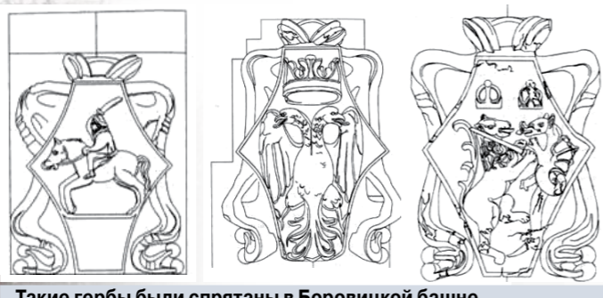
Такие гербы были спрятаны в Боровицкой башне.

Кремль преподнес еще одну историческую сенсацию