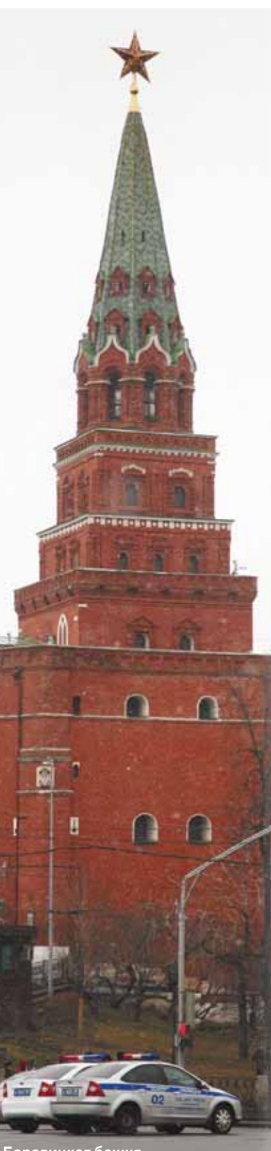
Боровицкая башня скоро закроется на реконструкцию...