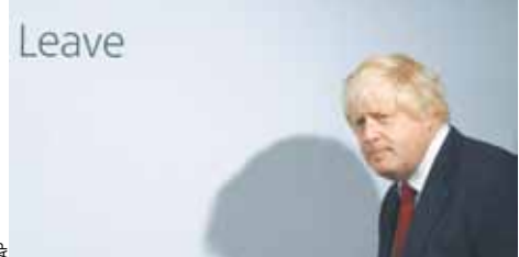
Экс-мэра Лондона Бориса Джонсона считают наиболее вероятным кандидатом на пост премьер-министра Великобритании.

Букмекеры уверены, что максимальными шансами сменить Кэмерона располагает экс-мэр Лондона Борис Джонсон (вероятность его избрания новым премьером оценивают в 50%). Меньше шансов (20%) у лорда-канцлера Великобритании и министра юстиции Майкла Гова, за ним следуют глава МВД Тереза Мэй (15%). Как известно, Борис Джонсон, до мая этого года возглавлявший британскую столицу, выступал с резкой критикой политики Брюсселя и заявлениями о том, что Британии следует освободиться от диктата ЕС.