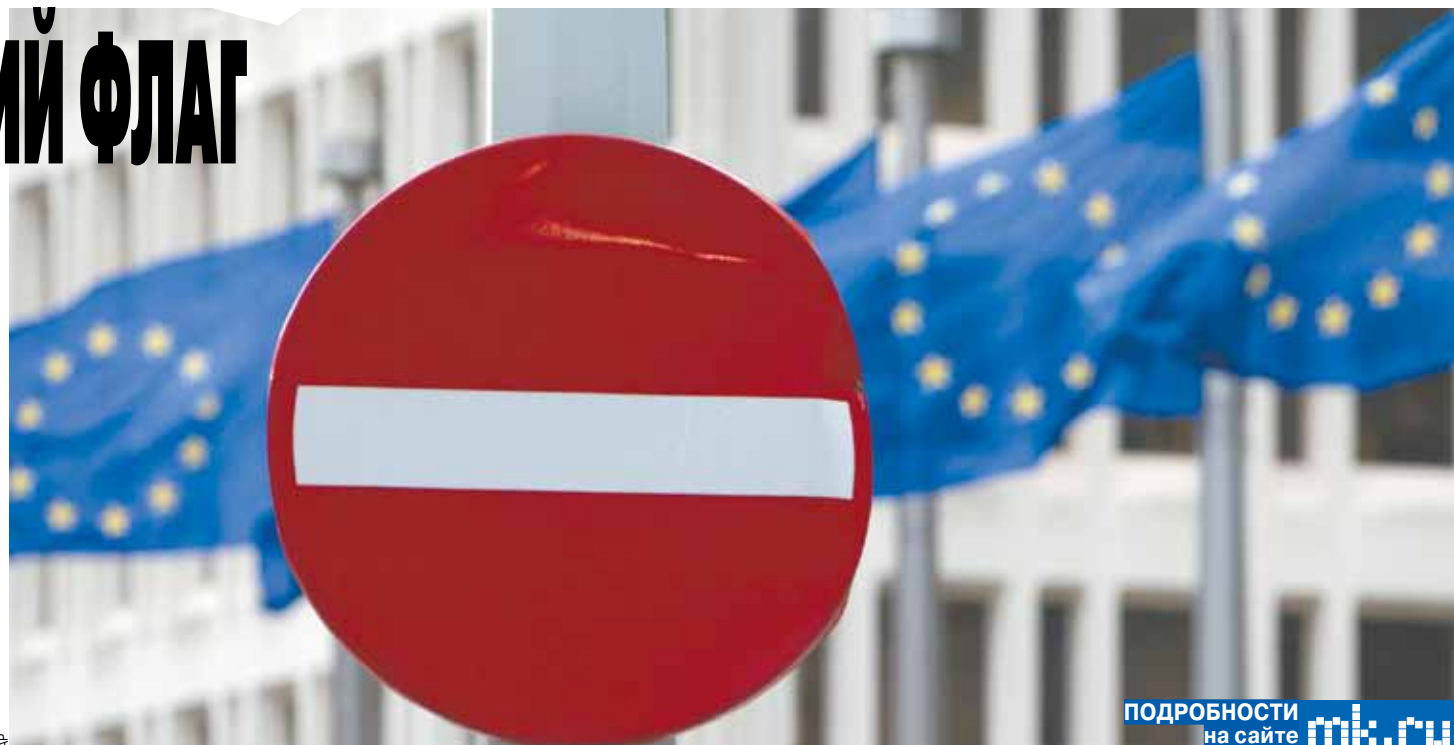
ПОДРОБНОСТИ на сайте m.k.ru

Хотя лидеры сторонников выхода из ЕС разглагольствовали о суверенитете и о верховенстве британского парламента над бюрократической, о «восходе заливной солнцем» страны, их тревожили тучи, нагнетаемые свободой