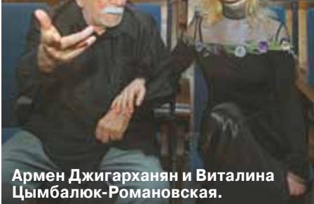
Армен Джигарханян и Виталина Цымбалюк-Романовская.