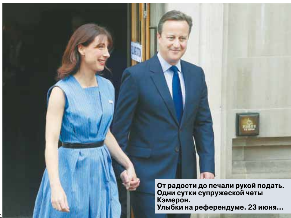
От радости до печали рукой подать. Одни сутки супружеской четы Кэмерон. Улыбки на референдуме. 23 июня...