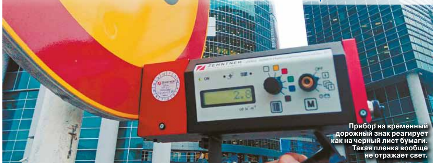
Прибор на временный дорожный знак реагирует как на черный лист бумаги. Такая пленка вообще не отражает свет.