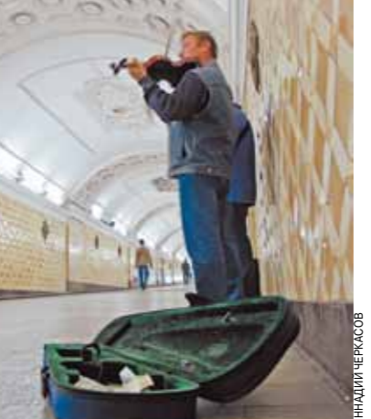
Уличный музыкант в Москве.

Уличным музыкантам запретят выступать в столичном метро