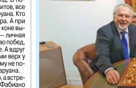
1 апреля — никому не верим!

«МК» возрождает легендарный турнир по шахматным поддавкам