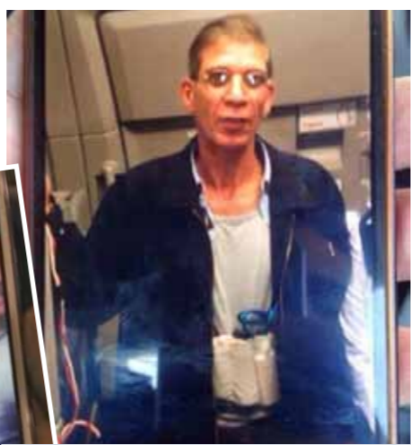
В соцсетях появилось фото предполагаемого угонщика с «поясом смертника».

не столь успешной. Захват рейса 648, летевшего из Афин в Каир, устроили палестинские боевики из группировки Абу Нидяля. Лайнер сел на Мальте в международном аэропорту. Прибывшие на Мальту египетские спецназовцы предприняли штурм самолета, тогда террористы стали вести огонь по находившимся на борту людям и взорвать ручные гранаты. Итогом стала гибель 58 человек из 95 пассажиров и членов экипажа. Не впервые приходится иметь дело с Египтом в контексте захвата самолета и аэропорту Ларнаки. В 1978 году в столице Кипра, Никосии, был убит редактор одной из египетских газет, друг президента Сада. Его убийцы взяли более 10 человек в заложники и отправились в Ларнаку, где потребовали предоставить им самолет. Садат, разгневанный убийством друга, отправил спецназ в Ларнаку.