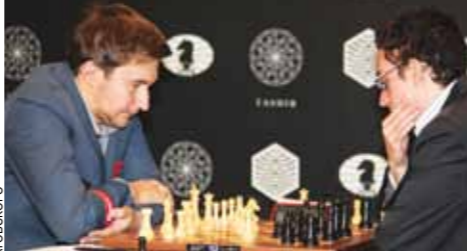
Сергей Карякин выиграл турнир претендентов