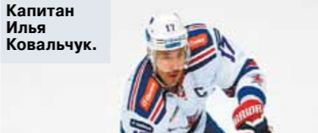
Капитан Илья Ковальчук

Главный победитель армейского дерби — национальная команда