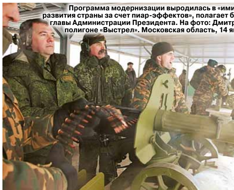
Программа модернизации выродилась в «имитацию политики развития страны за счет пиар-эффектов», полагает бывший советник главы Администрации Президента. На фото: Дмитрий Медведев на полигоне «Выстрел». Московская область, 14 января 2010 года.