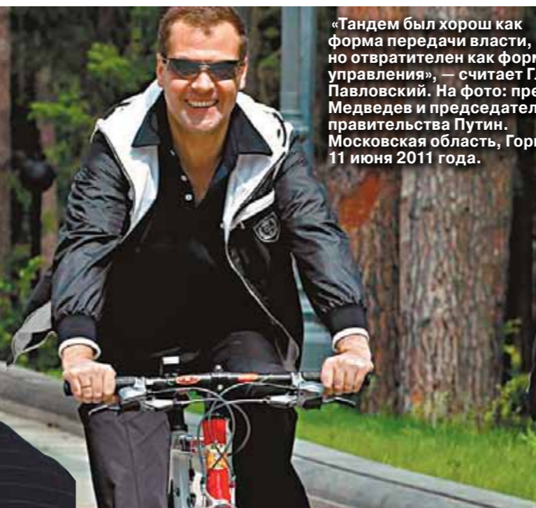
«Тандем был хорош как форма передачи власти, но откровенно как форма управления», — считает Глеб Павловский. На фото: президент Медведев и председатель правительства Путин. Московская область, Горки, 11 июня 2011 года.

— Она легко опровергается: люди, которые шли на Болотную площадь, были в рости на Медведева и возмущены рокировкой больше, чем выборами. Странников Медведева на Болотной, думаю, было очень мало. Но версия «заговора» действительно активно обсуждалась в верхах. Она исходила из кругов, которые проявили себя позднее в роли партии войны. Миф о «заговоре Медведева» был частью заговора по загугиванию Путина. — Это люди из окружения Путина? — А кто же еще? Но они есть и в обществе. Искать их недолго: они каждый день на телеэкране. — Вы по-прежнему считаете, что возвращение Путина было неудачной идеей? — К сожалению, это уже стало наглядным. За 15 лет взгляд Путина на государство и свое место в нем сильно изменился. При перелинии 2002 года на вопрос о работе Владимир Владимирович, помнится, ответил: «Оказываю услуги населению». Сейчас он придерживается совсем другой точки зрения. Известное высказывание — «нет Путина — нет России» — не случайно. Ветер, конечно, дует от Путина. Но в виде конкретного высказывания, разумеется, а как ощущение, «атмосфера».