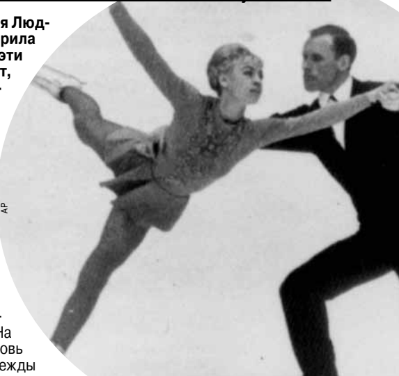
Белоусова и Протопопов — первопроходцы советского фигурного катания.

В это трудно поверить, но Белоусова — Протопопов катались и до последнего времени. Кому-то это казалось, при всем уважении к фигуристам, даже лишним. Всему, мол, есть свое время. Но не кататься для них, не выходить на лед было все равно что не дышать. А значит, не жить. «Наша сила только в том, что мы каждый день выходим на лед. Если потеряем его — потеряем все...» В 1999 году, впервые после побега, они прилетели в Москву и Питер. Их тогда пригласил Вячеслав Фетисов на финал Гран-при по фигурному катанию в Петербурге. А Олег Алексеевич, принимая приглашение, не замедлил уточнить: «С чего это вдруг и в качестве кого? Не сваденские ли генералов?» В этой роли они себя видеть не хотели. Когда поняли, что их ждут по-настоящему, сказали, что были бы счастливы хотя бы час покататься на незабываемом для них льду «Юбилейного». Это ведь был первый дворец в Питере, построенный еще при Хрущеве. Когда-то при личной встрече с Хрущевым легендарные спортсмены говорили о том, что не может Ленинград оставаться без ледового дворца. Он поддержал их идею, поддержал и болельщики, которые по рублю в письма присылали фигуристам деньги на строительство катка. ...Тоненькая, хрупкая Людмила рядом с партнером и мужем в аэропорту казалась какой-то нереальной. Как смогла природа спрятать такую мощь характера в столь легкой, до прозрачности, оболочке? «В фигурном катании долготы, быть только, как в женщине», — скажет Олег Протопопов. В Белоусовой была тайна.