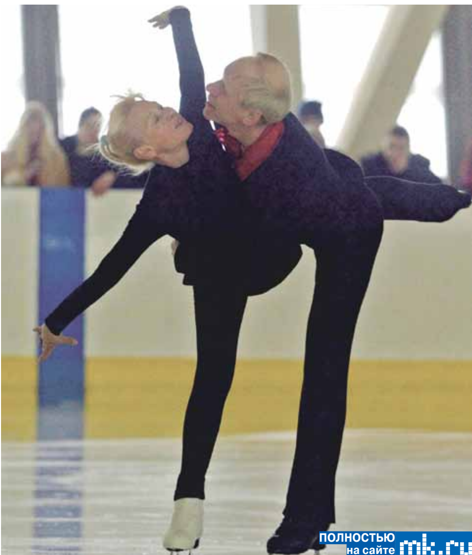
полностью на сайте mk.ru