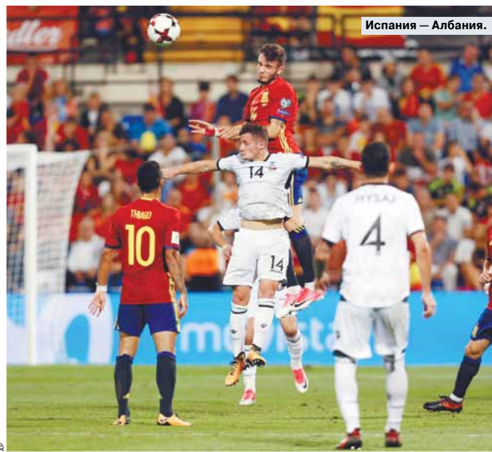
Испания — Албания.