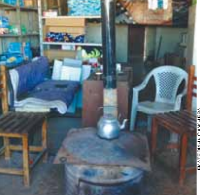
На блокпосту по дороге в Дамаск все спокойно.

— Зарплату переводят на карточку? — Как сам захочешь. Обычно на карточку жене или кому скажешь, да.