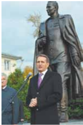
говор. Но самое главное — вряд ли мы выиграли бы эту войну без него, точнее, без службы разведки, которой он виртуозно руководил.

Памятник легендарному руководителю внешней разведки Павлу Фитину появился в центре Москвы, около исторического здания СВР на Остоженке. Скульптор запечатлел Фитина с улыбкой на лице в тот момент, когда он первым узнал из донесений разведки об окончании Великой Отечественной войны. «Недавно я вспоминал свои первые впечатления от фильма «Семь наград мгновенной весны», — говорит глава СВР Сергей Нарышкин. — Особенно тогда запали слова шифровки полковника Исаева: «Юстас — Алексу». Я тогда думал: кто