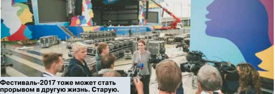
Фестиваль-2017 тоже может стать прорывом в другую жизнь. Старую.