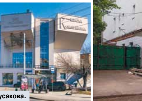
ДК им. Русакова.