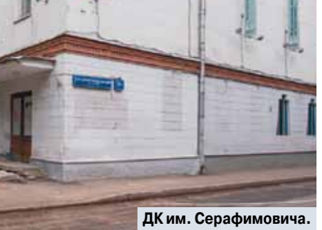
ДК им. Серафимовича.