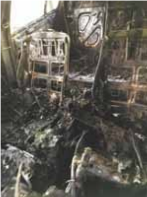
дело означает, что речь идет все-таки о поджоге. Как правило, закон отводит на доследственную проверку трое суток. Если же требуется проведение каких-либо экспертиз или получение тех или иных дополнительных данных, прокуратура может продлить этот срок до 30 суток. Поджог машины произошел 3 сентября, и соответствующее уголовное дело, скорее всего, было возбуждено не позднее 3 октября. Можно предположить, что полиция этот месяц потребовала для проведения пожаротехнической экспертизы, которая сняла подозрение в причастности к уничтожению журналистской BMW ее же собственной электропроводки. Возбуждение уголовного