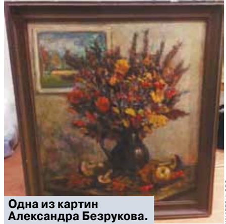
Одна из картин Александра Безрукова.

— Удивительная все-таки штука жизни! Вот так живет человек на свете и не знает, что параллельно живет и его портрет, — недоумевают сотрудники Орехово-Зуевского историко-краеведческого музея. — А случилась эта история 29 сентября. К нам в выставочный зал пришли три женщины почтенного возраста, чтобы полюбоваться картинами, выставленными к 70-летию основания местной художественной мастерской. Походив по залу, они вдруг ахнули и подошли к нам. «Вот она, модель!» — сказала одна из бабушек, указав на свою подругу.