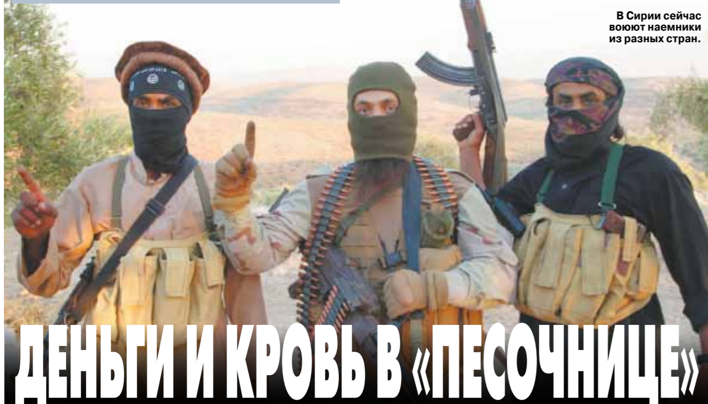
В Сирии сейчас воюют наемники из разных стран.