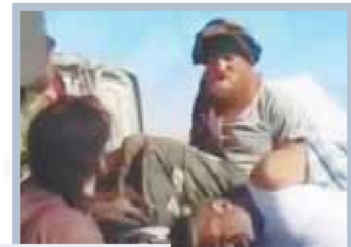
Живы ли захваченные в плен исламистами казаки Роман Заболотный и Григорий Цуркану?