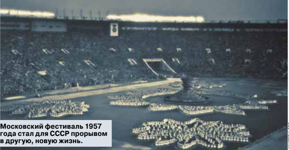
Московский фестиваль 1957 года стал для СССР прорывом в другую, новую жизнь.

Первый вариант деловой программы, разосланный СМИ в начале октября (имеется в распоряжении «МК»), выглядел как привез из далекого прошлого: словно организаторы отыскали последние участники фестиваля 1985 года и решили воплотить их заветы в жизнь. Например, по международной линии в Сочи планировалось провести конференции, посвященные Фиделю Кастро и Че Геваре, семинары «Методы империалистической политики: блокада, эмбарго, санкции» и «Антикоммунистическая пропаганда», а также дискуссию об империалистическом характере НАТО и ЕС, в деталях разобрать их «агрессивную роль и военные интервенции». В последнем варианте эти мероприятия отсутствуют. Но, как говорится, никто не забыт: XIX фестиваль в Сочи оказался посвящен Фиделю Кастро, Че Геваре и генсеку фронта ПОЛИСАПИО (хотелось бы знать, какой процент молодежи знает, что скрывается за этим названием?) Мохаммеду Абдельазизу, а его лозунг гласит: «За мир, солидарность и социальную справедливость, мы боремся против империализма — уважая наше прошлое, мы строим наше будущее!». «Наш фестиваль — это ответ на агрессивную политику, проводимую