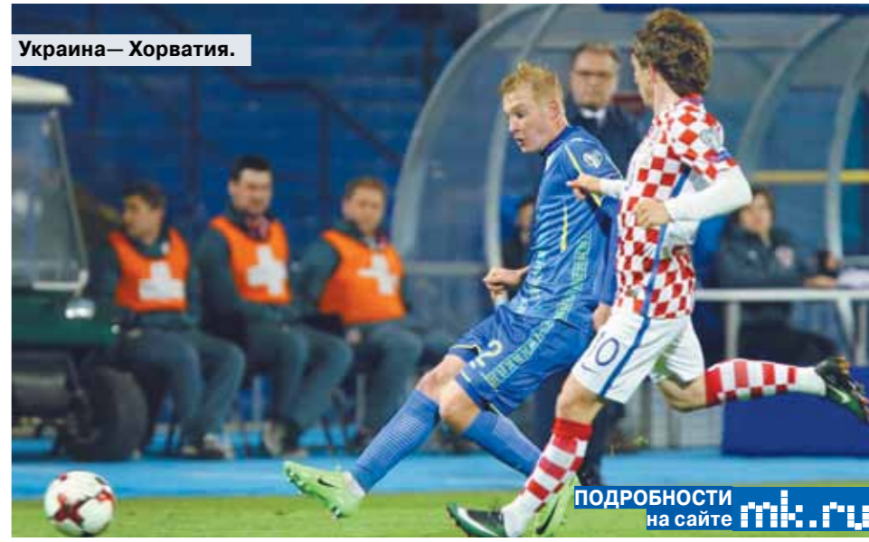
Украина — Хорватия.