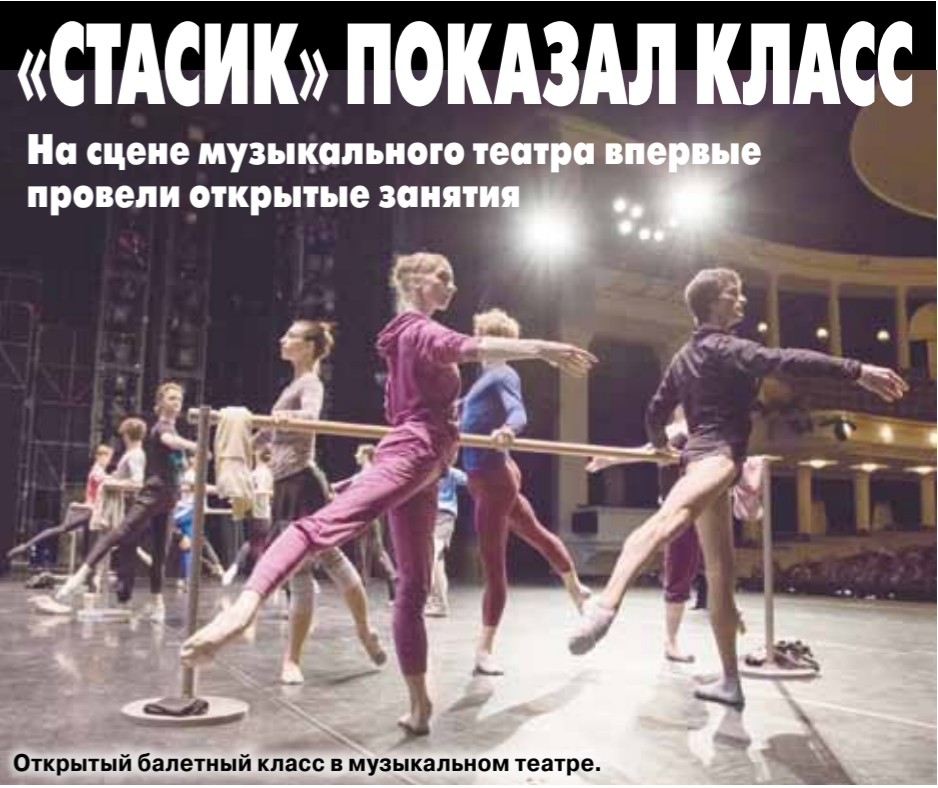
Открытый балетный класс в музыкальном театре.

Вот экс-этуаль Парижской оперы Илер все, наоборот, открыл, только не в Париже, а у нас, и не для каких-нибудь депутатов и министров, а сразу для всех поклонников.