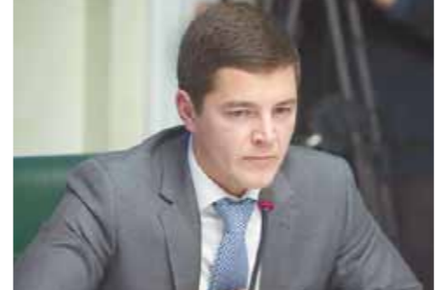
Самый молодой глава региона — 30-летний Дмитрий Артюхов.