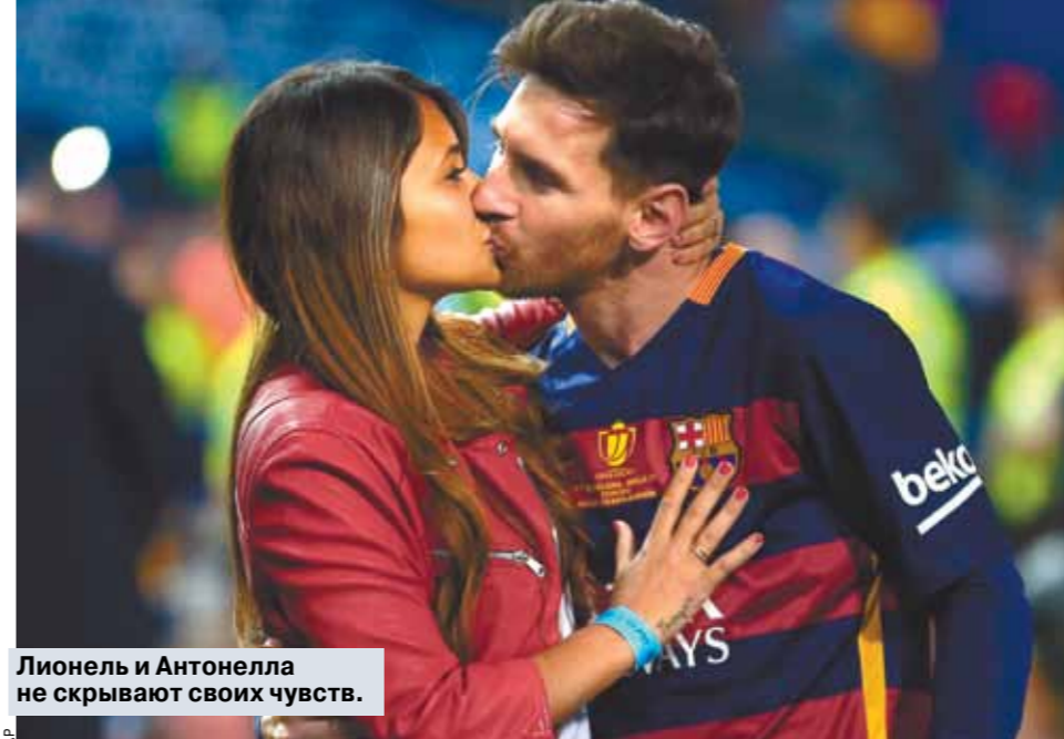
Лионель и Антонелла не скрывают своих чувств.