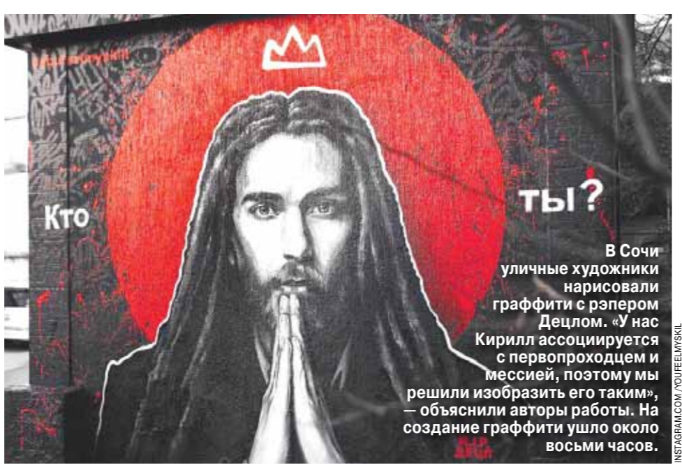
Кто ты? В Сочи уличные художники нарисовали граффити с рэпером Децлом. «У нас Кирилл ассоциируется с первопродцом и мессией, поэтому мы решили изобразить его таким», — объяснили авторы работы. На создание граффити ушло около восьми часов.

Близкие музыканту люди рассказали, что у него была «внутриутробная» связь с матерью и бесконечная любовь к сыну В среду Москва простится с рэпером Децлом. Слава на Децла обрушилась дважды. Первый раз, когда он был подростком. Второй раз — после смерти. Когда стало известно о кончине музыканта, его соцсети взорвались от количества добавленных подписчиков, лайков и комментариев. При жизни Кирилла Толмацкого дела шли гораздо скромнее. Как жил Децл последние годы, рассказали нам знакомые артиста. Читайте 4-ю стр.