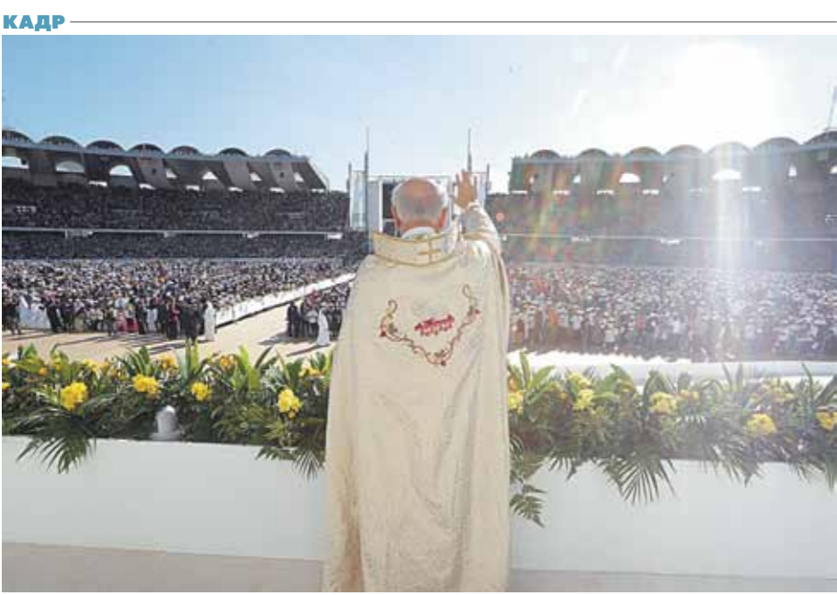
Папа римский Франциск отслужил мессу на стадионе в Абу-Даби. Это первая служба папы римского на Аравийском полуострове. На стадионе собралось 135 тысяч человек.