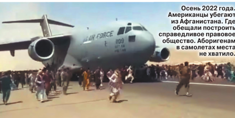
Осень 2022 года. Американцы убегают из Афганистана. Где обещали построить справедливое правовое общество. Абorigенам в самолетах места не хватало.