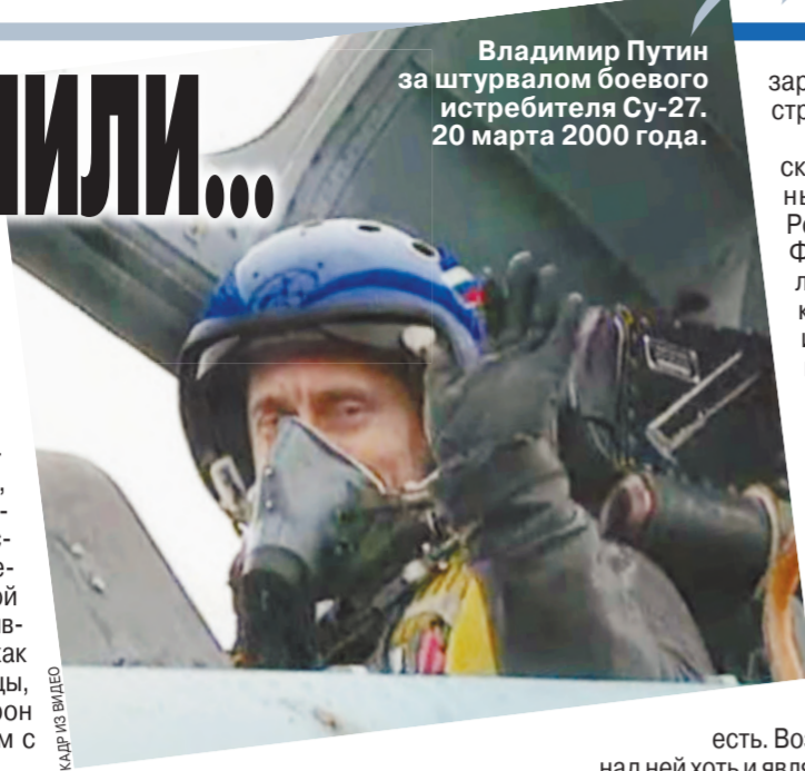
Владимир Путин за штурвалом боевого истребителя Су-27. 20 марта 2000 года.