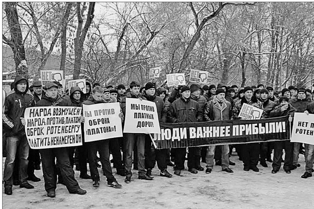
В Пензе дальнбойщики вышли на митинг. Они потребовали отставки министра транспорта России и отмены платы за проезд по дорогам, а также собрали сотни подписей под своими требованиями.

НА АКЦИЮ съехались водители со всей области. В их руках плакаты: «Люди важнее прибыли!», «Так и будут обдирать, если будем мы молчать!», «Мы против платных дорог!», «Мы против оброка «Платона»», «Нет — побору Ротенберга!»... Пресс-служба Пензенского обкома КПРФ.