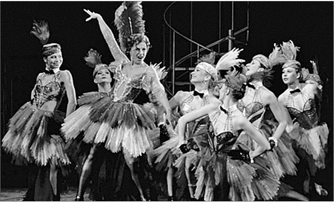
«Сильва» никогда не выходила из репертуара Московского государственного академического театра оперетты.

По горизонтали: 2. Один из приёмов исполнения музыки или пения. 5. Самостоятельная партия для одного певца или инструменталиста. 6. Дополнительное трубчатое колено в мундштучных духовых инструментах.