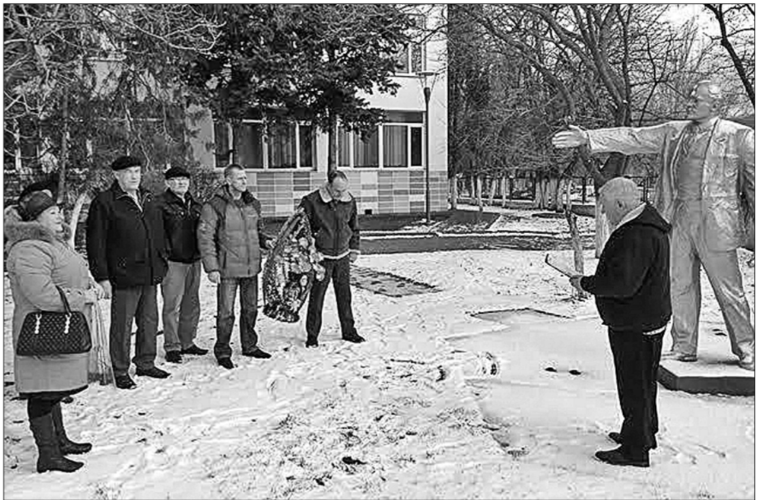
К 92-й годовщине со дня смерти В.И. Ленина коммунисты Судакского городского...