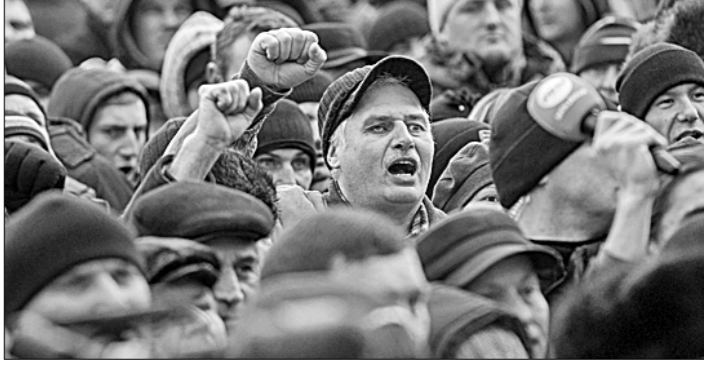
Митинговавших в Кишинёве поддержала 500-тысяч-

Митинг закончился объявлением ультиматума режиму Плахотнюка. В течение трёх дней, до вечера 28 января, власти должны дать ответ на требования резолюции, принятой на митинге. Если этого не произойдёт, а также в случае отрицательного ответа, протестные действия перейдут в стадию гражданского неповиновения, включая блокирование международных и национальных автомагистралей, железнодорожного и авиационного сообщения.