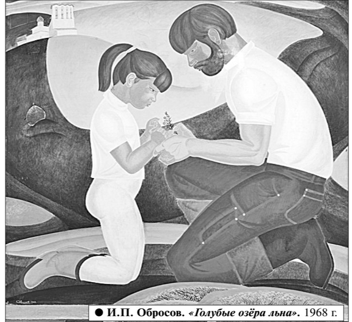
И.И. Обросов. «Голубые озёра льна». 1968 г.