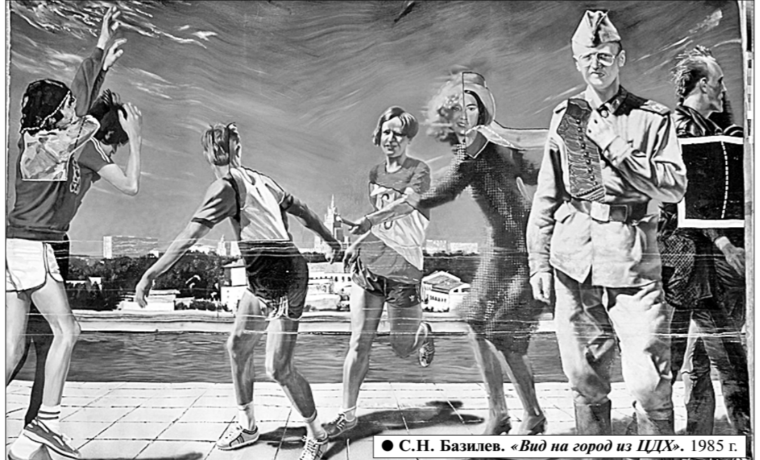
С.Н. Базилев. «Вид на город из ЦДХ». 1985 г.

ИХОТЯ в подзаголовке выставки уточняются значится: «бывший Союз художников СССР», её название прочитывается гораздо шире, более многогранно, ведь живое поколение людей, и многие из них ведут активную жизнь, для которых под словом «союз» подразумевается прежде всего Советский Союз. Да и по сути здесь нет никакого противоречия, ведь, рассматривая большинство из более чем двухсот работ, представленных на выставке, необязательно смотреть на подписи к полотнам, чтобы одним взглядом определить: здесь представлена во всём многообразии жизнь ещё недавно единой большой страны. И это естественно, потому что огромная коллекция Союза художников СССР формировалась на протяжении десятилетий из тех произведений, которые создавали жившие тогда художники, а они талантливо и самолюбиво, порой пафосно, порой простолюдно, переносили на холст то, что видели вокруг. А видели они всё разнообразие жизни. Здесь много портретов: и людей труда — туркменских ковровщиц, российских сельских тружениц, и тех, кто прославился своим творчеством — композитора Дмитрия Шостаковича, живописцев Георгия