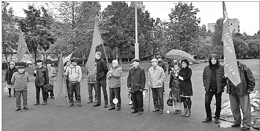
19 сентября в Вологде, на площади Чайковского, по инициативе коммунистов состоялся митинг «За честные выборы»...