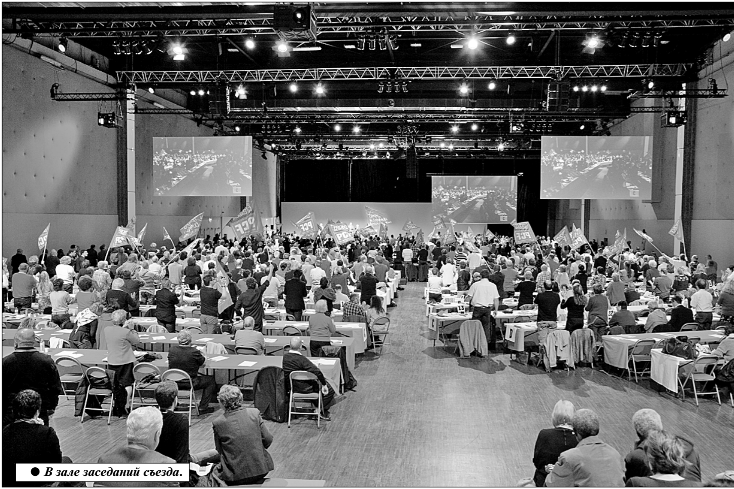
● В зале заседаний съезда.

Собравшийся в Парижских доках 2—5 июня съезд Французской коммунистической партии проходил на фоне продолжающихся массовых протестов в стране. Реформа трудового законодательства, затеянная президентом Франсуа Олландом, вызвала всеобщее возмущение. А потому вопросы внутренней политики занимали на съезде одно из главных мест.