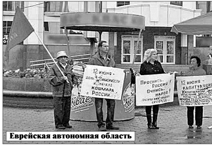
Еврейская автономная область