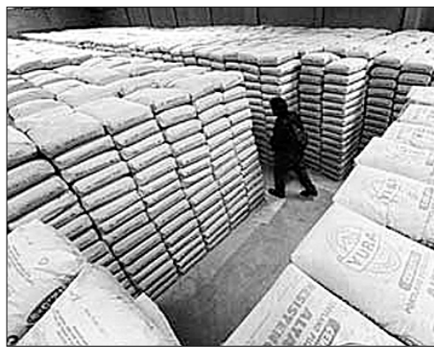
В 2017-м пройдут первые испытания, а полностью завод, согласно запланированному графику, начнёт действовать в 2018 году. Его производственная мощность рассчитана на 1,3 млн. тонн цемента в год.