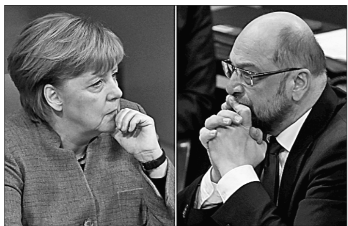
И Ангела Меркель, и Мартин Шульц пребывают в задумчивости.

Видимо, в невесёлом настроении встретила праздник католического Рождества глава временного правительства Германии Ангела Меркель. Ведь именно в его канун в ФРГ был установлен новый политический антирекорд: страна уже 90 дней живёт в условиях парламентско-правительственного кризиса (прежние «до-судение» — 86 дней было установлено в 2013 году, когда формировалась коалиция в составе ХДС/ХСС и СДПГ). Более того, лидеры ведущих партий Германии, по-прежнему блуждая в этом «политическом тумане», до сих пор никак не могут найти из него выхода.